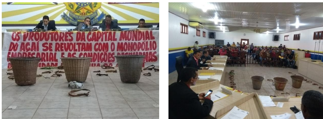
Figura 7- Sessão realizada na câmara municipal de Igarapé-Miri para discutir a queda do preço do açaí