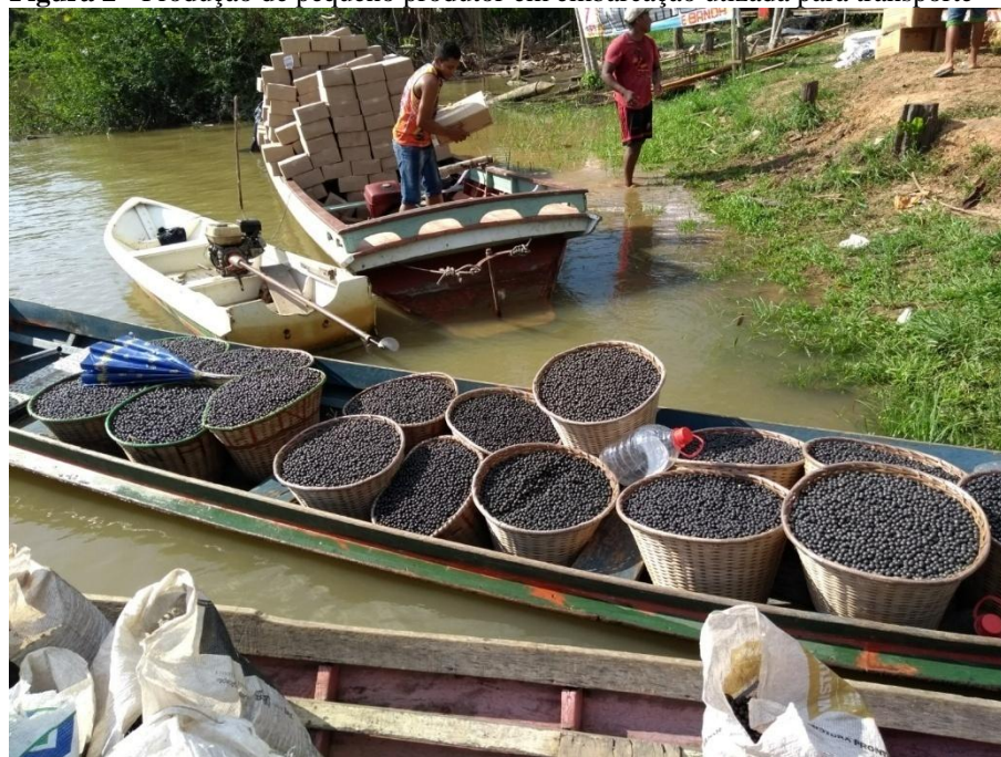
Figura 2 - Produção de pequeno produtor em embarcação utilizada para transporte