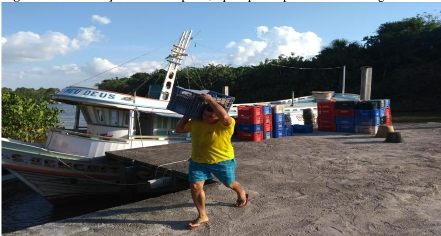
Figura 4 - Embarcação de médio porte, típica para a prática de marretagem

São comerciantes intermediários de açaí, residentes em sua maioria na zona rural, que se dirigem até pequenos e médios produtores para comprar, em atacado, os frutos a fim de revendê-los. Estes, beneficiam-se do fato de possuírem embarcações com capacidade para transportar grandes quantidades do fruto e de adquirirem a produção à vista. O açaí adquirido por este grupo é comprado em sua maioria de Pequenos Produtores é revendido para exclusivamente para Atravessadores na sede do município.