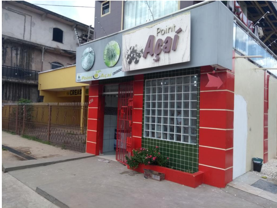
Figura 3 - Ponto de venda de açaí