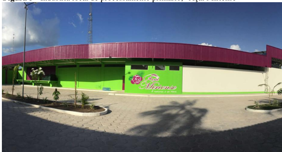
Figura 5 - Indústria local de processamento primário, "Açaí Miriense"