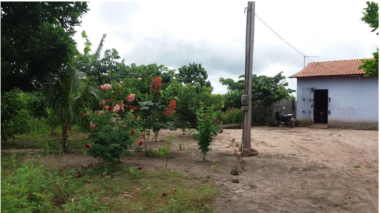
Fotografia 1 - Árvores e flores em frente à casa de um morador de Perseverança.