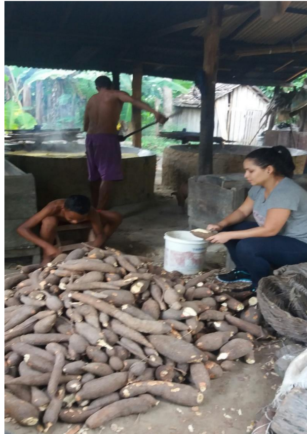
Figura 2 - A pesquisadora e o trabalho de fazer farinha de mandioca.