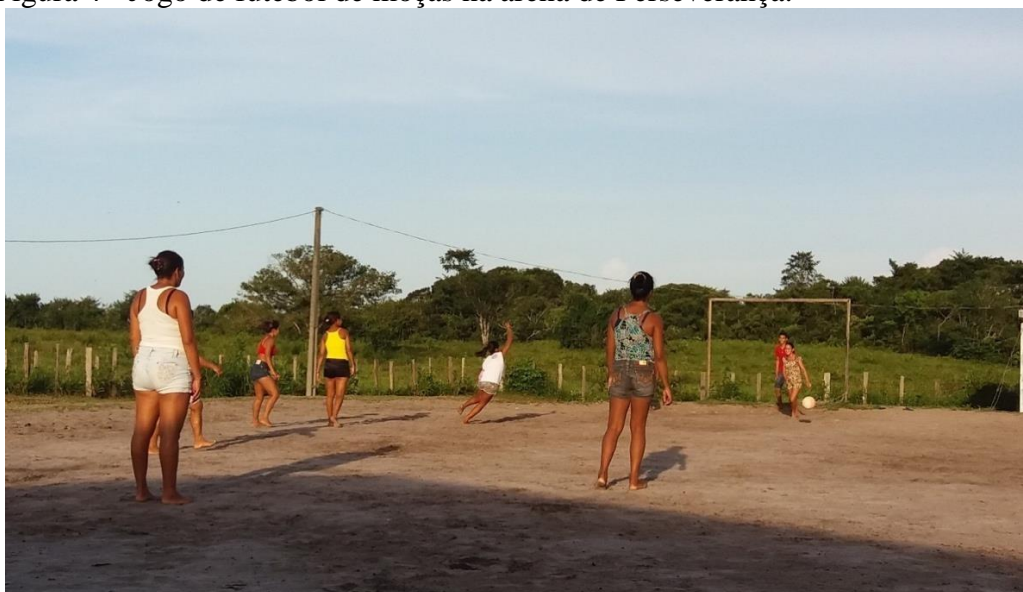
Figura 4 - Jogo de futebol de moças na arena de Perseverança.