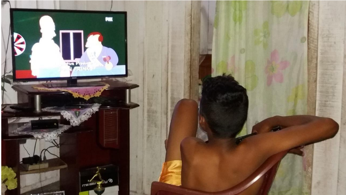
Fotografia 3 - Jovem de Perseverança assistindo um famoso desenho animado de uma rede americana de televisão.

rurais amazônicas onde vivem são retratadas como lugar de natureza exuberante, vida harmônica com a “mãe” natureza e de tranquilidade; espaço de produção de vida social e material; lugar de alimentação saudável, ar puro e vida sossegada, enfim, lugar bom de viver (FREIRE, 2009; p 284).