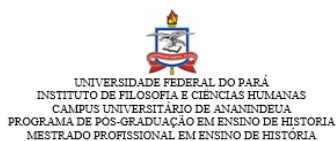
FIGURA 4 – IMAGEM DO DOCUMENTO DE SOLICITAÇÃO PARA A APLICAÇÃO DE INSTRUMENTO PEDAGÓGICO