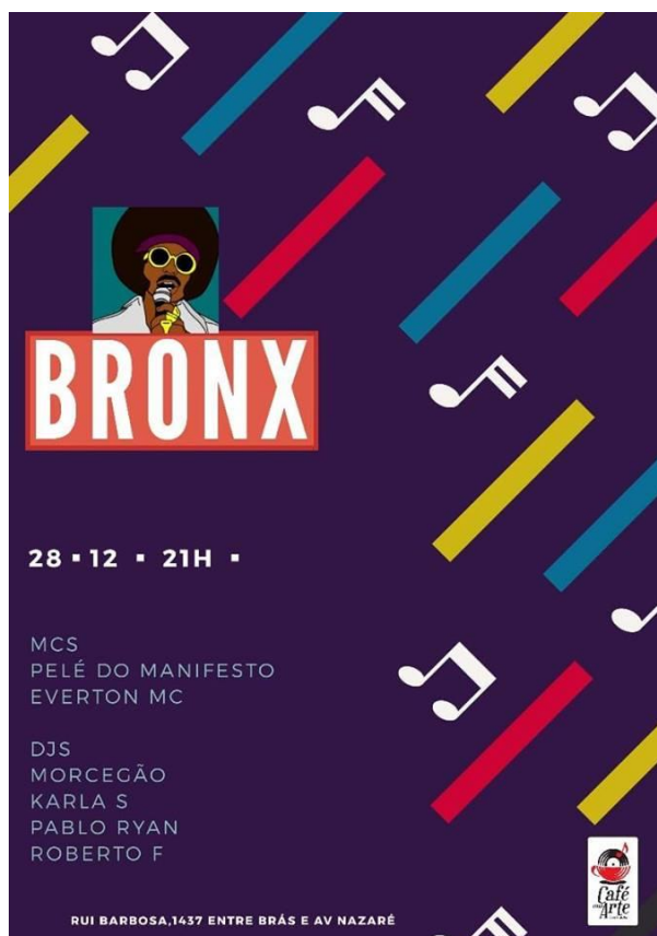
FIGURA 1 – FLAYER DE DIVULGAÇÃO DO SHOW DE PELÉ DO MANIFESTO E OUTROS INTEGRANTES DA CENA DO HIP HOP DE BELÉM