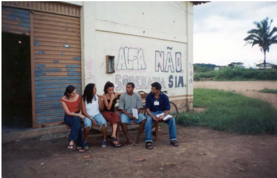
Figura 2 – Entrevista com filho de assentado de Palmares

Considerou-se que, mesmo havendo níveis de comportamento e interesses diferentes de estrato para estrato, dentro do mesmo estrato as compreensões e posicionamentos em relação à temática em estudo, ou seja, a produção e sua organização, seriam senão idênticas, mas pelo menos similares. E ainda que, de acordo com a quantidade de famílias pertencentes a cada núcleo (considerado como um estrato), deveria ser retirada uma quantidade variável destas famílias para observação. Assim, foi abordada uma quantidade que variava de no mínimo uma e no máximo três famílias por núcleo do assentamento, considerando todos os trinta e oito núcleos hoje em funcionamento.