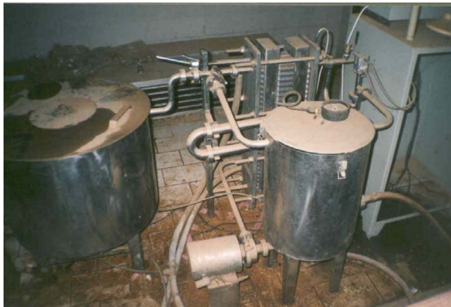
Figura 4 - Alguns equipamentos pertencentes à fábrica de laticínios

Um bom exemplo em relação a esta situação é dado pela fábrica de laticínio. O projeto elaborado pela Cooperativa Mista dos Assentamentos de Reforma Agrária da Região Sul e Sudeste do Pará (Coomarsp), em março de 2000, indicou que a referida fábrica possuía uma capacidade produtiva/ano de aproximadamente 752.000 litros de leite, o que daria uma média, também aproximada, de 3.000 litros/dia para que fosse garantida a viabilidade econômica deste laticínio, conforme informam os técnicos da referida cooperativa. O levantamento da produção econômica, que será mais especificamente abordado no próximo capítulo desta pesquisa, apontou uma coleta média de 2.146 litros por dia no assentamento e, uma produção total atual estimada, considerando o consumido e o comercializado, de 633.070 litros/ano,, ainda inferior à quantidade necessária/dia para que a fábrica possa garantir, com segurança, a sua viabilidade econômica.