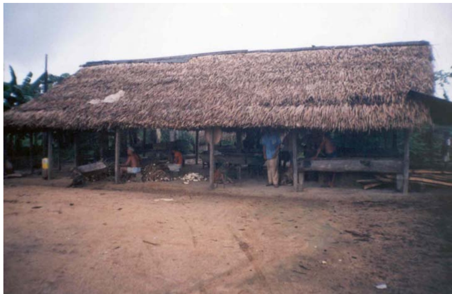
Figura 6 - Típica “casa de farinha” da região

fina, bastante consumida na região. Inferindo-se novamente para o universo das 517 famílias do assentamento, tem-se um montante de 337.035kg de mandioca in natura , estimativamente comercializada e/ou consumida na safra 2002/2003.