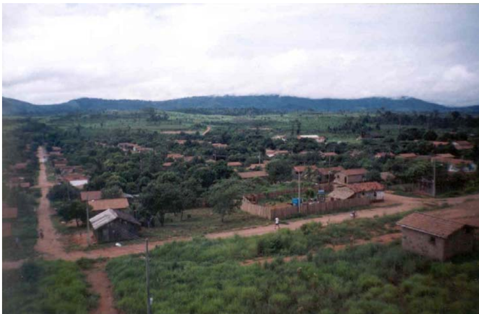
Figura 1 - Parte da agrovila de Palmares

Brasília. Desta vez, finalmente, depois de um ano e quatro meses de luta, os sem terra conseguiram que fosse desapropriada outra parte da Fazenda Rio Branco, que recebeu o nome de Assentamento Palmares em homenagem a resistência de Zumbi, líder dos escravos que fugiam do cativeiro no século XVII e ao Quilombo de Palmares, o maior de todos os que existiram.