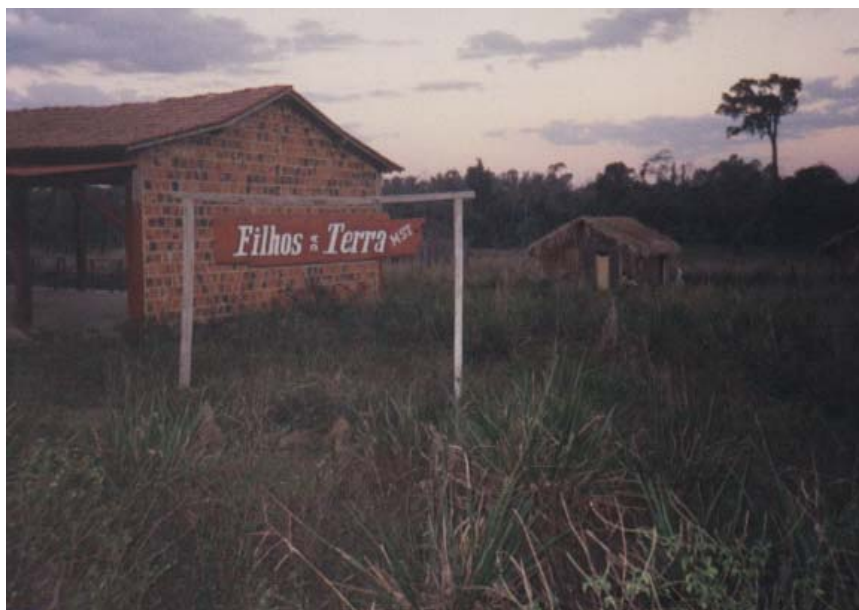
Figura 9 – Núcleo de família “Filhos da terra”