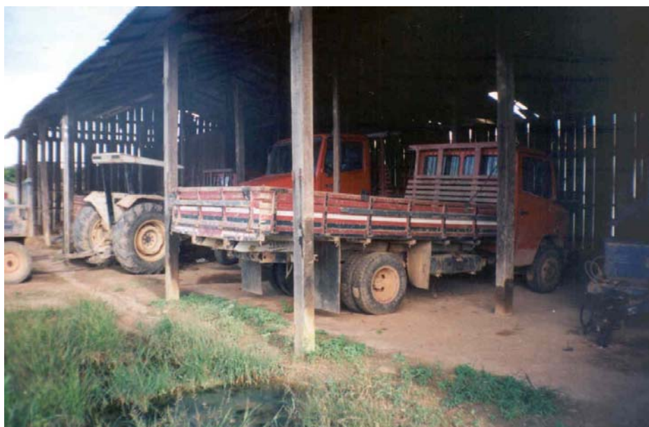
Figura 3 - Alguns veículos danificados pertencentes a Palmares

O capital circulante também poderia ser utilizado, caso existisse, na aquisição de peças e serviços destinados a recuperar a frota de veículos do PA Palmares, que hoje se encontra bastante reduzida, com vários tratores e caminhões quebrados e, conseqüentemente parados, estando ainda alguns outros funcionando precariamente, necessitando de serviços mecânicos e troca ou compra de novas unidades de reposição para poder funcionar normalmente. Além de haver uma grande dificuldade em relação à compra de óleo diesel para atender as máquinas e equipamentos do assentamento.