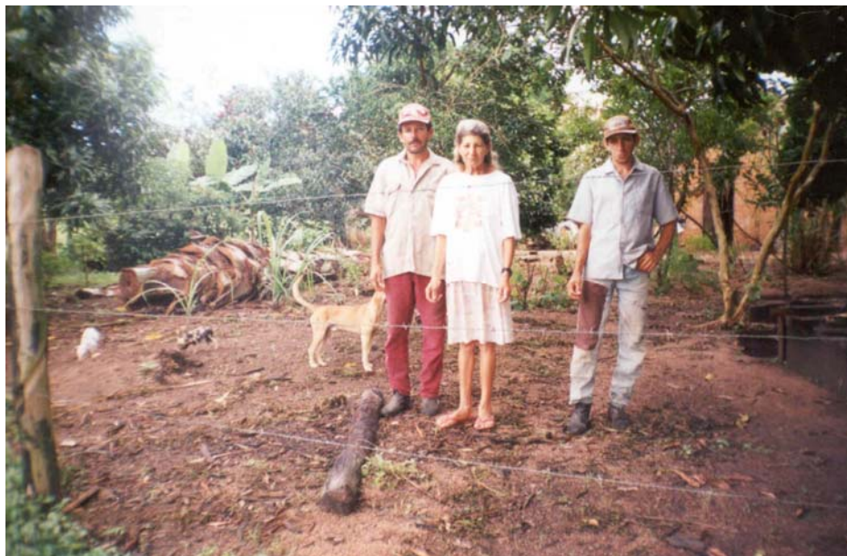
Figura 8 - Família de assentados do PA Palmares

Um outro ponto, também com 7,62% das 105 opiniões emitidas, refere-se à falta de assistência técnica e extensão rural no assentamento, influenciando diretamente o sucesso dos financiamentos. Esta questão já foi inclusive observada no Capítulo 3 deste trabalho, que falava sobre os motivos do insucesso da primeira experiência de grande produção econômica vivenciada em Palmares. Também junto a esta questão, foi apontada a falta de pesquisas técnicas desenvolvidas na região.