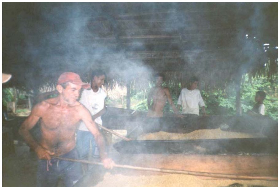
Figura 7 – Agricultor produzindo farinha em Palmares

farinha de mandioca no assentamento, elevando a produção total para 426.703kg. O que certamente daria um importante salto na rentabilidade deste tipo de produção.