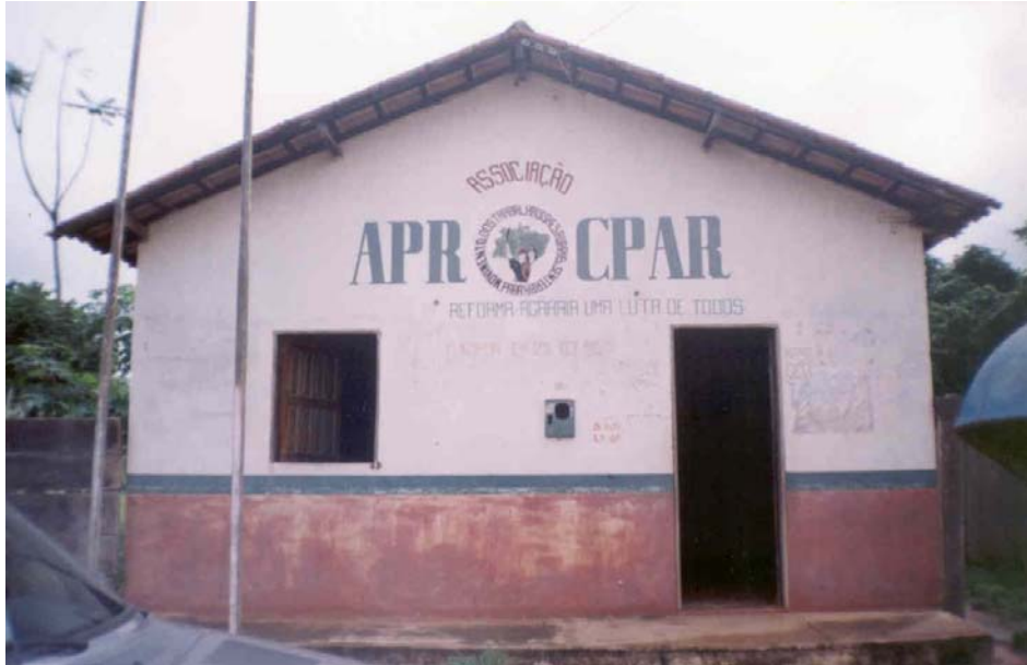
Figura 5 – Sede da Aprocpar

composta pelos seus membros diretores em conjunto com os coordenadores dos núcleos de família ou de produção do assentamento (APROCPAR, 2002).