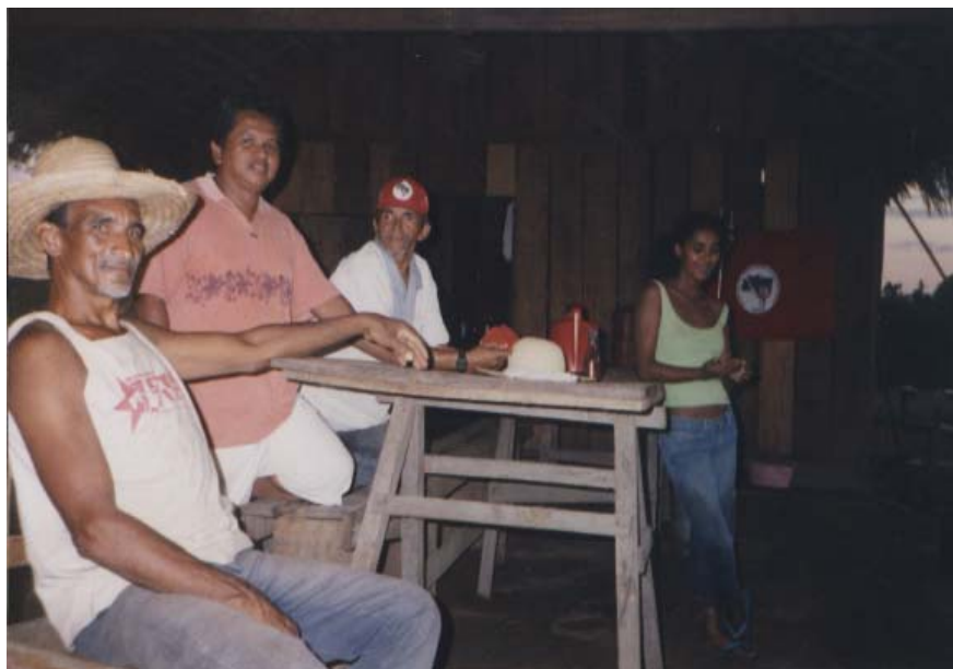
Figura 10 - Reunião do núcleo “Filhos da terra”