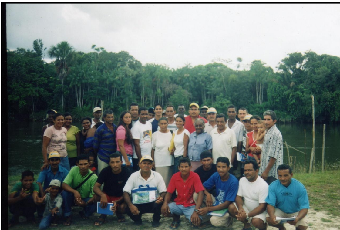
Fotografia 01: Moradores da Comunidade de Marupaíba