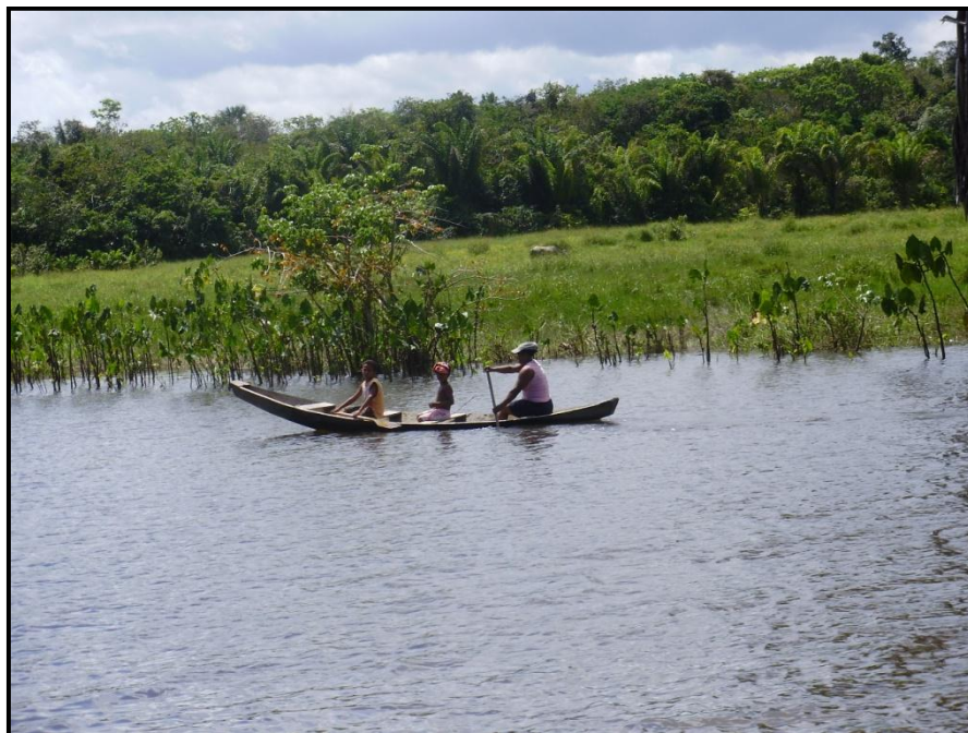
Fotografia 11: Canoa

É contra essa forma de ser trabalho que o capital investe. Para Diegues (2005), esses projetos alteram profundamente o modo de vida das populações locais na Amazônia, provocando, como consequência, um reordenamento nas formas de trabalho e no mundo cultural de grupos sociais.