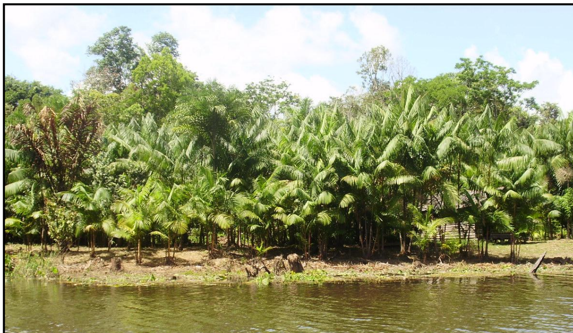
Fotografia 14: Plantação de açaí

O açaí se constitui em um exemplo emblemático. Antes totalmente destinado ao consumo local, hoje conquistou novos mercados e se tornou importante fonte de emprego e renda. A venda de polpa congelada para outros estados cresce a taxas de 30% ao ano. As exportações da polpa ultrapassam mil toneladas por ano (NOGUEIRA, 2005).