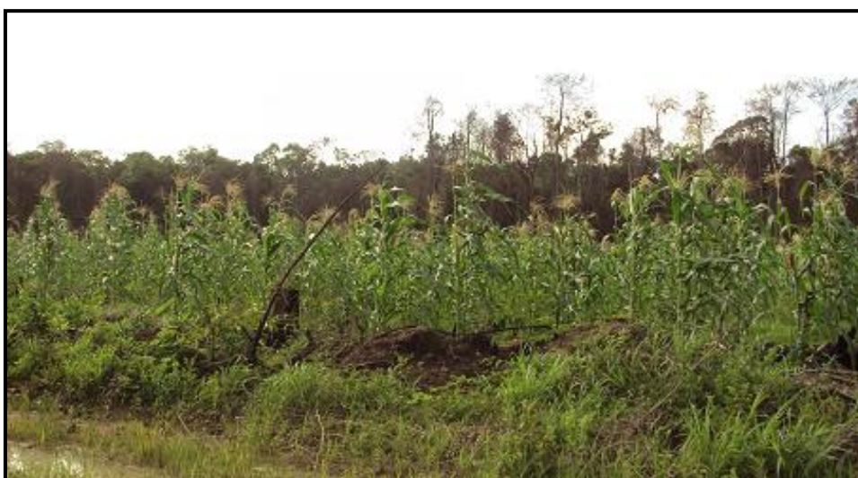
Fotografia 13: Roça implantada no sistema tradicional

A pesquisa revelou que 100% dos agricultores entrevistados plantavam mandioca e produziam farinha d'água para consumo de suas famílias e para venda no mercado, assim como 100% também tinha como ocupação além da agricultura, o extrativismo da madeira. Destes 80% produziam milho e arroz, 50% banana, 30% criavam porcos e galinhas, 30% referiram-se a caça e pesca como atividade, 10% referiu-se ao cultivo do açaí para venda, 10% praticava o extrativismo do mesmo produto apenas para consumo e ainda 10% plantava feijão também para consumo. É importante observar que o feijão era produzido apenas pelo entrevistado que não é paraense, o que faz parte de sua cultura.