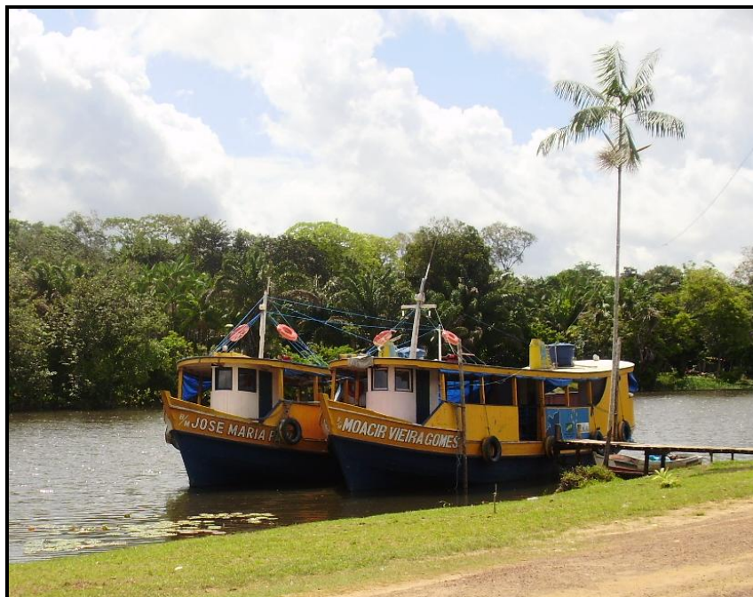
Fotografia 12: Barcos da prefeitura para transporte de alunos

A maioria das famílias ainda reside em seus lotes de terra e a escola está localizada na agrovila que teve seu processo de expansão acelerado a partir do ano de 2006. Apesar de a primeira escola datar dos anos 1970, sua estrutura física era composta por apenas uma sala de aula até o ano de 2008 quando foi ampliada e hoje conta com 05 salas de aula, sala da direção, biblioteca, pátio, cozinha, banheiros e 02 (dois) barcos para transporte de alunos. O ensino noturno para adultos implementado em 2008, quando da reforma da escola, atende cerca de 100 alunos.