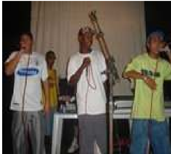
SeqüestrodamentE no Açaí Biruta, outubro de 2007

Aqui neste trecho da música, Edi Rock, mc dos Racionais, narra uma situação cotidiana na vida de quem é embobrecido e negro, a geral , ou como é conhecido em Belém, o baculejo , que se trata da abordagem policial com revista, na maioria das vezes de forma truculenta e ativadora de preconceitos raciais e sociais.