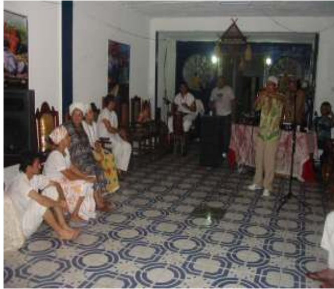
Eu fazendo uma apresentação no terreiro de candomblé Angola “Mansu Nagetu”

Pois vejam bem, acho que existe, nesta perspectiva que estou apresentando para vocês, uma troca recíproca entre conhecimento religioso e antropológico, na mediada em que digo que reconheço “semelhanças estruturais”, no sentido estrito de formas, entre o êxtase na BRG e no Candomblé. Alio a isso então, a minha possibilidade de experimentar o transe a partir de técnicas religiosas. Técnicas! Ou seria poder mediúnico, mana ou axé 89 ? Acho que os dois, cada um em sua esfera de compreensão e utilização.