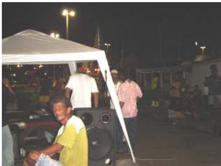
Alma Livre Sound System fazendo festa de rua no Ver-o-Peso, Belém-2006

A cultura Hip Hop tem suas origens nos imigrantes jamaicanos, que se instalaram no Bronx e Harlem 50 , entre eles o que ficou mais conhecido, o Dj Kool Herc, que trazem o para os guetos nova-iorquinos o costume das festas promovidas nas ruas, onde para animar o público eles falavam em cima dos breaks da música, nascia assim o RAP. Esse estilo era, e ainda é, baseado em vocal falado, pelo MC ou Mestre de Cerimonias, em forma de “crônica” que utiliza samples eletrônicos como base musical.