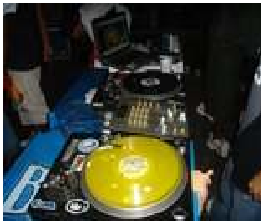
Kit básico para se produzir samples e colagens : Par de Toca Discos, vinis e um mixador.

No texto etnográfico, a um tempo venho percebendo duas técnicas (lógico que no plano da analogia) já conhecidas por mim no rap, o sample e a colagem . Em relação ao primeiro poderia dizer que estou pretendo, e espero estar conseguindo, utilizá-lo ao máximo de uma forma que um mc venha a ler meus textos e percebam esta minha estratégia, bem como um antropólogo comece a entender esta lógica, muitas vezes confundida, e até caracterizadas legalmente, como plágio. Uma vez ouvi de um mc que o sample deveria ser encarado como “homenagem e não roubo”, sendo assim o que fazemos quando a favor de nossas análises, estamos pautados em certo método (s), arcabouço teórico (s) e conceitos? Estamos criando uma “base” 47 , onde desenvolveremos nossa prosa etnográfica.