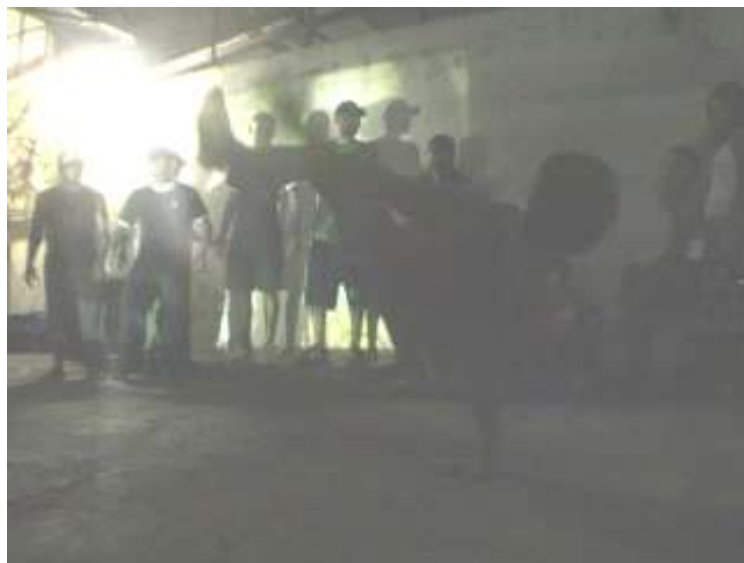
B. Boys do “Estilo de Belém” e “Amazon B.Boys” na festa de ragga/hip hop La quebrada em Belém

É válido ressaltar, também, a importância atribuída pelas pessoas envolvidas na cultura Hip Hop, aos filmes Beat Street e Collors: as cores da violência onde mostravam a realidade dos jovens norte-americanos moradores dos guetos. O Hip Hop em Belém como em quase todo o Brasil, inicia através do Break, e em 1998 começam a se reunir primeiro na Praça da República, e posteriormente na Praça Waldemar Henrique, Dj's MC's e que majoritariamente irão se organizar dentro da cultura.