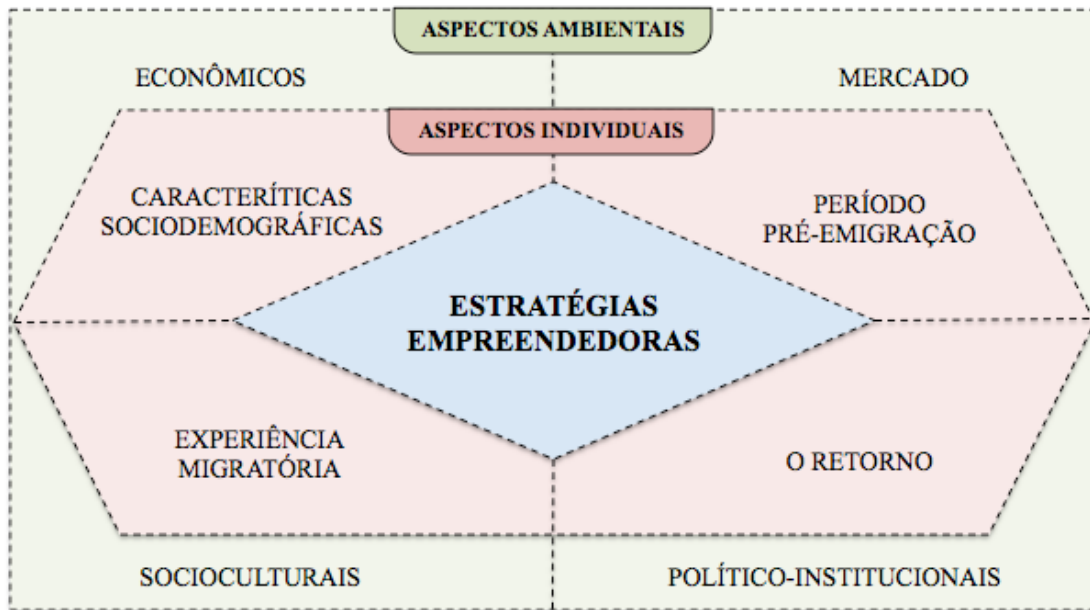
Figura 02 - Modelo de análise utilizado para compreender as estratégias mapeadas