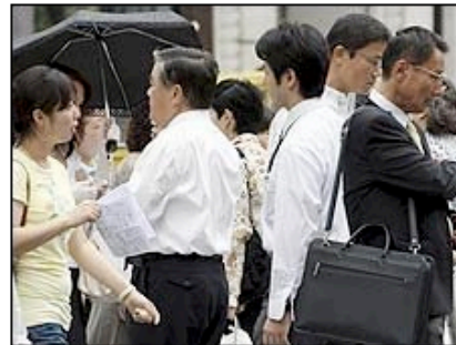
O fim da recessão ainda não foi sentido pelos japoneses

O total de desempregados no país chegou a 3,5 milhões e aumentou pela nona vez consecutiva. Em junho, o índice foi de 5,5%.