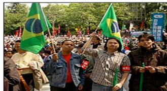
Imigrantes brasileiros protestaram em Tóquio e em Hamamatsu

Em Tóquio e em Hamamatsu, imigrantes brasileiros também fizeram manifestações, em protesto contra a discriminação de estrangeiros no mercado de trabalho.