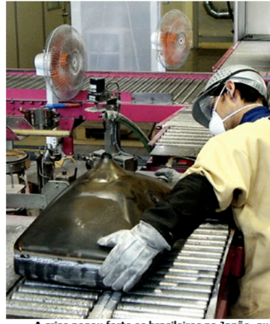
A crise pegou forte os brasileiros no Japão, que tiveram de enfrentar aumento de desemprego, além da diminuição de salários

O professor comparou os dados com um estudo semelhante realizado em 2007 e os resultados mostram o difícil cenário econômico dos de kassegi. Quanto ao desemprego, houve um aumento significativo de 4% para 26%. Ou seja, se, em 2007, a cada 25 pessoas uma estava desempregada, em 2009 essa proporção subiu para uma em quatro.