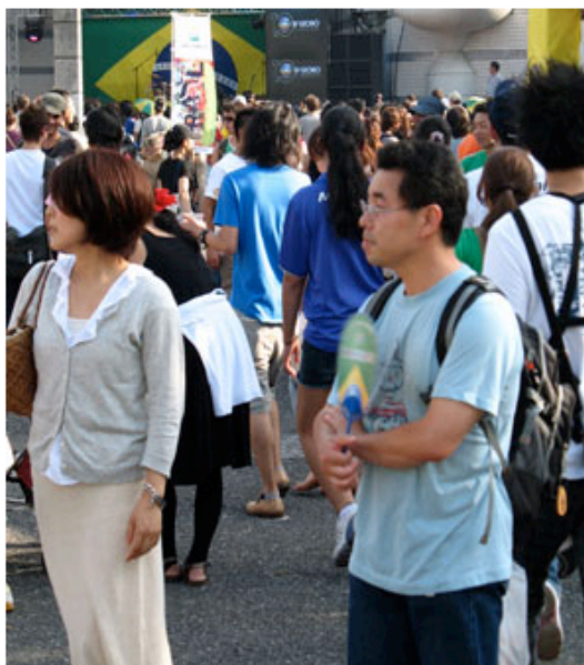
Brasileiros no Japão: apesar da diminuição, comunidade ainda é a terceira maior de estrangeiros no arquipélago

O Ministério da Justiça deve divulgar, em breve, o número de brasileiros em cada cidade. Todos os anos, entre junho e agosto, o órgão apresenta relatórios com os dados sobre os estrangeiros que residem e trabalham no Japão.