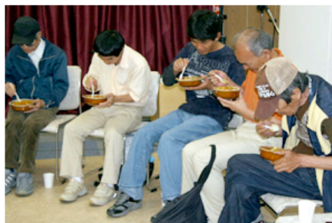
Após o culto, desabrigados recebem um prato de arroz com curry, roupas e podem conversar sobre seus problemas

No dia 16 de maio, a unidade em Hamamatsu da Igreja Praise Church foi inaugurada com um culto para japoneses seguido de distribuição de alimentos. A igreja está também em outras duas localidades, Iwata (Shizuoka) e Okazaki (Aichi).