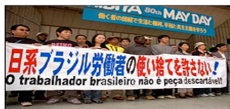
Brasileiros reclamam de discriminação no mercado de trabalho

Na cidade, segundo associações locais, cerca de 30 famílias já deram entrada no pedido e devem embarcar de volta ao Brasil no começo de maio. Mas muitos dekasseguis consideram a medida discriminatória e reclamam do fato de o governo não permitir que os beneficiados pelo esquema possam retornar ao Japão a curto prazo.