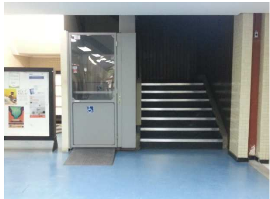
Figura 07- Plataforma na Biblioteca Central

A prefeitura desenvolveu uma proposta de sinalização para todo o campus no ano de 2013. O projeto não pôde ser concretizado por falta de verbas, o que ocasionou em sua modificação para atender apenas ao setor básico da UFPA, a qual também aguarda liberação do orçamentário.