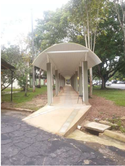
Figura 01- Passarela TIPO 1- Bi- apoiada.