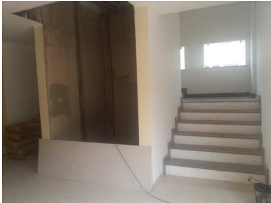
Figura 06- Instalação de elevador em novo prédio. Fonte: Elaborada pela autora. 2014.

Mesmo diante de recursos escassos e demandas diversas, a prefeitura tem buscado desenvolver projetos que viabilizem o acesso de Pessoas com deficiência na UFPA. Esse empenho tem esbarrado, muitas vezes, na falta de recursos financeiros para continuidade de execução das obras.