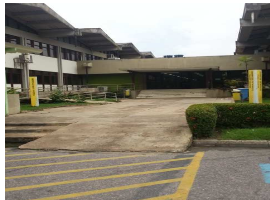
Figura 05- Rampas de acesso à Biblioteca Central.

Com relação às plataformas 17 e elevadores, tivemos acesso ao levantamento da DIESF (ANEXO) dos equipamentos existentes, previstos e dos locais onde é necessária a instalação. Com base nessas informações, elaboramos uma tabela para melhor visualização: