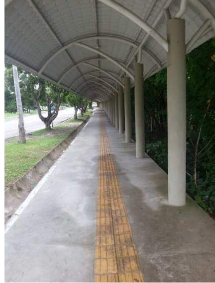
Figura 02- Passarela TIPO 2-B- engastada.