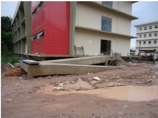
Figura 04- Construção de rampa em edifício.

Quanto às rampas, todos os prédios novos as possuem. Nos edifícios mais antigos, foram feitas adaptações para sua implantação. A rampa da biblioteca central, por exemplo, foi uma das primeiras a ser construída no campus Belém. Ela foi motivada por ação do Ministério Público do Estado, o qual acionou a universidade e o então Conselho Regional de Engenharia, Arquitetura e Agronomia do Pará- (CREA) 16 para organizarem uma comissão para a construção da rampa.