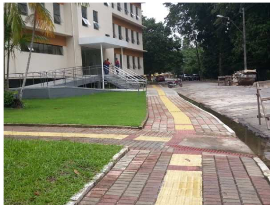
Figura 03- Passarela TIPO 2-A- descoberta. Fonte: Elaborada pela autora. 2014.

A DIESF apresentou-nos relatório do processo 311152/2010, cujo objeto é a contratação de empresas para a execução das passarelas, nos seus diversos tipos. Estimou-se a construção de 5.425 m 2 de passarelas, distribuídas como discriminado abaixo: