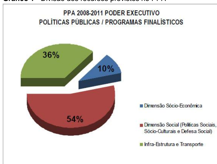
Gráfico 1 - Divisão dos recursos previstos no PPA