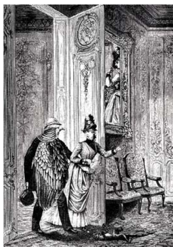
Figura 1- Une semaine de bonté , de Max Ernst, colagem surrealista.

Por sua vez, nos romances-colagens surrealistas, “Max Ernst procede de outra forma ao inserir sobre uma ilustração já existente [...] que atua como fundo ou suporte, elementos plásticos procedentes de outras ilustrações, que vêm modificar aquela” (Arbex, 2002, p. 219). A autora enfatiza o uso de ilustrações retiradas de jornais, revistas ilustradas e, principalmente, folhetins, todos do século XIX.