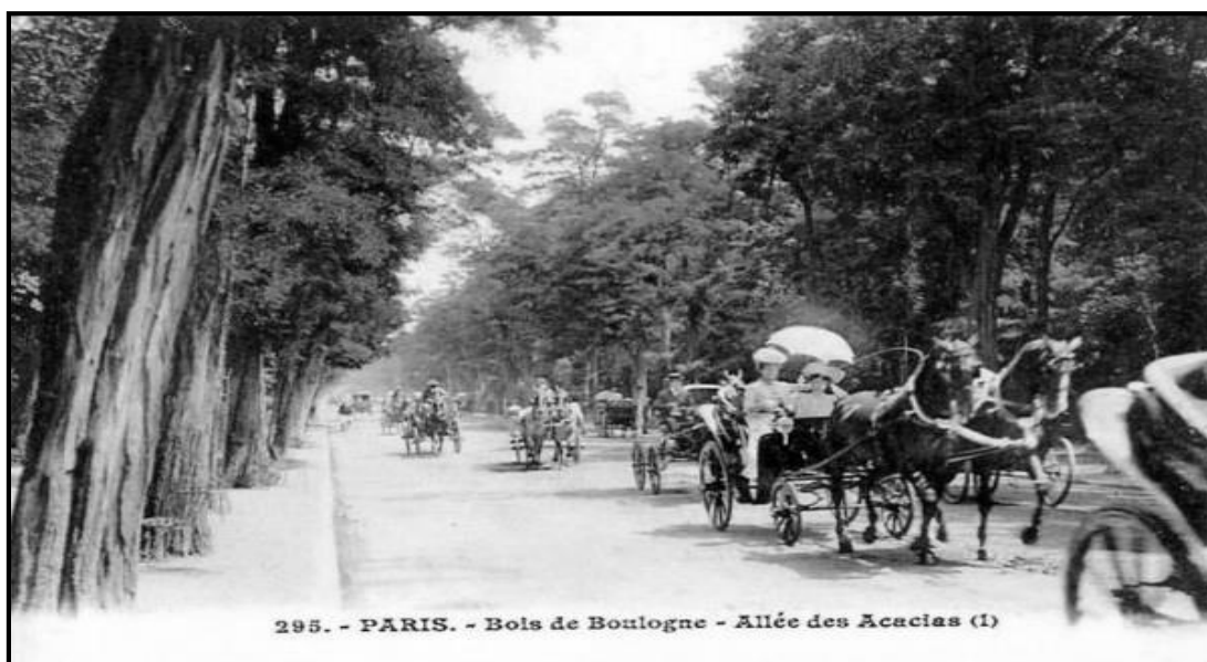
Figura 6. Passeio no Bois de Boulogne

Muito posteriormente quando foi intendente da cidade de Belém, Gama e Abreu inaugurou o Bosque Municipal, no Marco da Légua, bairro periférico da cidade, um local certamente inspirado no Bois de Boulogne e no Prater. Demonstrando que as viagens a Europa feitas por Gama e Abreu tinham uma perspectiva prática que se refletia em sua atuação política.