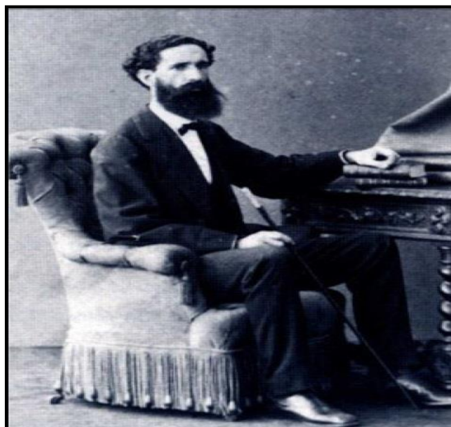
Figura 1. José Coelho da Gama e Abreu, Barão do Marajó.

A memória de suas obras como presidente da Província e intendente da cidade de Belém é muito pouca (como a Rua Gama Abreu localizada no bairro do Comércio); a imagem de José Coelho da Gama e Abreu é principalmente do estudioso, como nos sugere a fotografia abaixo, na qual vemos a pose séria e centrada, sua barba muito longa, sugerindo experiência, uma idade mais avançada e vestindo um traje elegante.