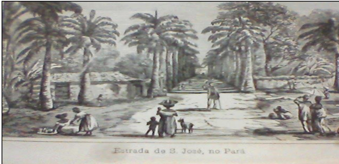
Figura 4. Estrada de São José por Raphael Bordallo Pinheiro.

Fonte: ABREU, José Coelho da Gama. Do Amazonas ao Sena, Nilo, Bósphoro e Danúbio: Apontamentos de Viagem . Lisboa: Typographia Universal, 1874.