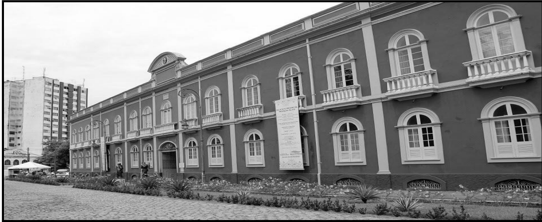
Figura 12. Antigo Paço Provincial do Amazonas, atual Museu de Numismática, Pinacoteca e outras instituições.