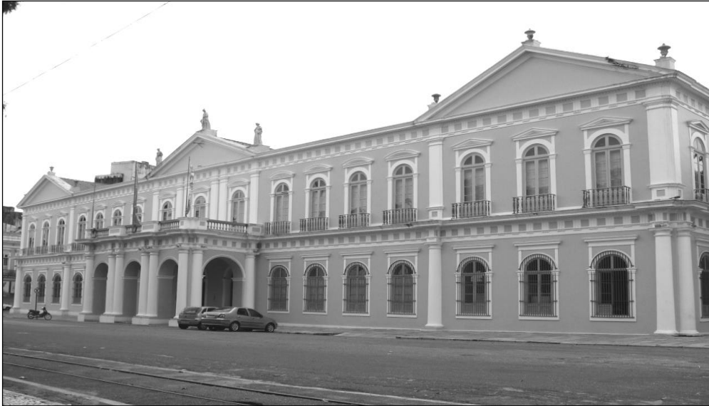
Figura 18. Fachada do Paço Municipal/Palácio Antonio Lemos.