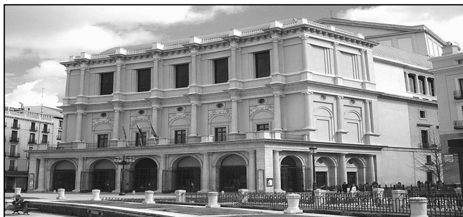
Figura 5. Teatro Real do Oriente em Madrid

Na cidade de Madrid, se destacava o Teatro Real do Oriente, que unia de forma elegante os estilos árabe e europeu, primando pelo conforto e com esmero nos detalhes, assim observou o autor: “as magníficas poltronas da plateia, forradas de veludo carmesim fazendo sobressair o vestuário das senhoras que como em Paris ocupam grande parte da plateia, os camarotes suntuosamente adornados (...)”. 263