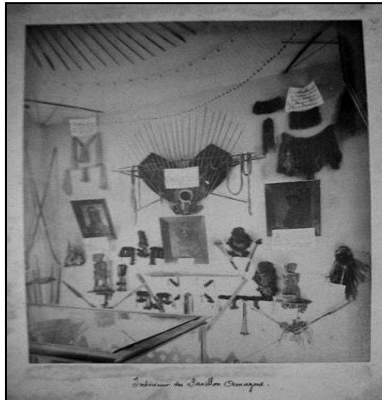
Figura11: Palais de l' Amazone.

Com o museu, as sociedades indígenas (fonte da imagem negativa) teriam sua “morte anunciada” em nível internacional. Assim, os intelectuais amazônicos e o organizador Ladislau Netto colocavam estas sociedades como algo que estava realmente no passado ou que brevemente estaria. Com os índios visíveis apenas nas coleções de museus, conservava-se morto o passado e se abria espaço às novas possibilidades do futuro. A exposição na Retrospectiva das Habitações Humanas tornava-se uma grande oportunidade para expor uma imagem de civilidade amazônica diante dos outros estados e também de outros países, agradando também aos que apreciavam o exótico.