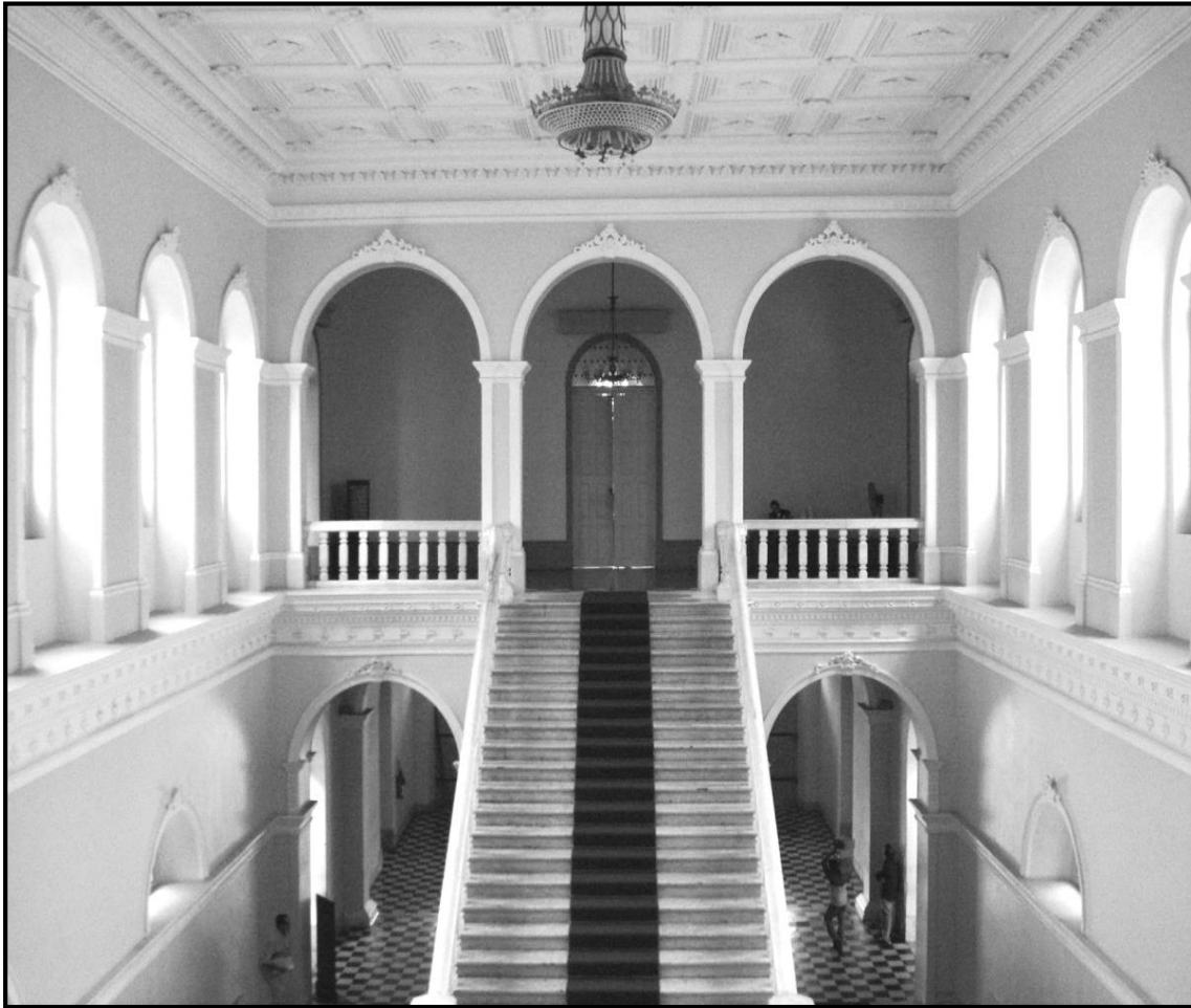
Figura 14. Escada do Paço Municipal/Palácio Antonio Lemos