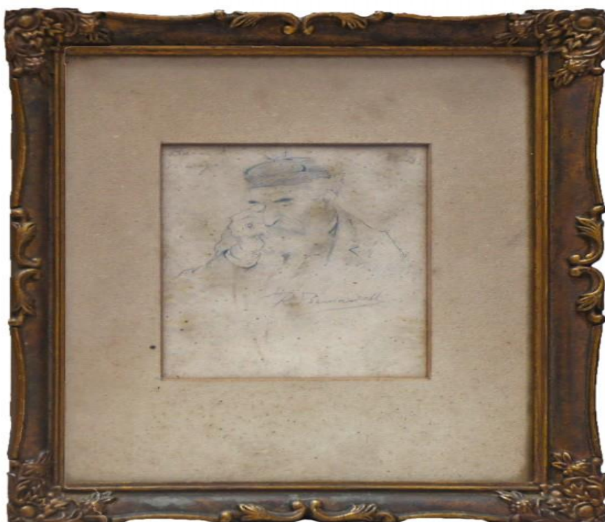
Figura 16. "Portrait do Barão de Marajó (José Coelho da Gama e Abreu, 1832-1906)", grafite, 13 x 10. Estudo para o busto de bronze. Por Rodolfo Bernardelli.

Fonte: disponível no site http://centurysarteeleiloes.com.br/ . Acesso em 10 de janeiro de 2015.