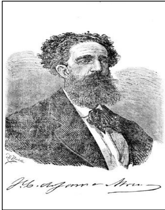
Figura 3. Desenho de Gama e Abreu por Raphael Bordallo Pinheiro.