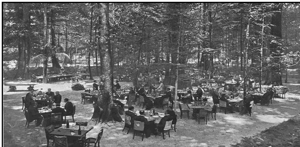
Figura 17. Banquete dos intendentess em 1903.