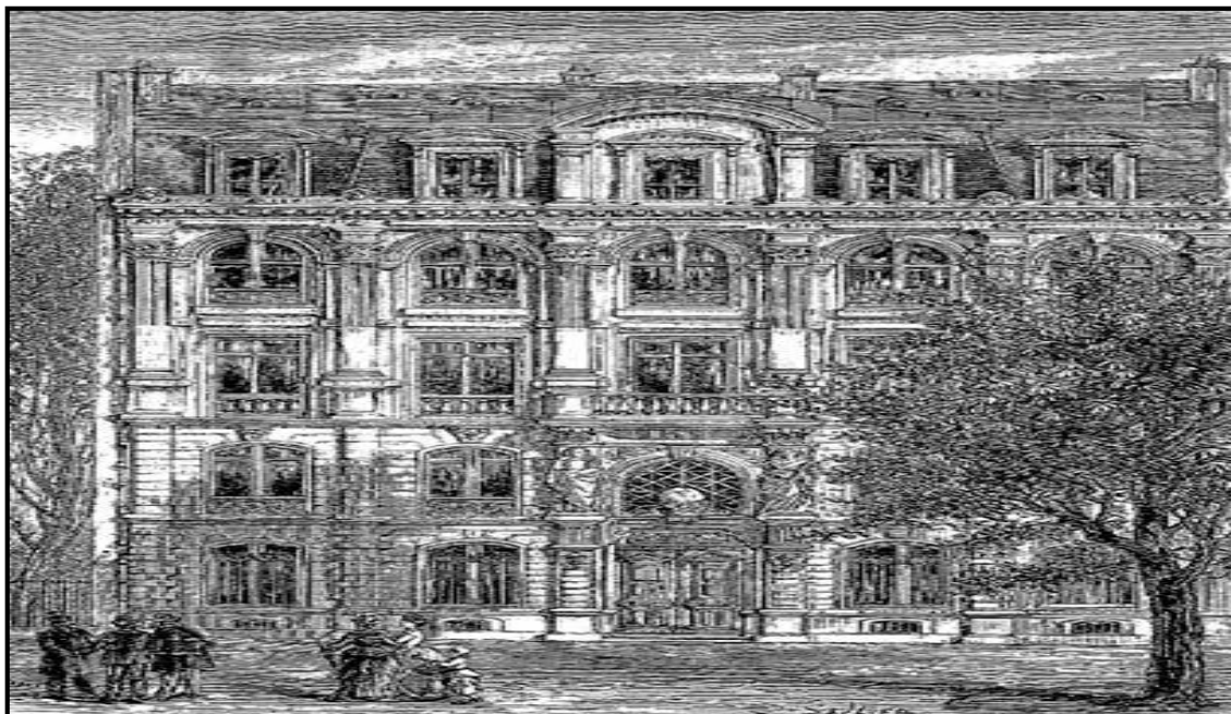
Figura 7. Prédio da Sociedade de Geografia, Boulevard Saint-Germain em Paris.

(curador dos manuscritos orientais da Bibliothèque du Roi e especialista em línguas orientais). 378