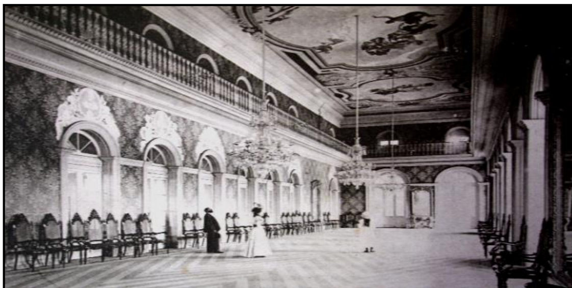
Figura 13: O Salão nobre do Teatro da Paz por Felipe Findanza.

A reforma empreendida, por Augusto Montenegro nos anos 1904-1905, consolidou a aparência atual da edificação, deixando “invisíveis” tanto a fase de sua conturbada construção de 1869 a 1874, quanto o período de sua primeira reforma entre 1887 e 1890. 637 Na fotografia a seguir, uma imagem do teatro após a primeira reforma: