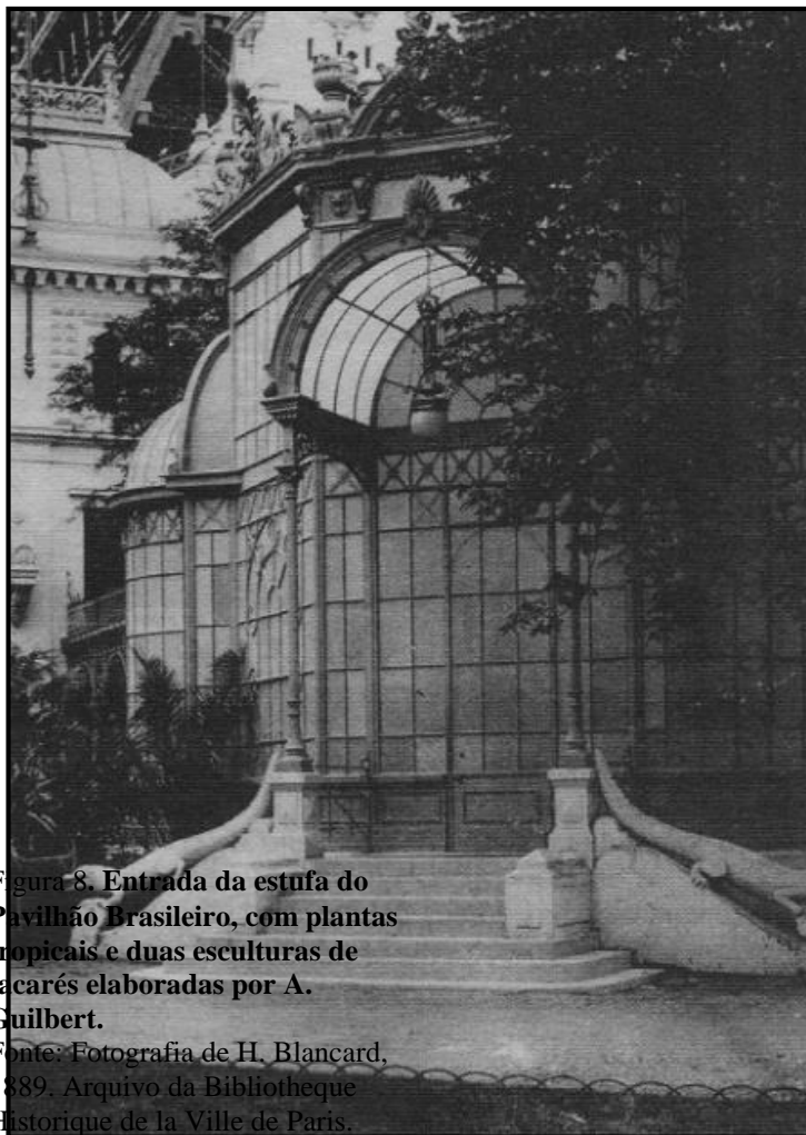
Figura 8. Entrada da estufa do Pavilhão Brasileiro, com plantas tropicais e duas esculturas de jacarés elaboradas por A. Guilbert.