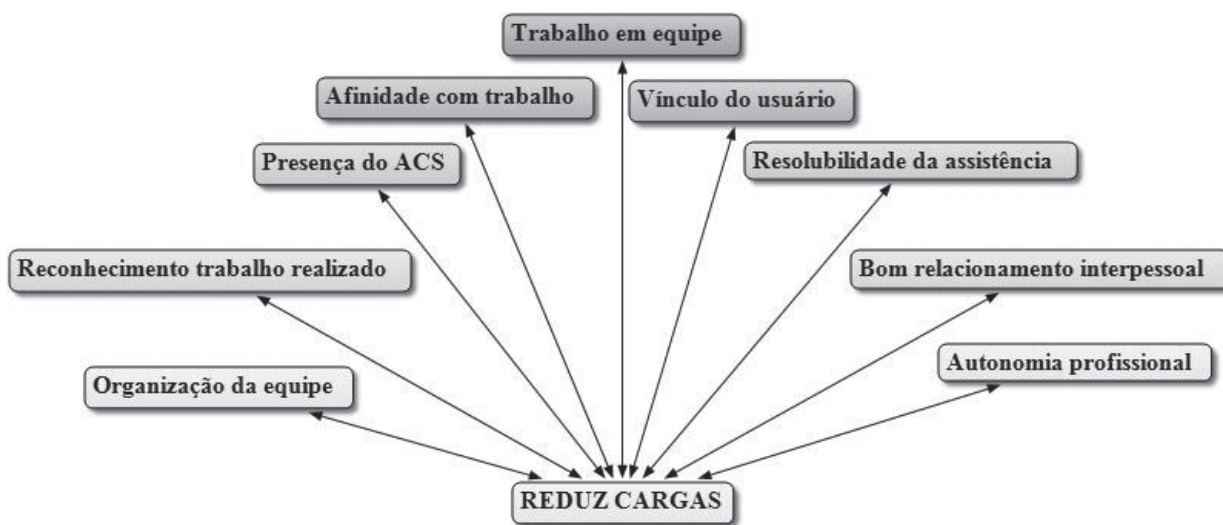
Figura 2 - Principais elementos que reduzem as cargas de trabalho dos profissionais de enfermagem

Os relatos dos profissionais mostram que o trabalho em equipe, o vínculo com o usuário, a presença dos Agentes Comunitários de Saúde (ACS) e a afinidade com o trabalho contribuem para reduzir as cargas de trabalho. Os três primeiros elementos integram o prescrito na ESF e estão associados ao code "afinidade com o trabalho", sugerindo que a identidade dos profissionais de saúde com o modelo assistencial da ESF contribui para reduzir as cargas de trabalho. Também contribuíram para redução das cargas: a organização do trabalho; o respeito à autonomia profissional no âmbito do trabalho coletivo; a obtenção de resultados satisfatórios; o reconhecimento dos usuários, colegas e gerência pelo trabalho realizado, além de boas relações de trabalho.