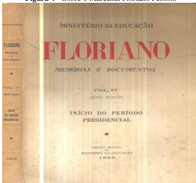
Figura 4 - Sobre o Marechal Floriano Peixoto