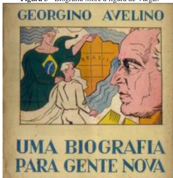
Figura 3 - Biografia sobre a figura de Vargas

Os livros A juventude no Estado Novo ( Figura 1 ) e Getúlio Vargas para crianças ( Figura 2 ) são exemplos de como o INL se portava perante a figura de Vargas e o ideal nacionalista para a educação infanto-juvenil, com conteúdo tipicamente didático e ilustrações relativas à figura paternal de Vargas com as crianças.