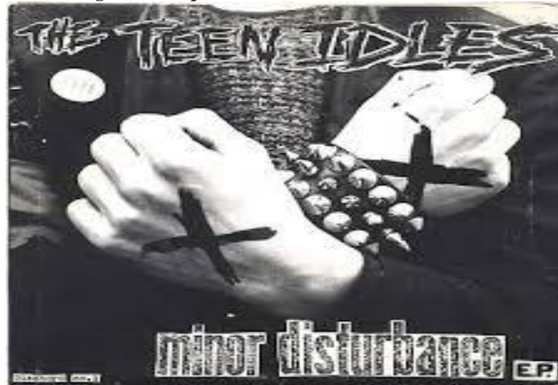
Figura 08 - capa do álbum da banda The Teen Idles