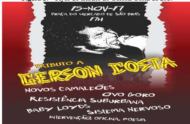
Figura 27 - Flyer do tributo ao Gerson Costa de 2017