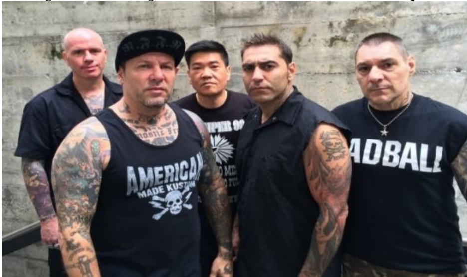
Figura 07 - Banda Agnostic Front e o visual do Hardcore Nova-Iorquino