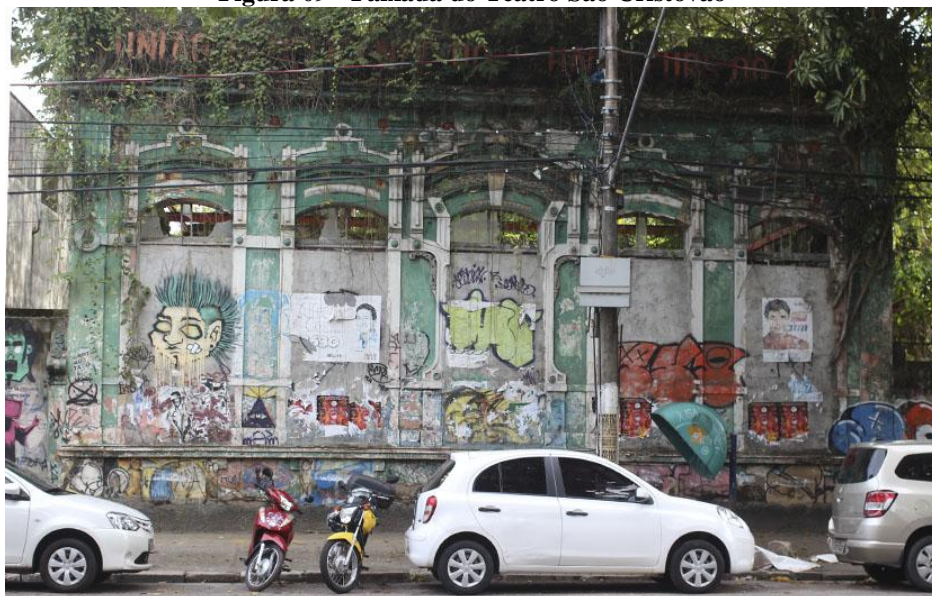
Figura 09 - Faixada do Teatro São Cristóvão