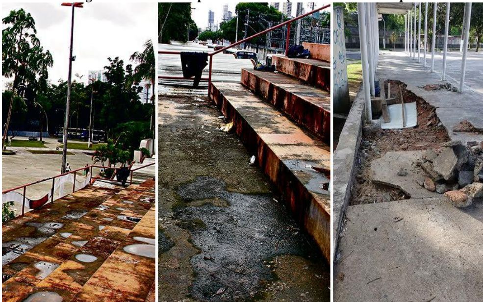
Figura 11 - Estrutura precária da Praça Waldemar Henrique