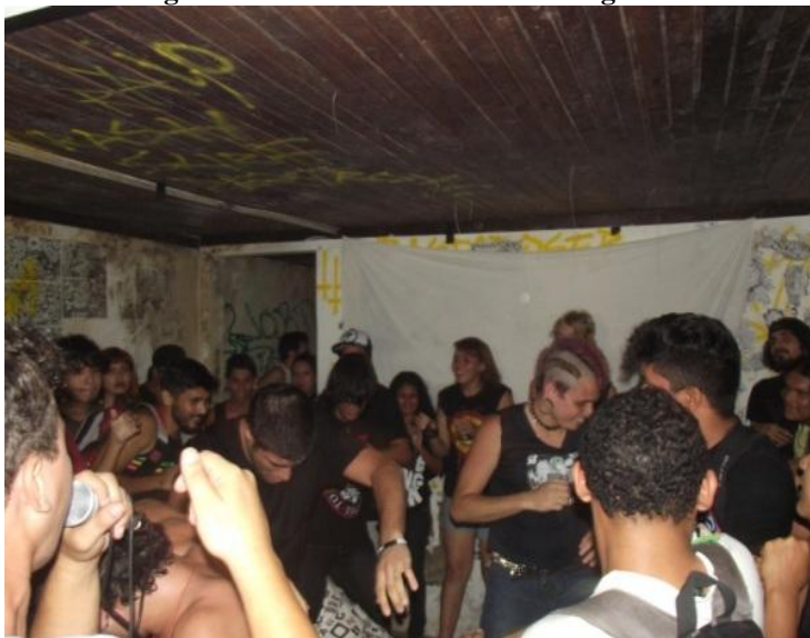
Figura 24 - Show de Hardcore na Veg Casa