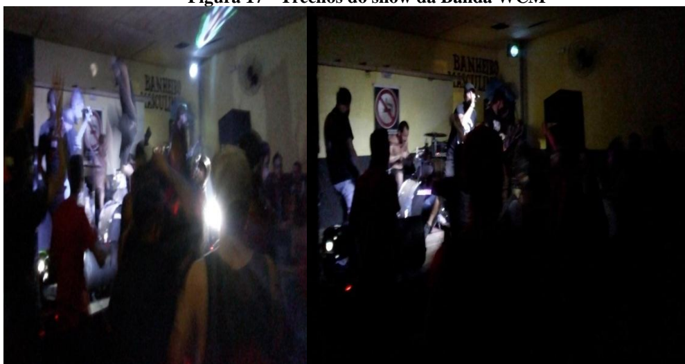
Figura 17 - Trechos do show da Banda WCM