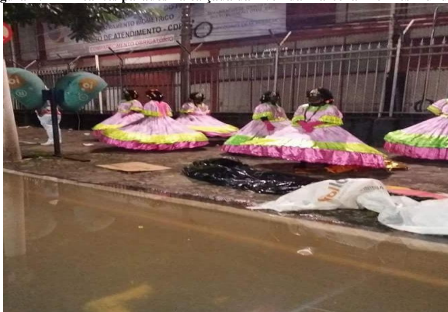
Figura 10 - Brincantes parados na calçada da Avenida Marechal Hermes inundada