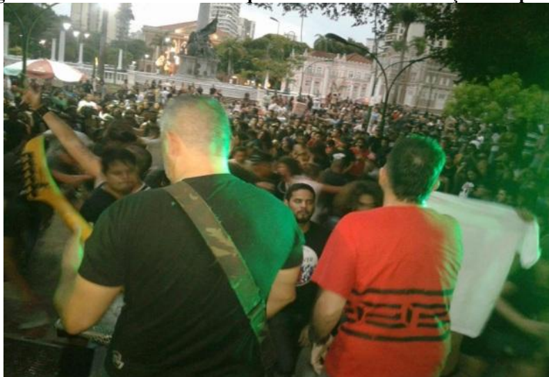
Figura 28 - Show da Banda Delinquentes no Tributo na Praça da República

Fonte: https://www.facebook.com/photo.php?fbid=1157926994256283&set=pcb.1085984668181753&type=3&theater . 2016