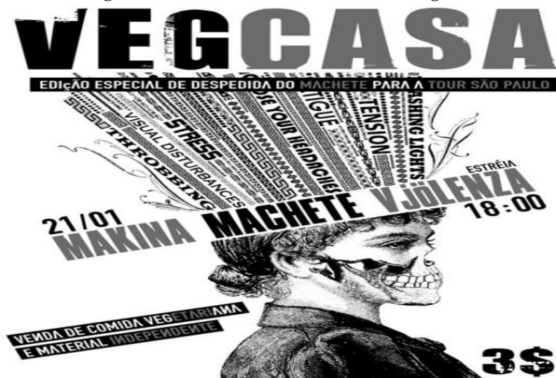
Figura 23 - Cartaz de uma das festas na Veg Casa