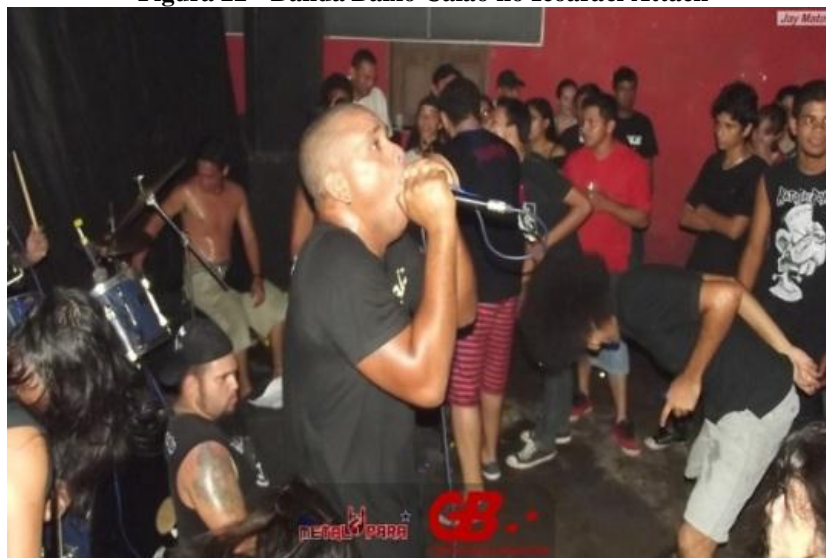
Figura 22 - Banda Baixo Calão no Icoaraci Attack