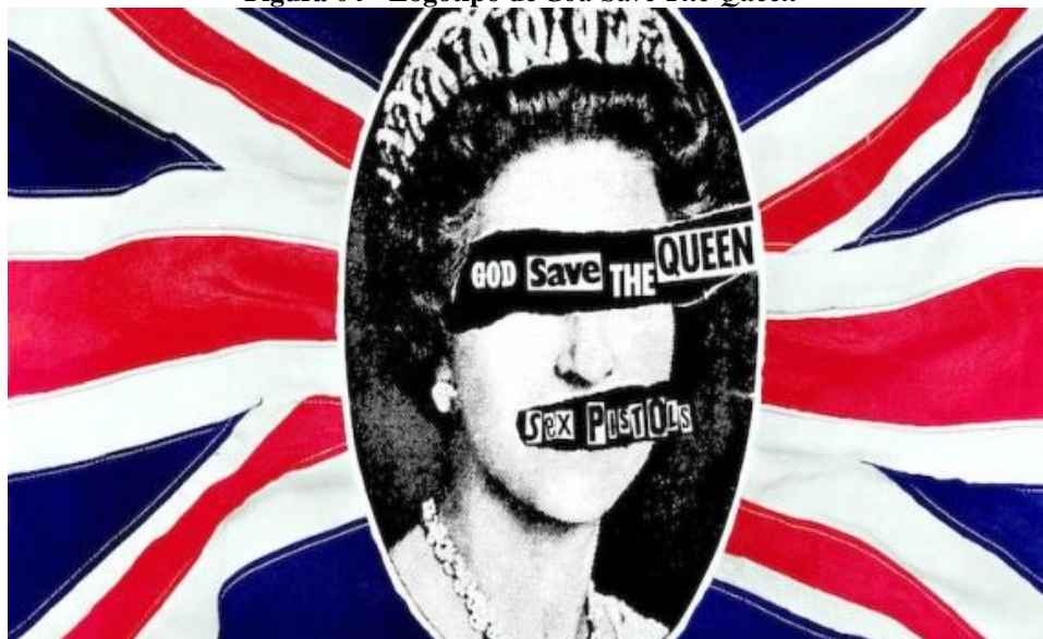
Figura 04 - Logotipo de God Save The Queen