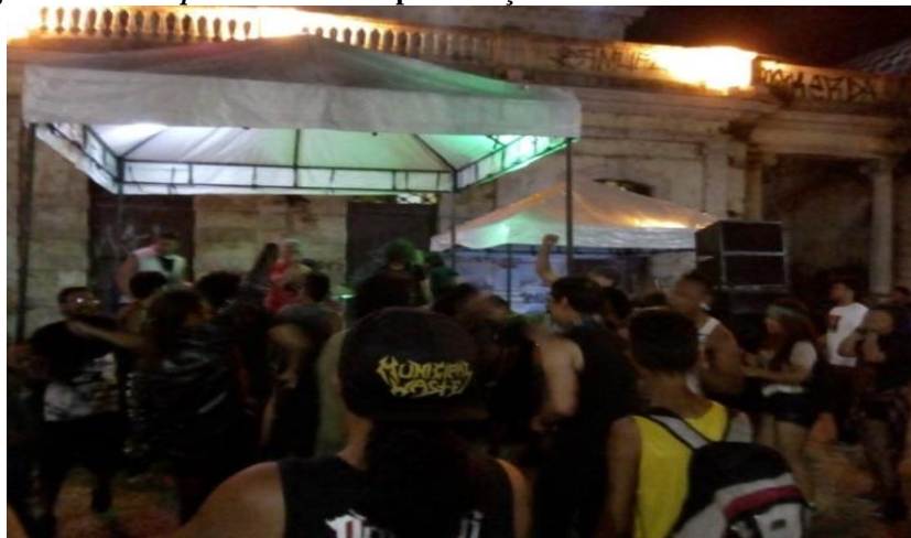
Figura 13 - Roda punk durante a apresentação da Banda Resistência Suburbana

A “Resistência Suburbana” iniciou às 20 horas e 45 minutos a sua apresentação. Tocando com muito vigor e fúria a banda fez um show contagiante e que contou com um grande circel pitt . Foi a banda com as músicas mais aceleradas da noite o que fez render uma roda bem agitada. Às 21 horas e 30 minutos termina a apresentação da “Resistência Suburbana”.