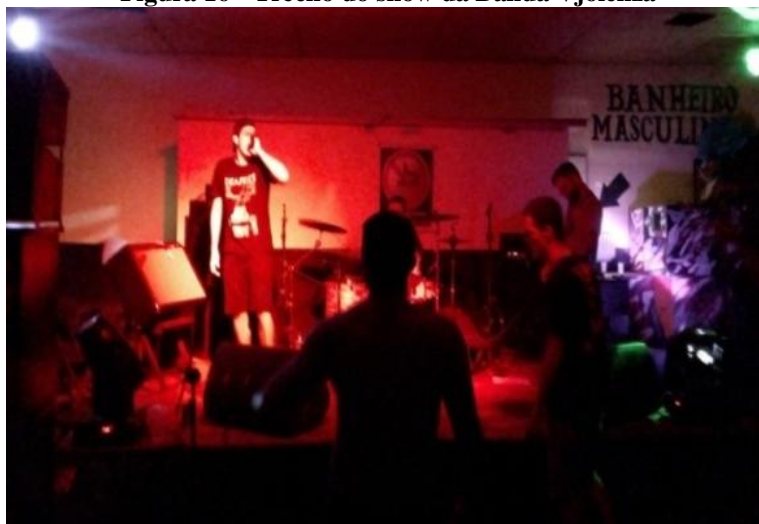
Figura 16 - Trecho do show da Banda Vjolenza

Às 23 horas e 23 minutos começou a última apresentação da banda “Vjolenza”, imagem abaixo, o show já começa enérgico com uma roda em função do clima de despedida e também da velocidade contagiante das músicas. A roda oscilava e momentos de maior intensidade e de menor, porém foi da primeira a última música como manda o figurino de um show de Punk e Hardcore . Embora com músicas curtas o show do “Vjolenza” durou bastante tempo, terminando às 23 horas e 49 minutos.