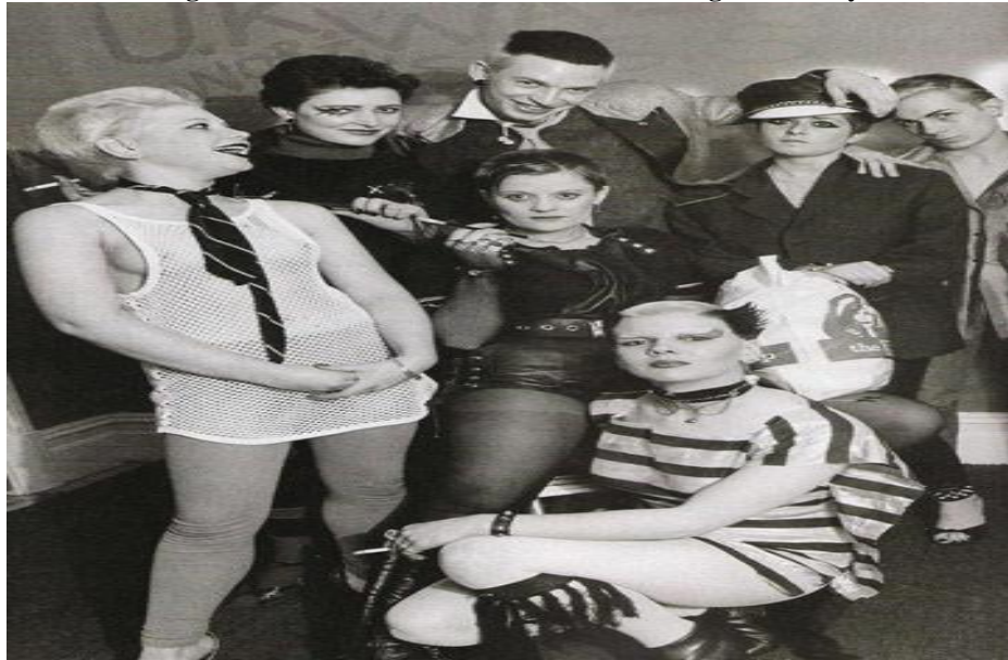
Figura 06 - Cat-Women e os Punks do Contingente Bromley