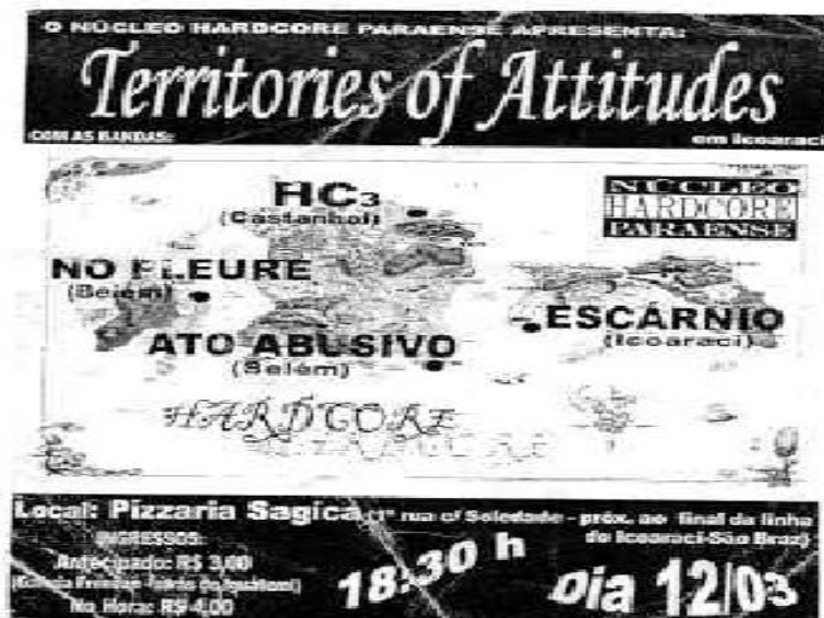
Figura 18 - Cartaz de um evento promovido pelo NHP