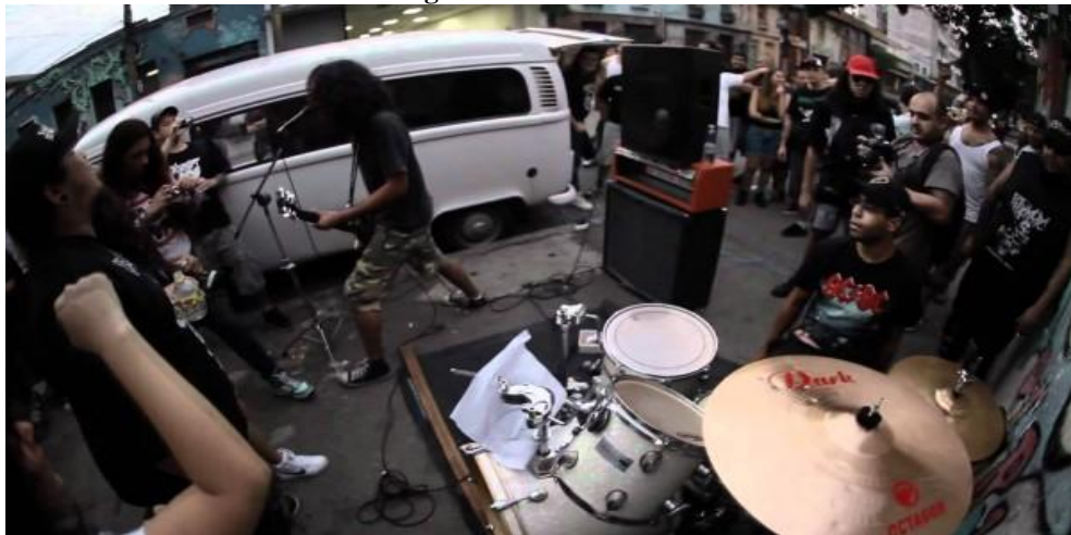
Figura 02 - Banda Test