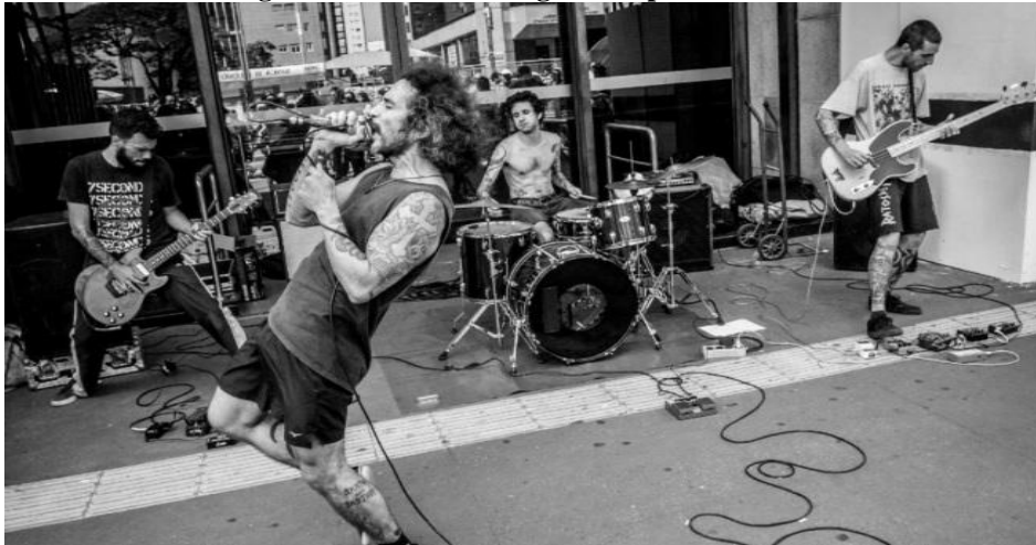
Figura 01 - Banda Insurgência Ópera Protesto