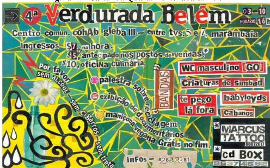
Figura 20 - Cartaz da Quarta Verdurada de Belém