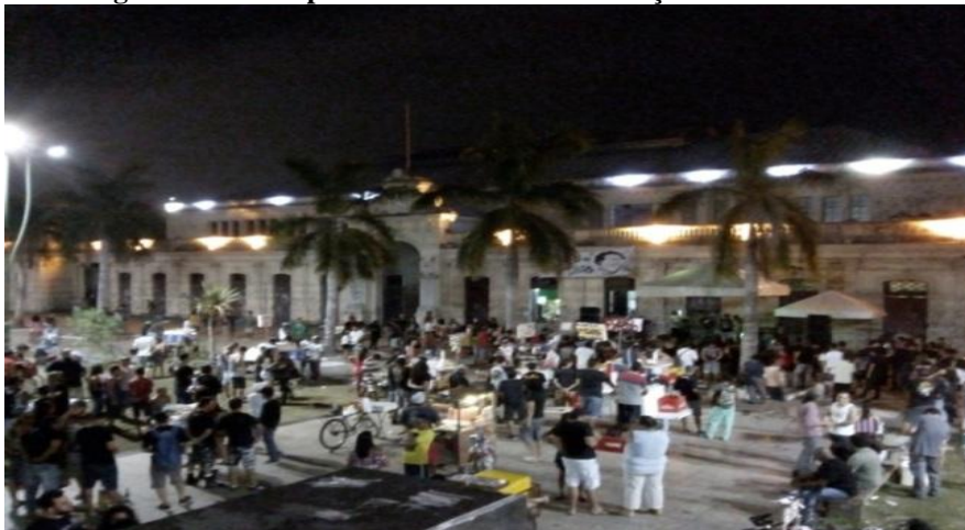
Figura 12 - Vista panorâmica da festa na Praça Floriano Peixoto

barracas devido à possibilidade de chuva a qual não ficou só na iminência de chegar, ela começou no início do evento o que fez com que houvesse um pequeno atraso.