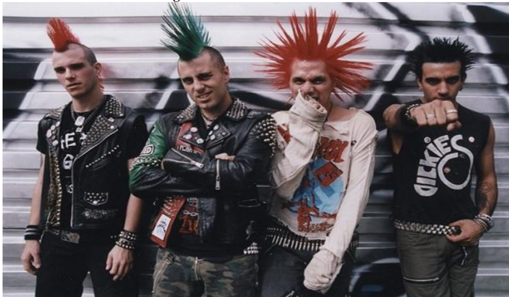
Figura 05 - Banda The Casualties