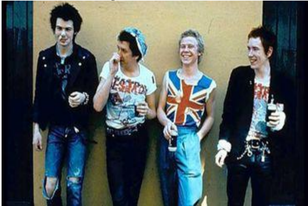
Figura 03 - Banda Sex Pistols