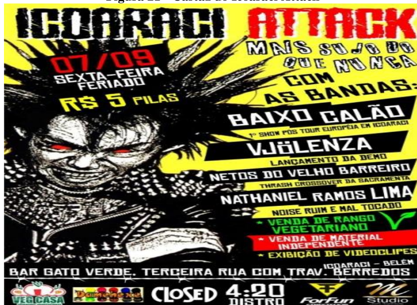
Figura 21 - Cartaz do Icoaraci Attack

bandas para além da região amazônica são “Catarro”, Mossoró (RN) e de fora do país podemos citar a “Coke Bust” de Washington (EUA) e a banda binacional Sin Hastro 109 (Brasil e EUA).