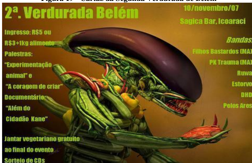
Figura 19 - Cartaz da Segunda Verdurada de Belém