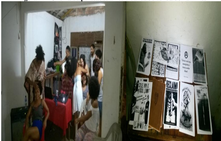
Figura 25 - Oficina de penteados afros e banca de venda de Fanzines

A figura 24 mostra o show da banda Peixe de Vala, em uma das muitas festas que ocorreram na sala principal da Veg Casa. Já nas últimas edições alguns ocorreram na segunda sala como uma maneira de dispersar menos o som e assim evitar problemas com a polícia.