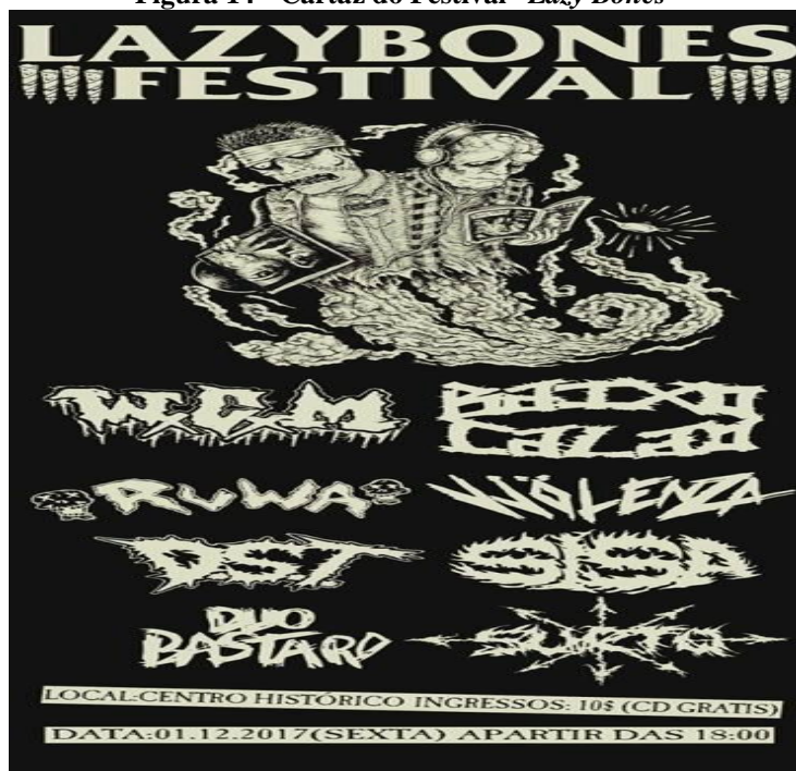
Figura 14 - Cartaz do Festival “Lazy Bones”