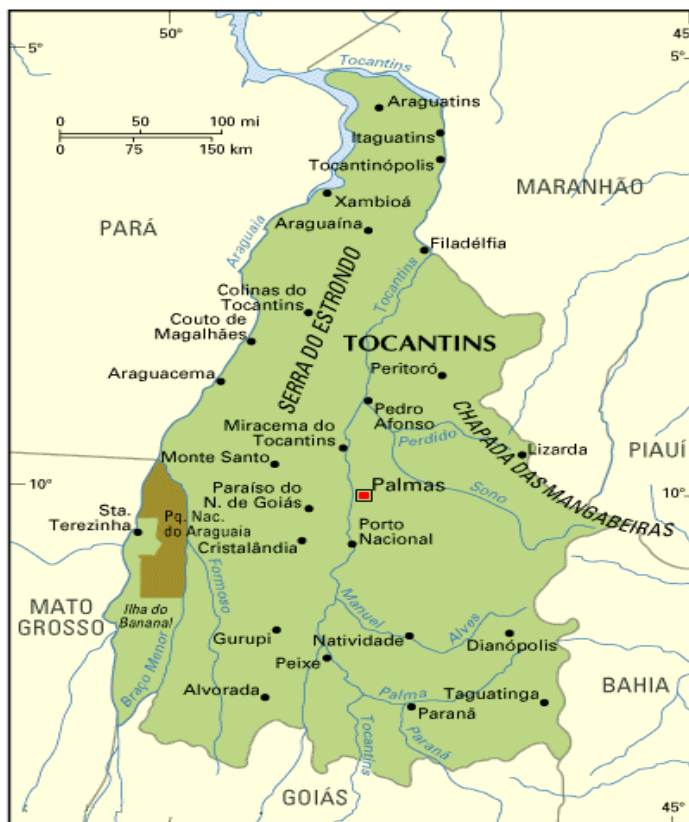
Mapa 1 – Estado do Tocantins