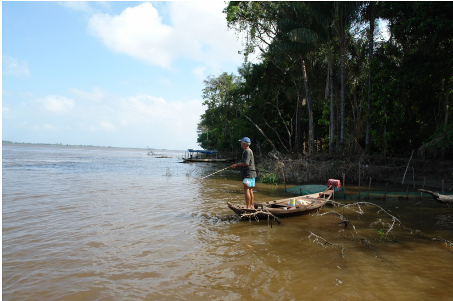
Figura 4 – Flecha utilizada na pescaria de quelônios.

A prática é realizada comumente por homens adultos, com intencionalidade da ação e obtenção dos animais para consumo entre as famílias. Este método exige conhecimento dos praticantes quanto à ecologia comportamental e ao repertório da dieta alimentar dos quelônios. Ao utilizarem a flecha os pescadores apresentam tendência de seleção dos indivíduos maiores.