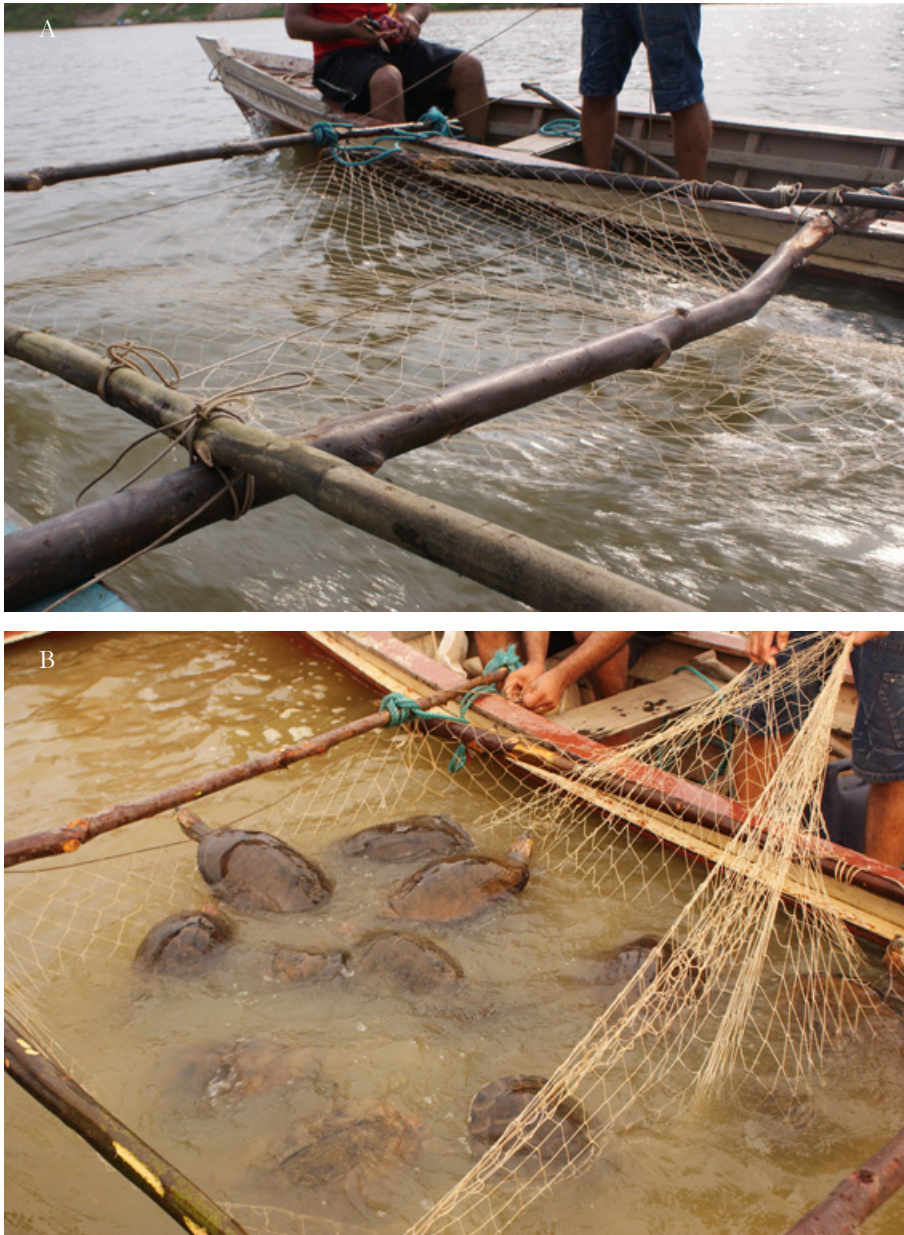
Figura 8 A e B – Técnica de puçá utilizando-se pequenas embarcações.