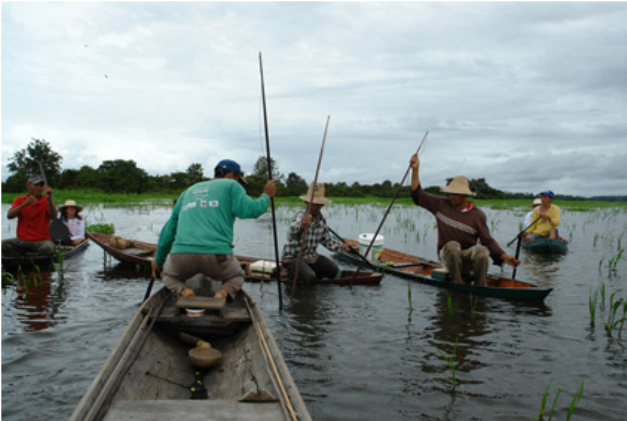
Figura 3 – Uso do arpão na captura de quelônios.

deiras) é totalmente proibido, seja para qualquer época do ano e para qualquer corpo de água existente nesta comunidade (Brasil 2004).