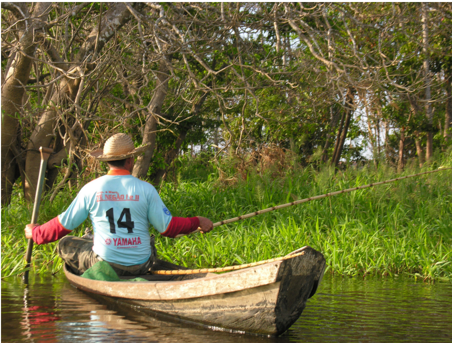
Figura 5 – Uso de caniço.

Registrou-se apenas um relato do uso da saca de malha, sendo utilizada principalmente por homens (adolescentes e adultos) de forma intencional e destinada sobretudo ao consumo. A prática envolve conhecimento sobre o comportamento e fisiologia (termorregulação) de quelônios, assim como de uso de ambientes e da variação sazonal.