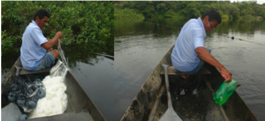
Figura 10 – Uso da malhadeira.