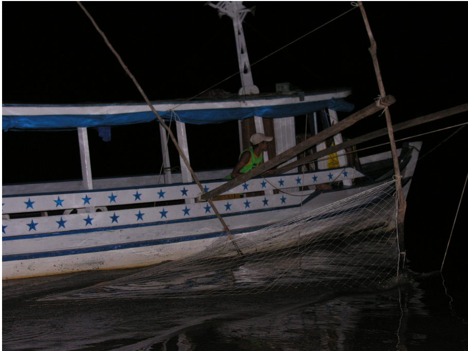
Figura 9 – Técnica de puçá utilizando-se barco de médio porte.

A malhadeira é um tipo de rede de pesca com tamanho da malha (medida dos entrenós) variável de acordo com o recurso almejado. Quando a malhadeira é elaborada para captura de pitius é chamada de pitiuzeira, sendo confeccionada com malha de cerca de 25 cm, enquanto a tartarugueira consiste no tipo de malhadeira com malha maior (40 cm) confeccionada para pesca de tartarugas. A malhadeira apresenta largo uso no período da cheia para captura de tracajá. A técnica é realizada por homens e mulheres (adolescentes e adultos) de forma intencional ou casual para consumo e comercialização. Envolve conhecimento sobre a flutuação do nível de água nos ambientes aquáticos da várzea e acerca do comportamento e migração de quelônios.