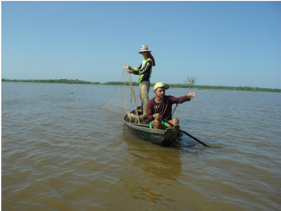
Figura 11 – Uso da bubuinha.

ambientais, sazonais e as características da espécie almejada e de seus recursos alimentares. Estes praticantes demonstraram qualidades de destreza, domínio técnico e conhecimento de distintas áreas da ciência como: biologia e ecologia de