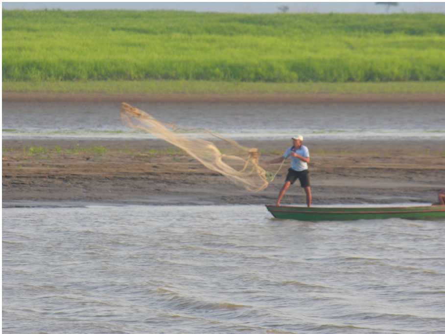
Figura 7 – Uso da tarrafa. Foto: Rafael Barboza, 2012.

“Tem malhadeira para cada bicho, pitiu é 20 cm, tracajá é 25cm e tartaruga é 40cm.”