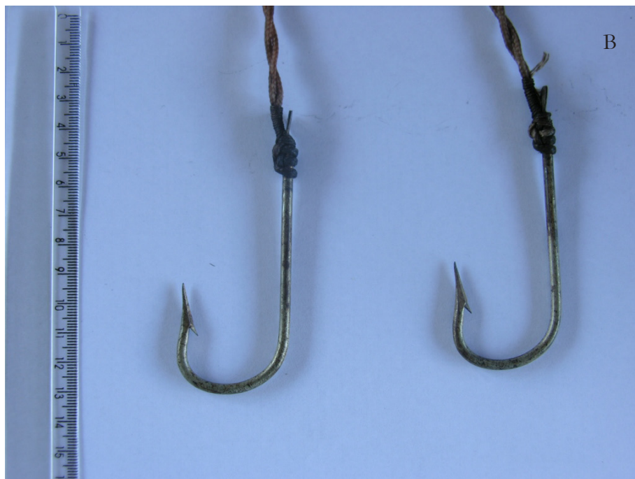
Figura 6 – A) Foto do rapazinho com detalhe abaixo para o B) anzol utilizado.