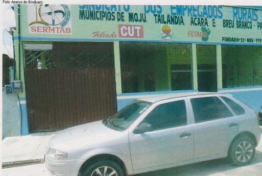
Foto do veículo adquirido para realização das atividades do sindicato