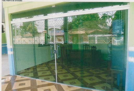
Foto Atual do Sindicato - interno