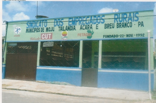
Foto atual do Prédio do Sindicato - frente