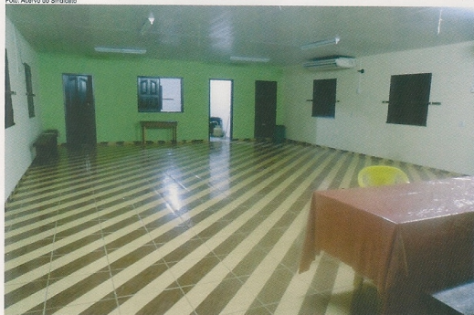
Foto atual do Auditório com estrutura climatizada