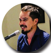
AUTOR Rodrigo Rafael Rodrigues da Silva Ferreira