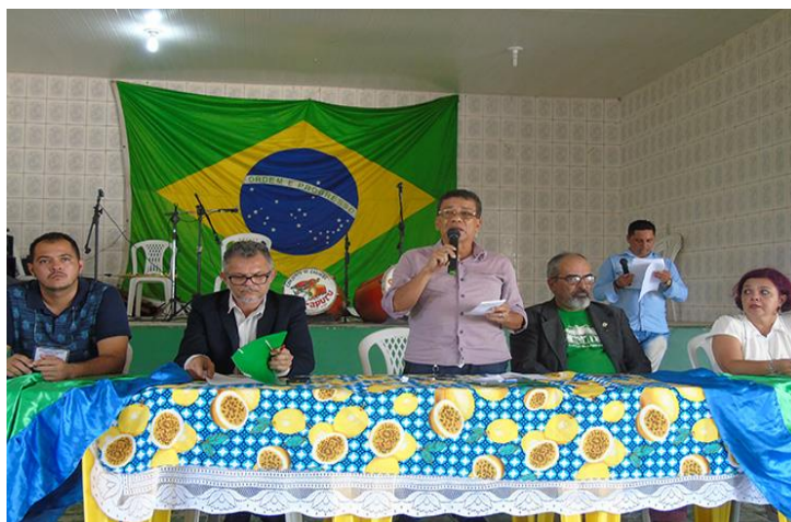
Figura 5-Encontro de Gestão das Cadeias Produtivas de Remédios Artesanais e Turismo para o Desenvolvimento Local

O seminário ocorrido em 23 de novembro de 2018 denominado “ I Encontro de Gestão das Cadeias Produtivas de Remédios Artesanais e Turismo para o Desenvolvimento Local ” que contou com a participação da comunidade, prefeito, secretários e vereadores municipais, foi um evento que marcou o iniciou de uma articulação que culminou em 2019 com a aprovação da Lei Municipal nº 1.869 de 25 de abril de 2019 que autoriza a criação do programa municipal de fitoterapia e demais práticas integrativas e complementares em saúde em Marapanim-PA.