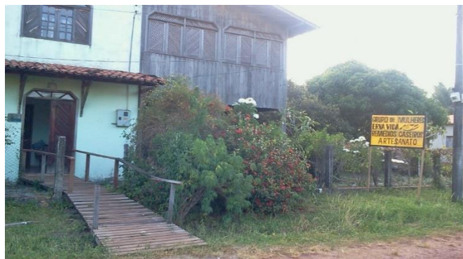
Figura 3-Laboratório do Grupo de Mulheres Erva Vida de Marapanim-PA

Percebe-se que o conhecimento sobre o uso de plantas medicinais já existente no território foi um Ativo específico que deu base para o desenvolvimento do Recurso Específico da fitoterapia, pois de acordo com Beko e pecqueur,2001 não há Recurso Específico sem Ativo específico.