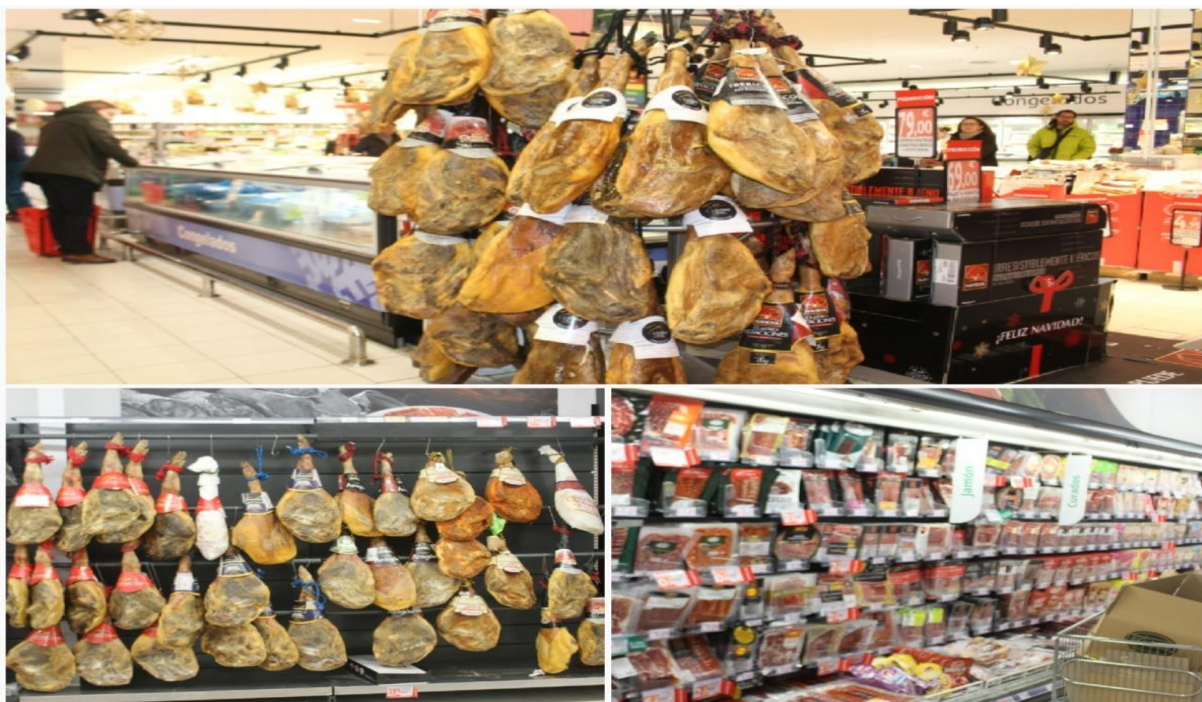
Imagens 25 a 27 - O Jamón , protagonista do comer catalão

Diferentemente da Catalunha, no Brasil, a carne de porco aparece como um alimento “marginal”. Não se apresenta com regularidade nos mercados e nas mesas, não é comida do cotidiano, ao menos no território paraense, onde o animal e tudo o que dele deriva são classificados como comida reimosa. Mas afinal o que é uma comida reimosa?