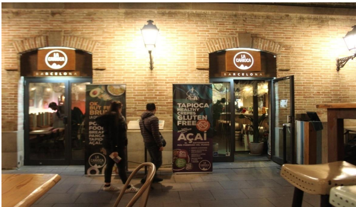
Imagem 12 - Tapioca e Açaí, cardápios principais do La Carioca