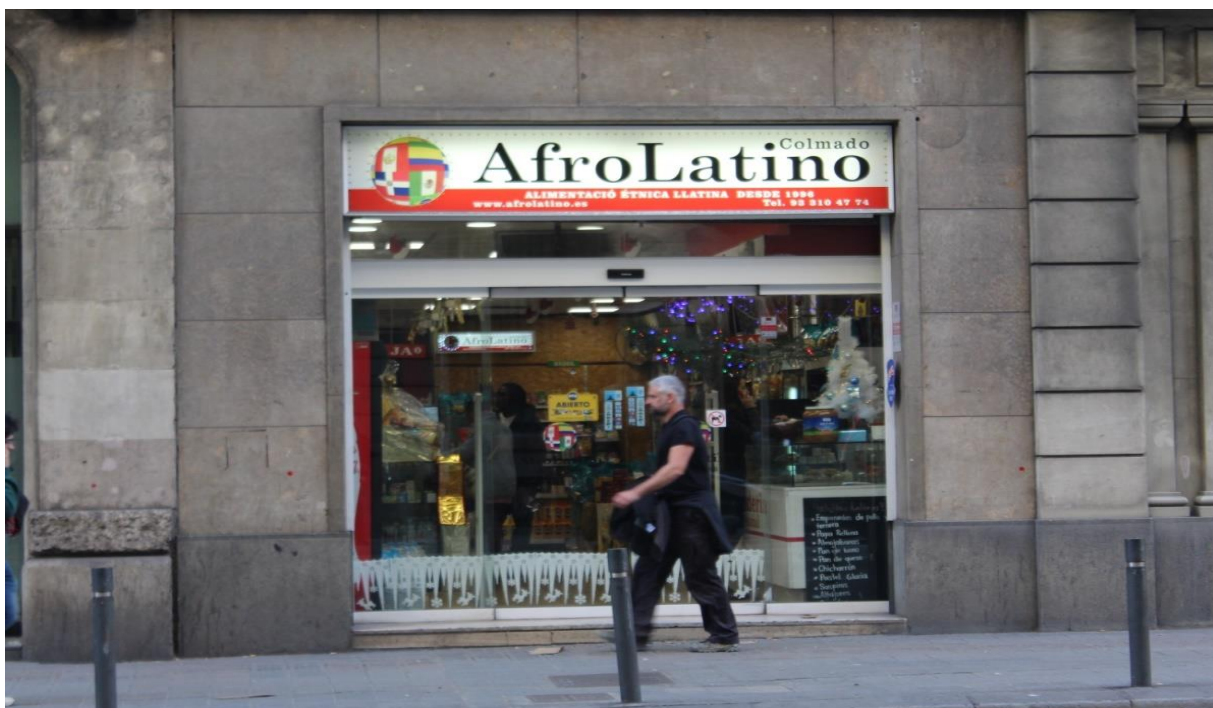
Imagem 1 - Loja Afro-latina

Nessas lojas são encontrados inúmeros produtos alimentícios de origem brasileira, tais como: arroz, feijão, café, temperos, condimentos, enlatados, embutidos, etc.