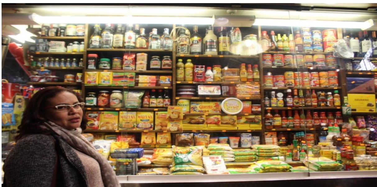
Imagem 4 - Loja latina em La Boqueria

Afora isso, ao La Boqueria é atribuída a fama de mercado cosmopolita. Nele, os visitantes, além de conhecerem, degustarem e encontrarem alimentos da cozinha nativa da Catalunha, também experimentam uma infinidade de sabores das mais variadas cozinhas do planeta, inclusive do Brasil e do Pará, pois as lojas de alimentos latinas, conforme mostra a imagem 4, ajudam no adensamento da qualidade cosmopolita atribuída ao mercado, quando elas ali comercializam uma leva significativa de alimentos de origem brasileira, ou não. Estes, em alguns lugares do Brasil, como no estado do Pará, são, segundo Picanço (2018), apontados como patrimônio alimentar do lugar, tais como a pupunha, o cupuaçu, a farinha de mandioca e a goma para tapioca.