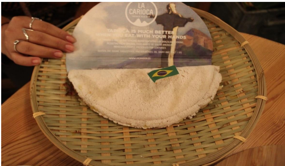
Imagem 13 - Tapioca gourmetizada no La Carioca