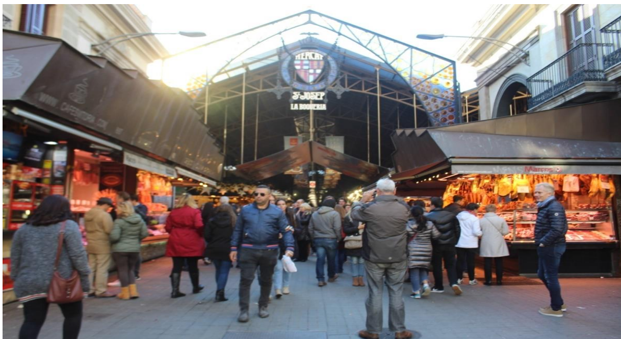
Imagem 3 - La Boqueria