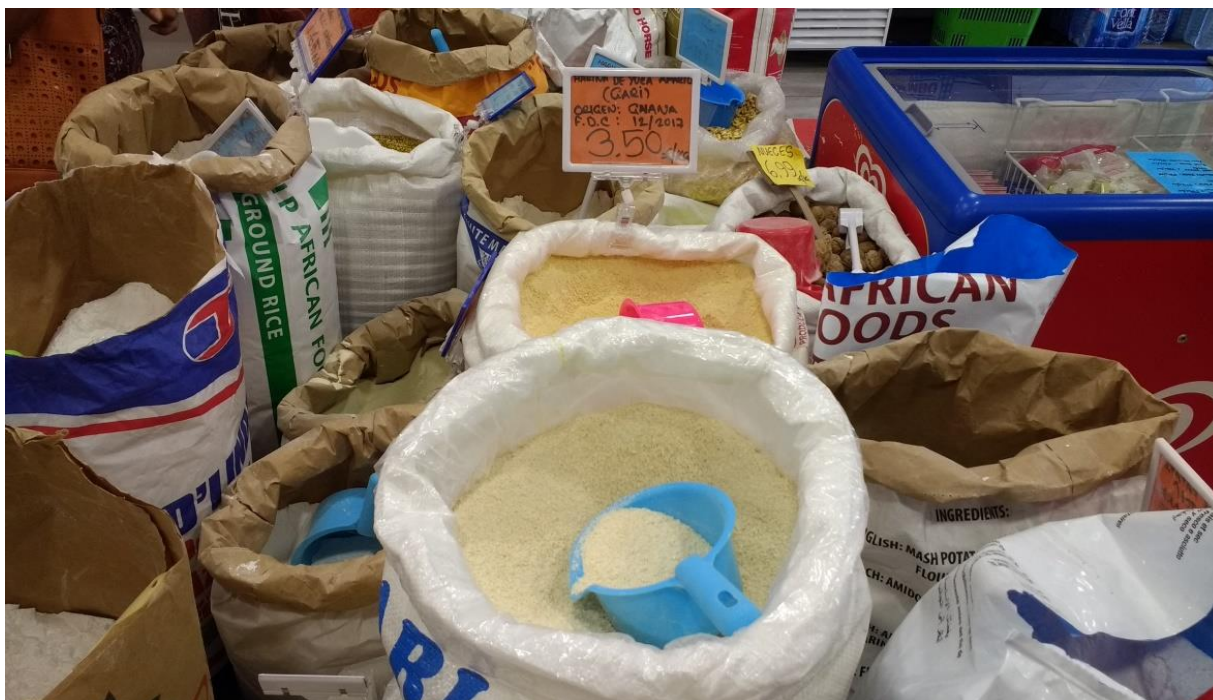
Imagem 2 - Farinha a granel