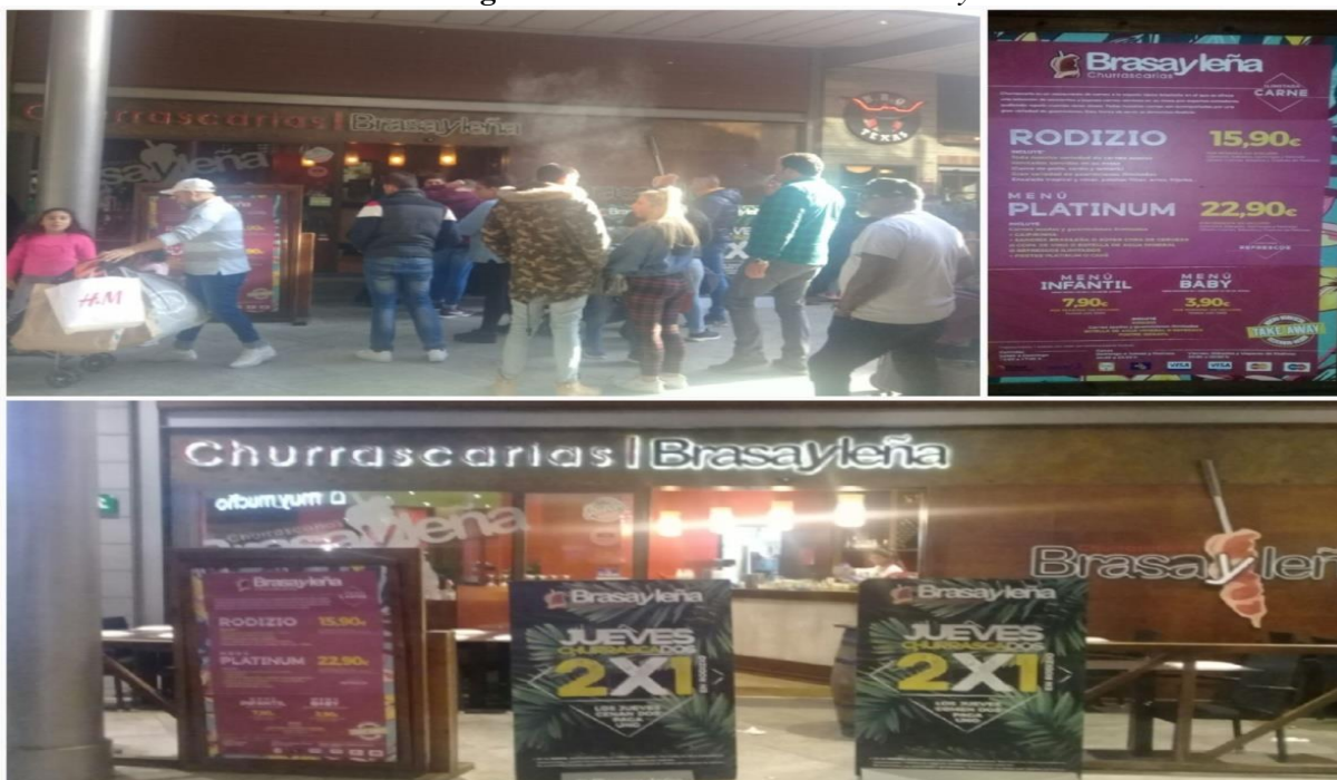
Imagens 8 a 10 - Na Churrascaria Brasayleña