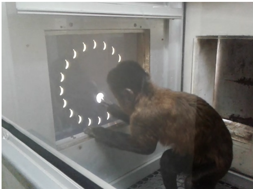
Figura 3. Câmara experimental com um dos sujeitos arrastando o círculo branco na tela sensível ao toque.