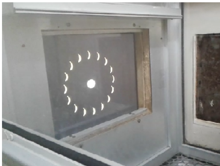
Figura 2. Detalhe da câmara experimental mostrando a tela sensível ao toque com os estímulos do software “Arrasta” no segundo estágio, de 4 cm de raio do círculo circundante.

responsável por sua atual versão, apresentava os seguintes estímulos: um círculo, considerado como o cursor, na cor branca medindo cerca de 3 cm de diâmetro no centro da tela e várias pequenas figuras no formato de bananas na cor amarela ao redor do estímulo branco central, formando outro círculo. Foram usados quatro raios do círculo circundante, 2, 4, 6 e 9 cm aproximadamente foram as distâncias que separaram o estímulo central a ser arrastado da cerca ao redor dele, formada pelas figuras de banana; cada distância correspondia a um estágio diferente do programa (Figura 2).