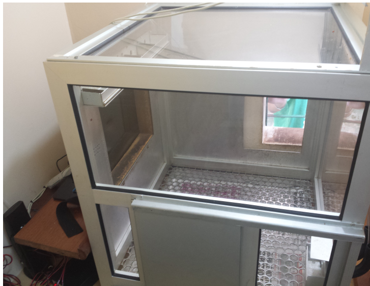
Figura 1. Câmara experimental (gaiola de testes) com a tela sensível ao toque acoplada.

As sessões para a coleta de dados foram realizadas em uma câmara experimental, medindo 0,60m x 0,60m x 0,60m. Um monitor de 17 polegadas com tela sensível ao toque ficava acoplado à câmara experimental. No canto superior direito da parede oposta ao monitor de vídeo, fica uma lâmpada fluorescente de 15 watts e na parede lateral esquerda, havia uma porta de 0,35m x 0,20m, utilizada como entrada e saída do sujeito da câmara experimental. Um receptáculo para as pelotas liberadas por um dispensador de pelotas ficava no canto inferior da parede oposta à que continha o monitor de tela sensível (Figura 1).