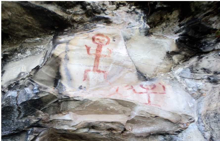
Figura 2 - Pinturas representadas em humanos – Sítio Serra da Lua