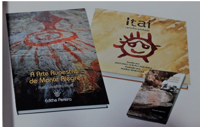
Figura 10 - Livros ilustrados e vídeo-documentário