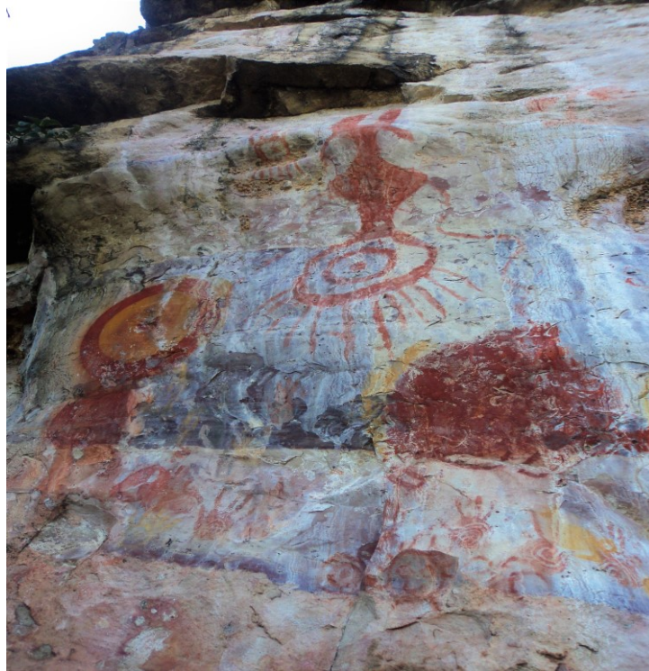
Figura 5 - Pinturas representadas em círculos, seres humanos (rostos, mãos) - Sítio Serra da Lua