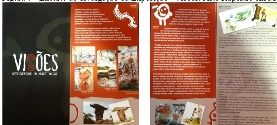
Figura 7 - Encarte de divulgação da Exposição “Visões: Arte Rupestre em Monte Alegre”

Devido à carência de informações sobre o patrimônio arqueológico da região, foi priorizado iniciar as ações do projeto “Arte Rupestre de Monte Alegre: difusão e memória do patrimônio arqueológico” no próprio município. Assim, eventos como a abertura da exposição “Visões: arte rupestre em Monte Alegre”, lançamento dos livros “Itaí: a carinha pintada” e “A arte rupestre de Monte Alegre, Pará, Amazônia, Brasil”, lançamento do vídeo-documentário “Imagens de Gurupatuba” e a distribuição do material para as escolas e bibliotecas tiveram como objetivo proporcionar aos moradores de Monte Alegre e de outros locais do Baixo Amazonas o acesso direto às informações produzidas pelas pesquisas.