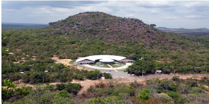
Figura 8 - Complexo de Musealização dos Sítios Arqueológicos do PEMA