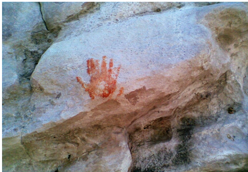
Figura 6 - Pintura representada em mão

Existe um grande número de figuras humanas e representações de mãos, cujos temas são os mais comuns entre as pinturas de Monte Alegre.