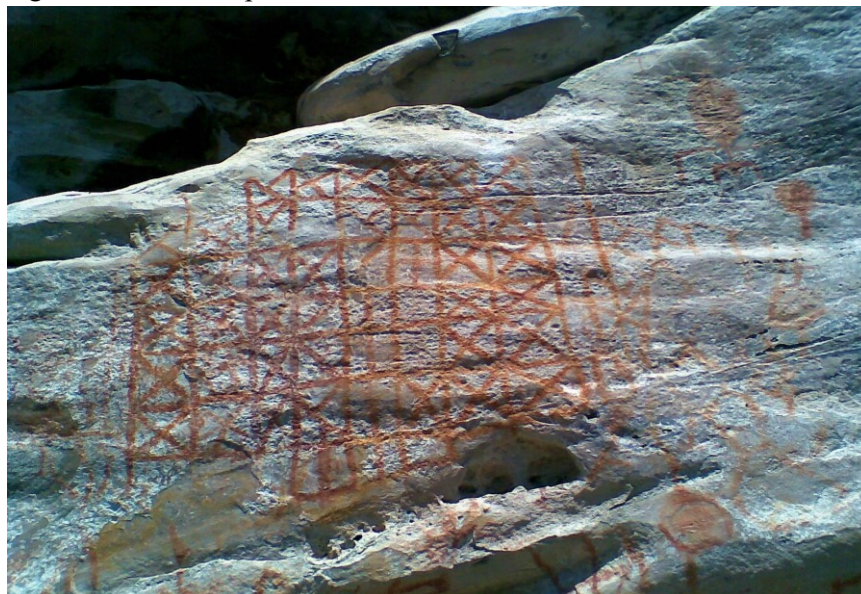
Figura 4 - Grafismo puro - Sítio Painel do Pilão