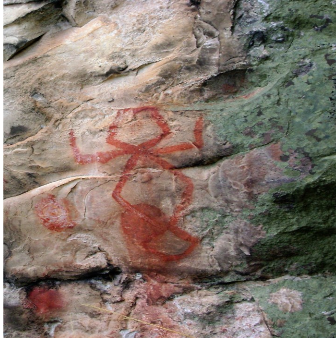
Figura 3 - Desenho representado em um provável animal