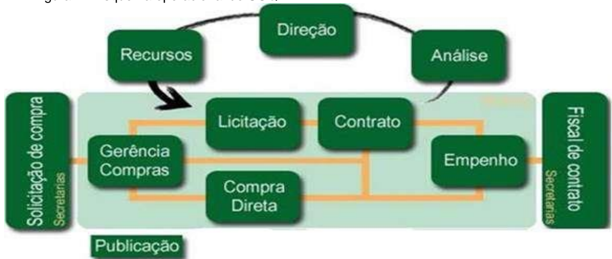
Figura 1 - Esquema operacional do SGQ.

necessidades de funcionamento da administração pública, como bem se pode constatar na ilustração da figura 1.