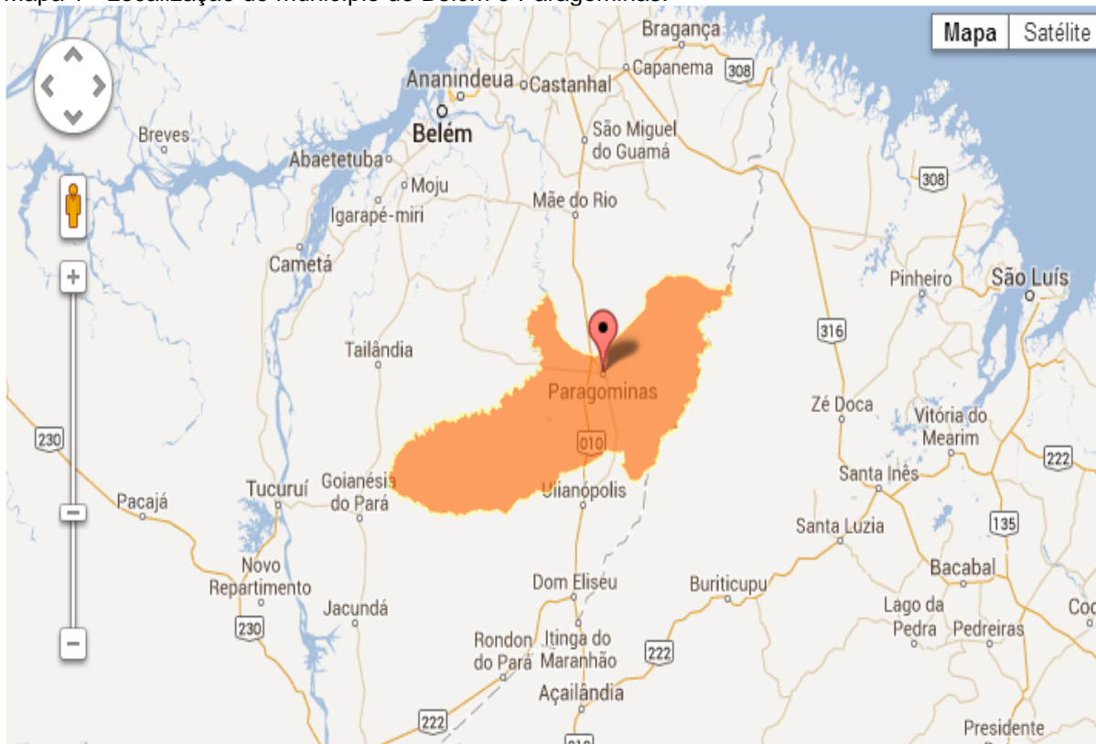
Mapa 1 - Localização do município de Belém e Paragominas.

A pesquisa foi realizada no município de Belém e Paragominas (conforme a ilustração do mapa 1, que mostra as respectivas localizações), como estratégia para as Micro e Pequenas Empresas estimular e induzir o desenvolvimento local, com a intenção de abertura de postos de trabalho, maior alocação de renda e de receitas.