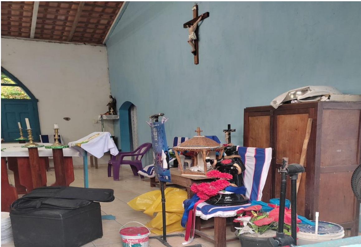
IMAGEM 9 – Visão lateral do altar da igreja e Imagem de São José.

Fonte: Acervo de Pesquisa de Campo, imagem feita pela autora, 2021.