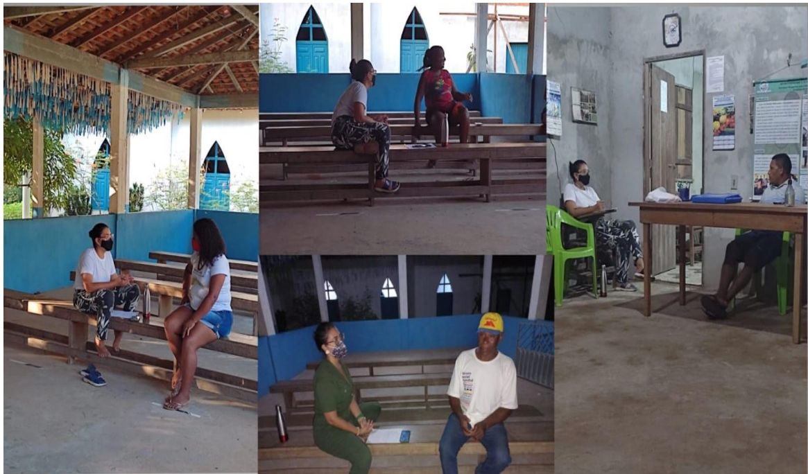
IMAGEM 3 – Registros das Entrevistas