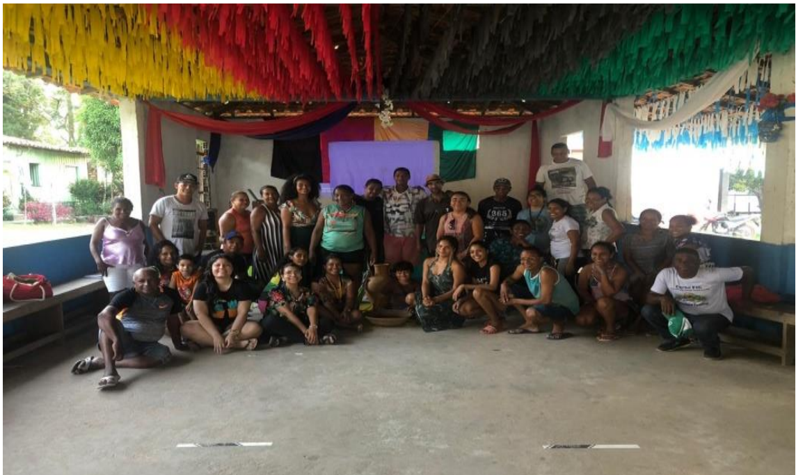
IMAGEM 15 - Participantes ao final da roda de conversa