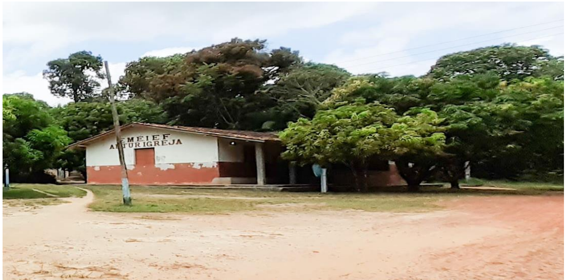
IMAGEM 4 - Escola Municipal de Ensino Infantil e Fundamental Artur Igreja