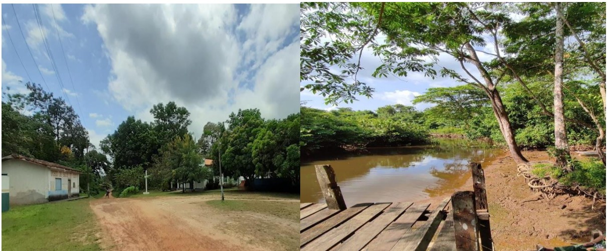
IMAGEM 2 – Imagens de espaços da Comunidade

Do pouco tempo que acompanhei, pude aprender um pouco sobre o fluxo do rio, que geralmente seca entre 10h da manhã e começa a encher às 17h, sendo este o melhor horário pra tomar banho. O terreno fica tomado por lama nos períodos da vazante, o que atrai algumas espécies de animais, como arraias.