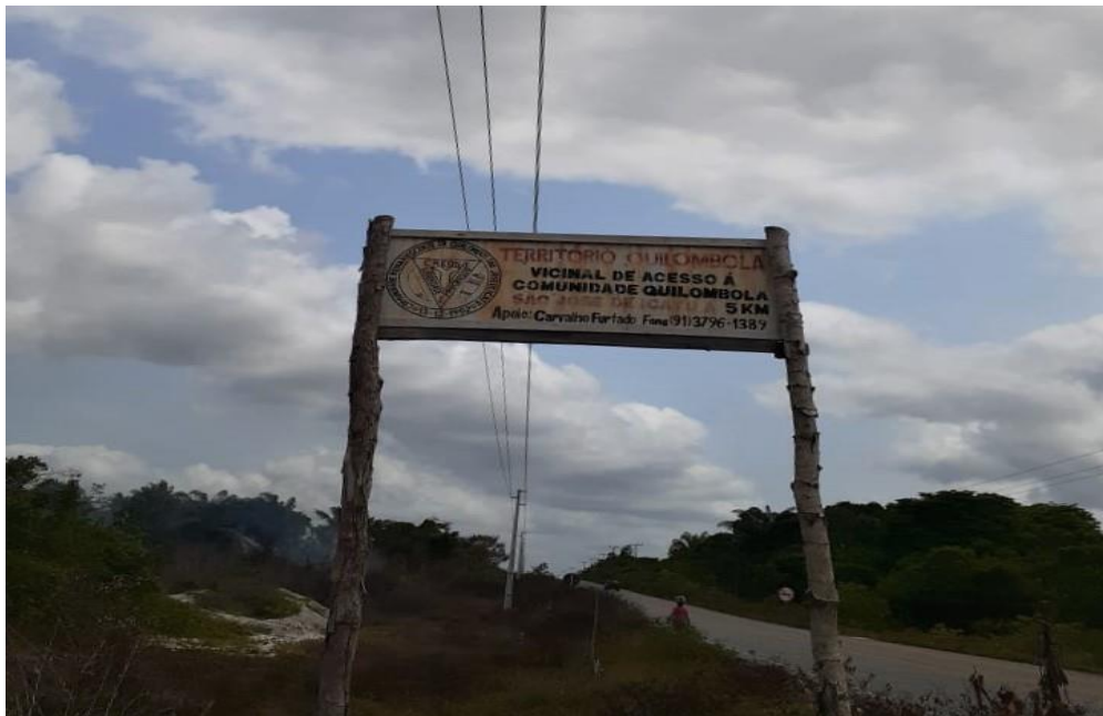
IMAGEM 1 – Placa localizada na entrada do Ramal que dá acesso à comunidade São José do Icatu