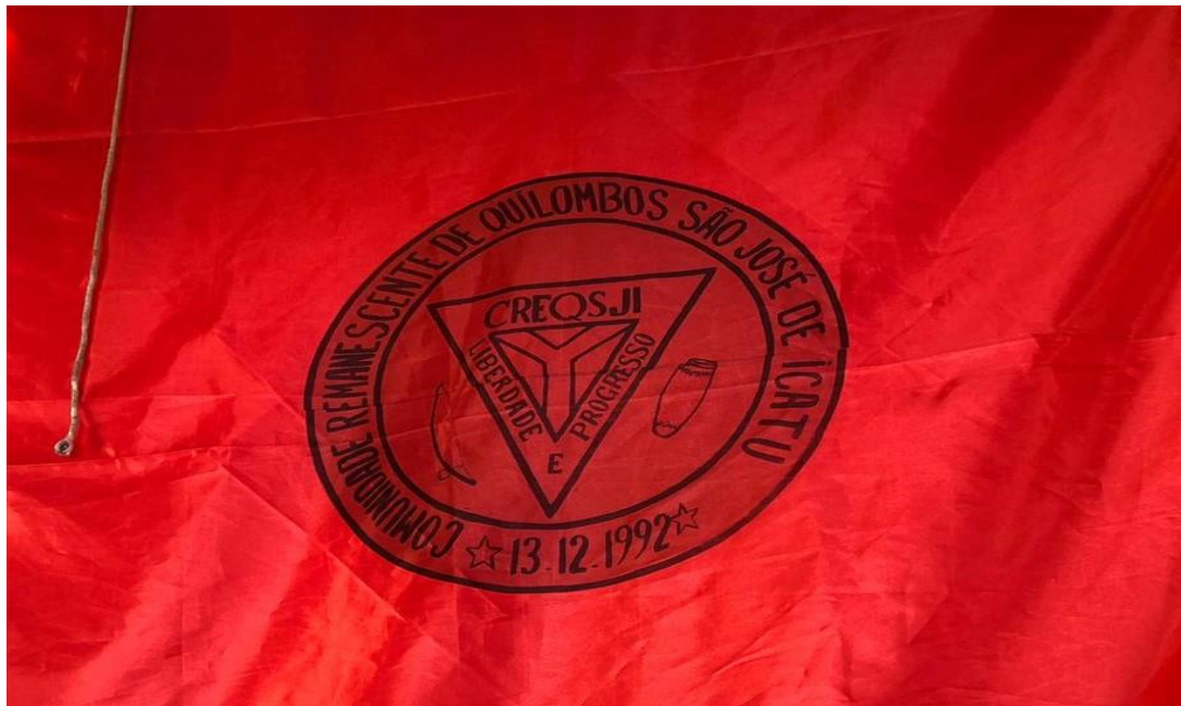
IMAGEM 7 – Bandeira da Associação CREQSJI