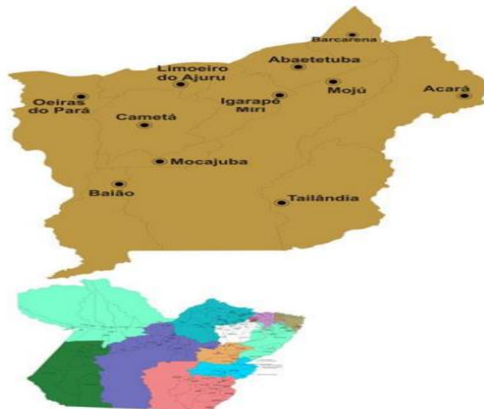
MAPA 1 – Mapa da Região do Baixo Tocantins e seus Municípios

A ocupação de terras na região baseou-se, primeiramente, no cultivo do cacau e, posteriormente, na cana-de-açúcar. Essa conjugação de elementos sistêmicos favoreceu a concentração de terras e de populações negras, que participaram ativamente na economia regional, trabalhando nos engenhos de açúcar, nos cacauais, nas fazendas de gado, em plantações de tabaco, algodão e arroz, principalmente em Cametá, Acará, Oeiras do Pará e Moju (BASTOS et al. 2010).