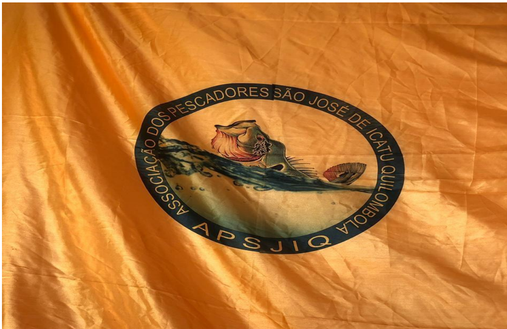
IMAGEM 8 – Bandeira da Associação APSJIQ