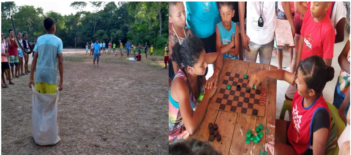
IMAGEM 13 – Imagens de algumas das modalidades disputadas durante os Jogos Quilombolas de 2018.

Alguns dos esportes praticados são: vôlei, futebol, jogo de dama, dominó, cabo de guerra, corrida, salto a distância, corrida de saco e outros. Além de ser um momento de descontração e lazer, os jogos também tem somado no fortalecimento das relações entre as comunidades quilombolas da região, que vão para além dos jogos se estendendo também nas demandas sociais e de direitos.