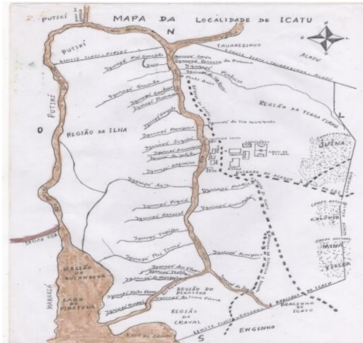
MAPA 4 – Mapa Social da Comunidade de São José de Icatu

como pertencente ao quilombo, incluindo as áreas de ilhas que foram excluídas do título de terras e que nos últimos anos tem sido alvo constante de processos de invasão.