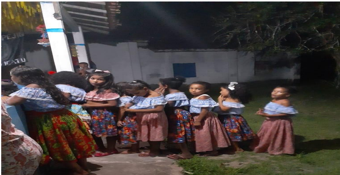
IMAGEM 11 – Crianças da comunidade antes de se apresentar durante show da banda Cultura Viva.