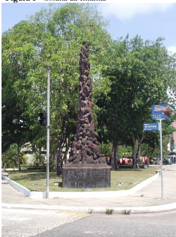
Figura 1 - Coluna da Infâmia