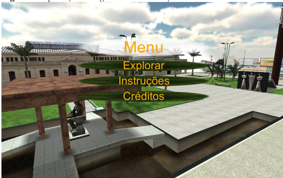
Figura 4 - Reprodução de fragmento da virtualização do monumento a Lauro Sodré