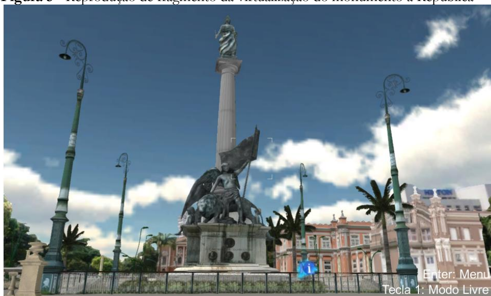
Figura 5 - Reprodução de fragmento da virtualização do monumento à República