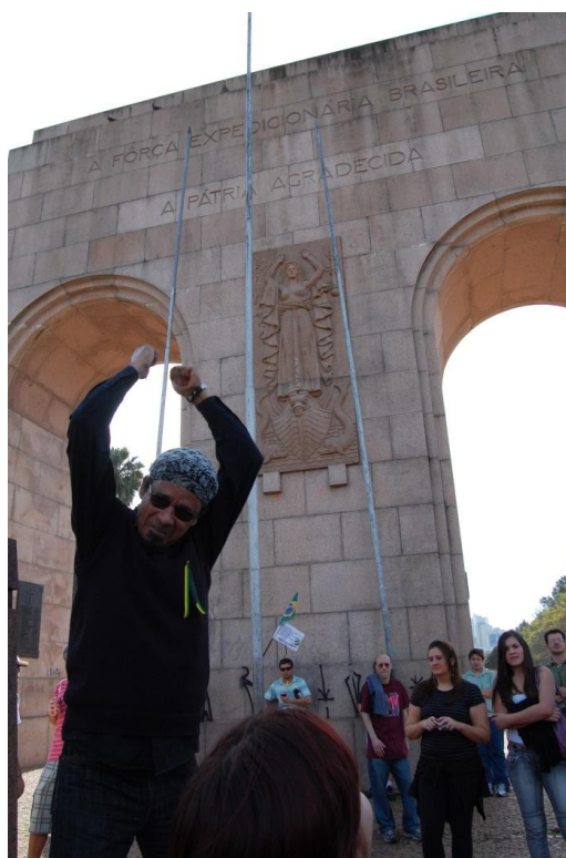
Figura 2 -Manifestante ressignifica Arcos da Redenção