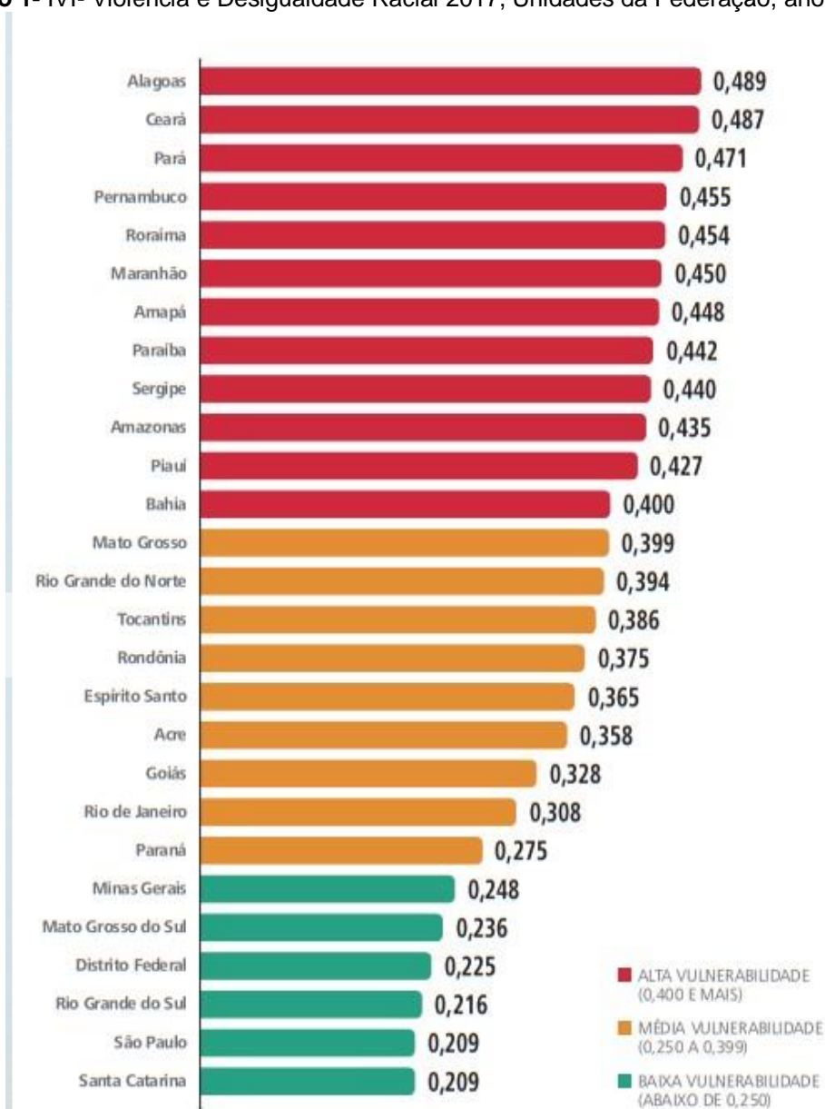
Gráfico 1- IVI- Violência e Desigualdade Racial 2017, Unidades da Federação, ano base 2015