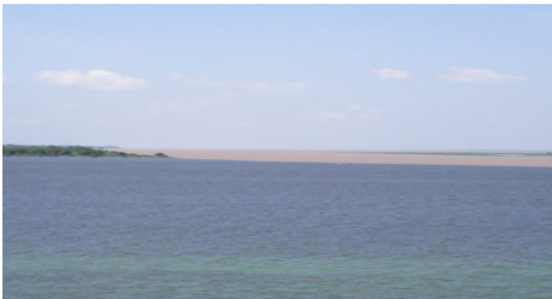
Foto 09 – Visão Panorâmica do Encontro das Águas (Vista aérea) – Paulo Carvalho

O Exame Nacional de Cursos - ENC ganhou status de avaliação e política, repercutiu contraditoriamente no meio acadêmico, gerou celeumas e provocou alegrias e insatisfações. Produziu um bom saldo de resultados positivos e negativos, ainda que tenha deixado muito a desejar em relação ao que se concebe e deseja por avaliação, mas cumpriu a finalidade a que se propunha desde o início, ser uma tecnologia de informações ou um indicador dessas informações ao Estado, a respeito da educação superior brasileira, garantindo ao país dados validados (Banco de Dados) para prestar contas aos financiadores de sua educação.