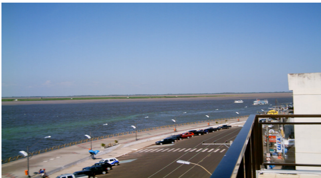
Foto 04 – O Encontro das Águas visto da Orla de Santarém (vista aérea) - Paulo Carvalho

Nesse capítulo, o objetivo é descrever e interpretar os resultados da análise dos relatos orais de egressos e professores do Curso de Pedagogia do Campus da UFPA, em Santarém. Os resultados se apresentaram contraditórios e apaixonantes. Este fato e a última conversa com o orientador me instigaram a estabelecer uma analogia entre estes e um fenômeno natural característico na minha terra – O Encontro das Águas - que eu vejo todos os dias em minha cidade. Fenômeno que parece estar ao “alcance das mãos” quando visto da orla da cidade (foto 04), compondo o cenário cotidiano da vida, tanto do santareno nativo como do visitante, pois ambos têm no rio sua rua, seu principal ponto de passagem, de idas, vindas e chegadas.