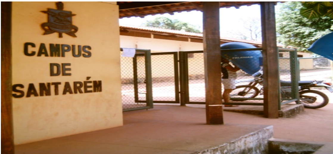
Foto 07 – Vista do Campus Universitário da UFPA de Santarém – Paulo Carvalho

O Curso foi ofertado pela primeira vez em caráter regular, no município, em 1983, com Licenciatura Plena em Administração Escolar. A idéia inicial era tornar a oferta de vagas regular e permanente, o que naquele momento não aconteceu.