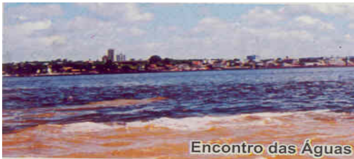
Foto 05 – O Turbilhão das Águas dos Rios Tapajós e Amazonas (vista do rio) – Recorte

Dependendo do horário que se observa, é possível perceber com que fúria os rios se chocam para, em seguida, se tornarem serenos (Foto 08). Além de nos ensinar que é possível viver e conviver na diferença, também ensinam que é possível viver na diferença e, ao mesmo tempo, buscar e manter o equilíbrio e a serenidade em função de uma razão maior, no caso dos rios a vida e a natureza, no caso do curso a formação.