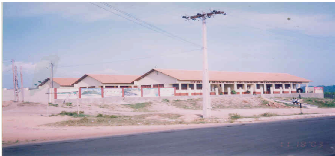
Foto 08 - Escola Municipal Irmã Firmina – Núcleo de Óbidos – Carlos Vieira

Do ano de 1999, ao segundo semestre de 2005 (período que foi possível obter informações mais completas), segundo consta nos Relatórios do Departamento de Registro e Controle Acadêmico – DERCA, foram cadastrados quatrocentos e vinte (420) alunos no Curso de Pedagogia/Santarém. Desses, trezentos (300) foram regularmente matriculados e cento e vinte (120) deixaram de renovar suas matrículas. Nesse período, o curso estava vinculado ao Centro de Educação – UFPA/Belém, o número de concluintes foi de duzentos e setenta (270) alunos, foram defendidos cento e trinta e sete (137) Trabalhos de Conclusão de Curso - TCCs, envolvendo as diferentes dimensões do conhecimento sobre educação como se observa no quadro.