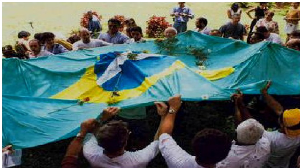
Foto 03 – Registro da Abertura Política no Brasil

Neste capítulo, amplio minhas reflexões acerca da consolidação da avaliação no Brasil, pertinente ao processo de sua institucionalização como uma Política Pública Educacional, que no âmbito da educação superior fez com que o ENC se convertesse na sua expressão máxima, uma tecnologia adotada para materializá-la nesse nível de ensino, processo questionável e paradoxal, uma vez que o Exame Nacional de Cursos, tornou-se a principal referência da ação avaliativa conduzida pelo Estado, a base corpórea da política, o que fez com que o mesmo passasse a ser confundido ou entendido como sinônimo da própria política.