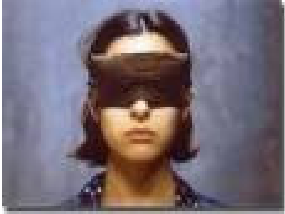
Foto 02 – Registro fotográfico da Ditadura Militar

Neste capítulo, discuto a intrínseca relação existente entre avaliação e educação na educação superior, para apresentar a concepção de avaliação que orienta minhas análises ao longo de todo o estudo. Meu foco é a avaliação como fenômeno social que expressa uma prática social presente não apenas nos sistemas educacionais formais, mas em toda sociedade. É um fenômeno ético-político que opera com valores referenciados em diferentes e distintos grupos sociais e serve a uma concepção de educação articulada a uma idéia de sociedade e de homem. Discuto também a trajetória inicial do processo de consolidação da avaliação como área específica de conhecimento.