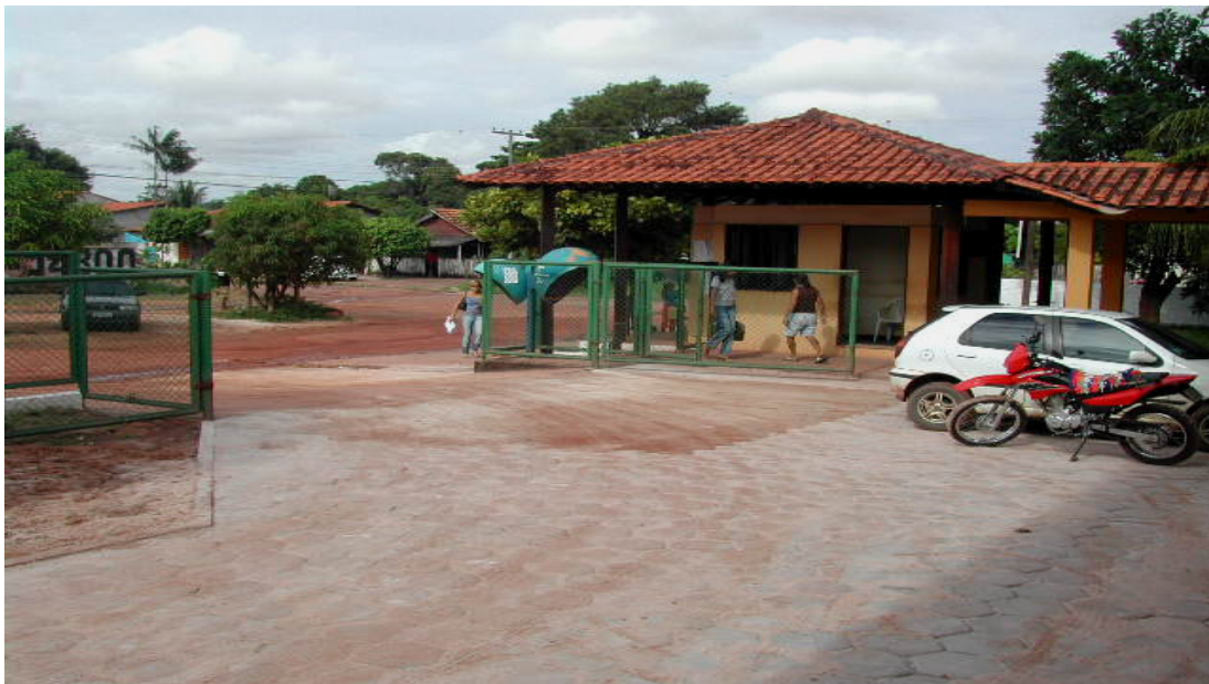
Foto 10 - Vista da entrada lateral do Campus da UFPA/Stm

Considerando a importância deste estudo para a Ciência da Educação e sem a pretensão daqueles que almejam transformar a ciência em um conhecimento conclusivo e acabado, encerro este trabalho apresentando algumas considerações finais a respeito do tema estudado, por seus aspectos sócio-históricos e os resultados da análise dos relatos orais dos sujeitos da pesquisa, na perspectiva de alcance do objetivo proposto.