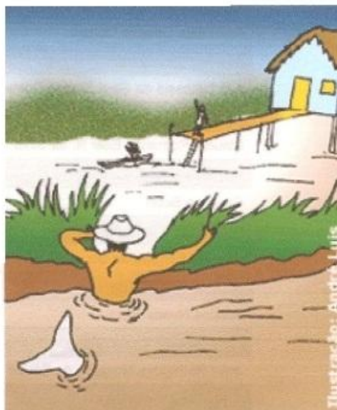
Ilustração: André Luis

Veja abaixo alguns personagens da mitologia amazônica. Qual(is) dos abaixo você já conhecia/ tinha ouvido falar?