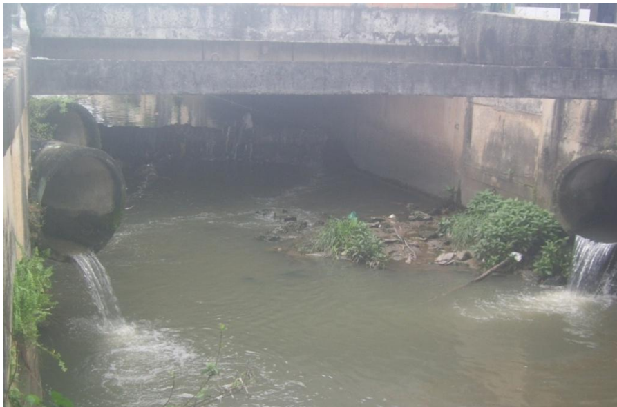
Fotografia 7 - O encontro das águas sujas.

A Fotografia 7, abaixo mostrada, da aluna SC, traz para discussão a questão do saneamento básico. A referida aluna elabora uma metáfora muito interessante a respeito dos efluentes 4 e dos afluentes 5 . Deste modo, o título da mesma, diz respeito ao “ encontro das águas ” provenientes dos esgotos, que formam o encontro de águas sujas, carregadas de resíduos derivados de atividades humanas (efluentes), representando metaforicamente algo muito comum em nossa rica região Amazônica, ou seja, o encontro das águas, que ocorre quando um rio junta-se a outro, como acontece com o Rio Negro e Solimões 6 (afluentes). Assim, a referida fotografia retrata o encontro das águas urbanas, em uma visão sarcasticamente, poética e criativa.