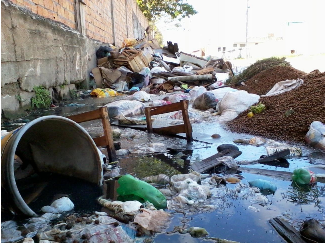
Fotografia 3 - Acervo do lixo.

Em realidade, é mínima a sensibilidade ecológica, notadamente no que se refere ao lixo e, também, em relação a outros aspectos que comprometem a qualidade do ambiente. Vejamos, então, o que aponta a aluna CT: