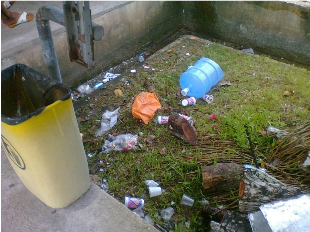
Fotografia 5 - Lugar de lixo é no lixo.