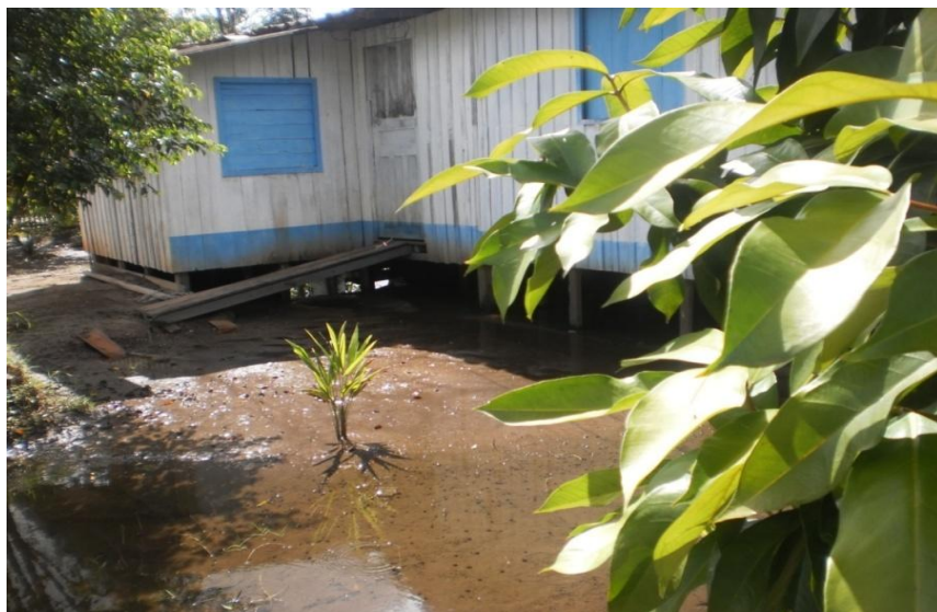
Fotografia 1 - Natureza: até que ponto ela suportará tantas interferências?

A Fotografia 1 destacada a seguir, obtida pela discente AS, de maneira geral, trata de questões relacionadas a perdas. Perda, por exemplo, de um ambiente que fez parte da infância da autora da fotografia, no qual ocorreram drásticas modificações paisagísticas acarretadas pelo homem. Inclusive, a extinção do olho d'água que ali existia.