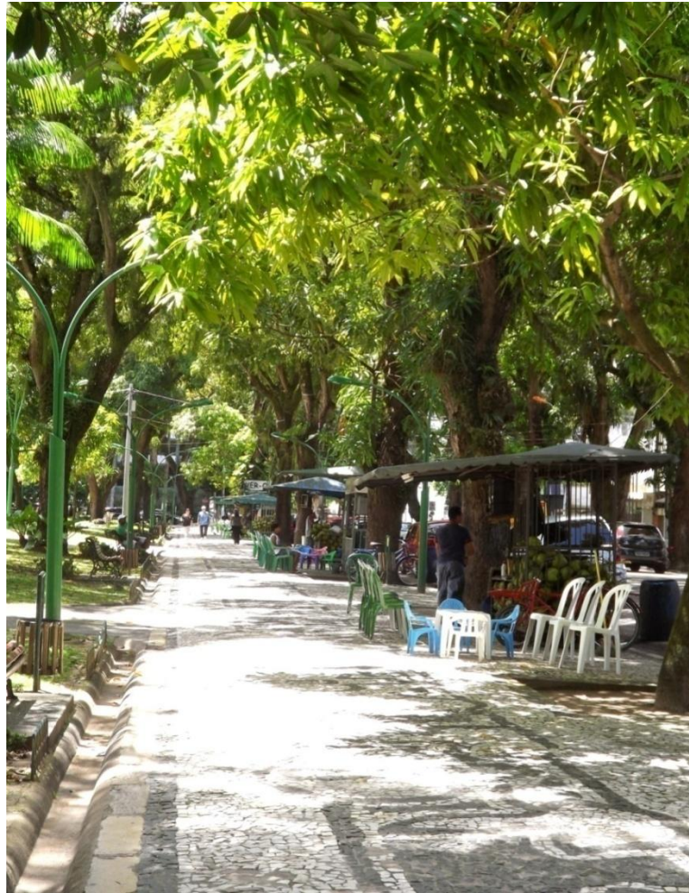
Fotografia 8 – Multifaces do ambiente.

Leitura da Fotografia 8: A foto foi tirada em um momento de descontração no qual surgiu a reflexão sobre a utilização do espaço. A Praça Batista Campos é reconhecidamente um ponto turístico de Belém. Diariamente passam por ela centenas de pessoas que utilizam o espaço sem perceber os variados e grandiosos benefícios que ela proporciona. Começando pelas majestosas árvores, que formam grandes copas e conseqüentemente sombras , que são conscientemente utilizadas pela população. Tais copas diminuem a temperatura no solo de 2° a 3°C, melhorando a sensação térmica para as pessoas que circulam sob ela, o que é de fundamental importância, levando em consideração Belém ser uma cidade quente e úmida. Além das sombras proporcionadas, poucos conhecem um processo de vital importância realizado por aquelas árvores: a evapotranspiração.