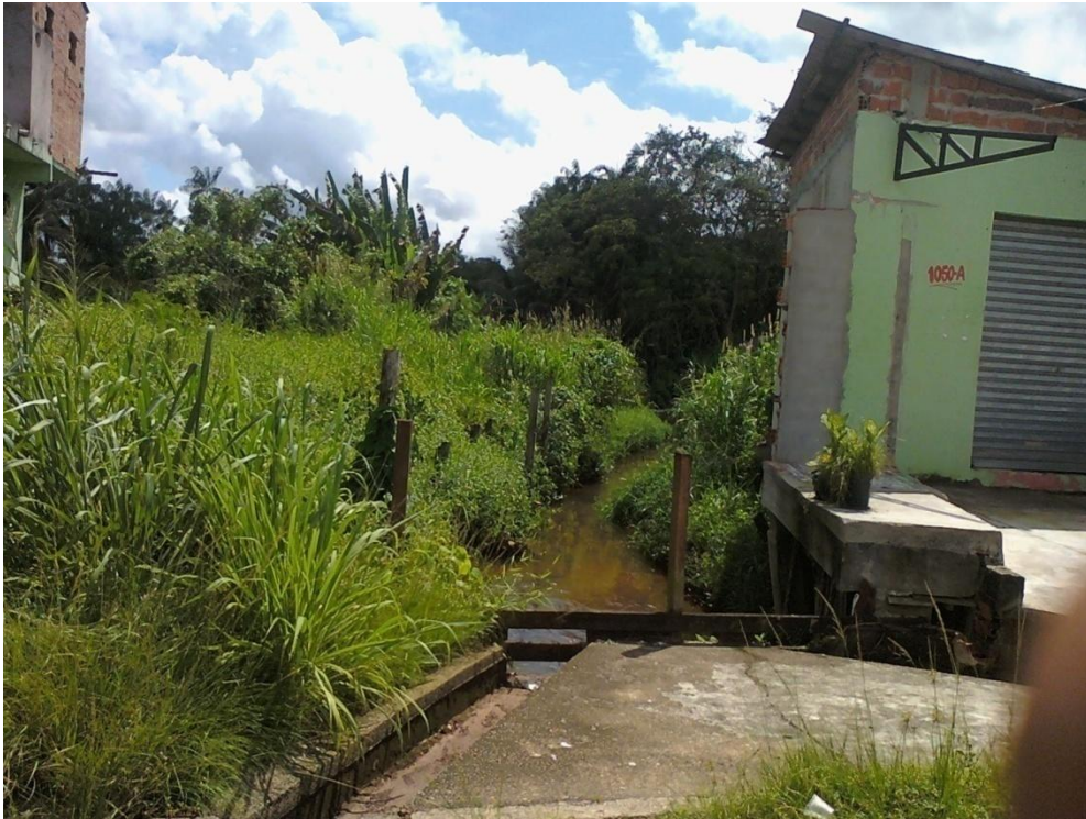
Fotografia 4 - Desenvolvimento Sufocante.

Leitura da Fotografia 4: A imagem pode mostrar muitas outras coisas, porém o motivo de tê-la escolhido foi o fato de o “desenvolvimento” estar sufocando o igarapé , ou poderíamos dizer, o que restou do antigo igarapé. É fácil ver que não houve preocupação com o futuro do igarapé , pois casas foram construídas as suas margens fazendo com que ele perdesse a vida paulatinamente , este é o preço que temos que pagar pelo desenvolvimento? Se for, temos que começar a agir rapidamente , pois, caso contrário, acabaremos com nosso planeta. Muito se fala sobre desenvolvimento sustentável , entretanto pouco se vê deste conceito sendo aplicado nas cidades e isso é notável nesta imagem.