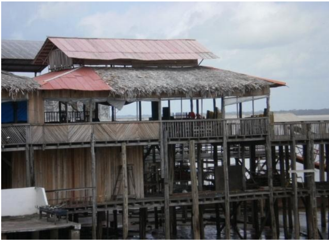
Fotografia 2 - Bordas Urbanas.

Ao fazer a leitura da sua fotografia (Fotografia 2), a discente AA, na nossa compreensão, retrata, em termos gerais, as condições de vivência de parcela da sociedade que está à margem dos benefícios socioeconômicos advindos do modo de produção capitalista. Também, nos revela a ausência da ação do Estado. Analisemos, então, como se apresenta a leitura da referida aluna.