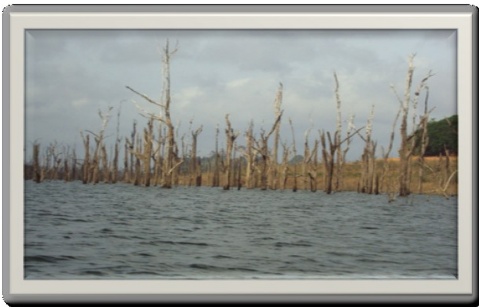
Fig.7 – Parte da área do reservatório da UHE Tucuruí exposta no período de seca.