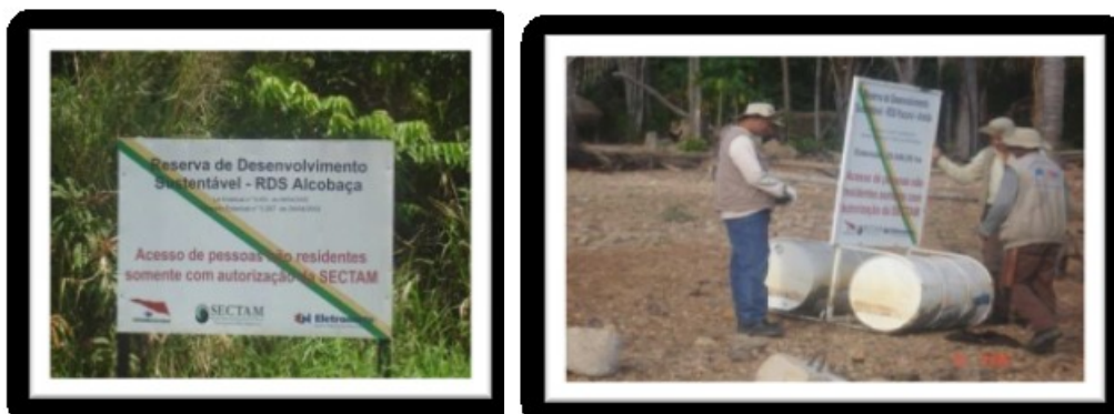
Fig.6 – Placas de identificação das RDS Alcobaça e Pucuruí-Ararão (Fontes: Araujo, 2008 e CPA – Eletronorte, 2008).

As RDS Alcobaça e Pucuruí-Ararão (figura 6) foram oficialmente criadas pela Lei 6.451 de 08 de abril de 2002, do Governo do Estado do Pará, fazendo parte do Mosaico de Unidades de Conservação do Lago de Tucuruí. A Reserva de Desenvolvimento Sustentável Alcobaça possui área de 36.128 ha (trinta e seis mil, cento e vinte e oito hectares) e abrange áreas dos municípios de Tucuruí e Novo Repartimento. A Reserva de Desenvolvimento Sustentável Pucuruí-Ararão possui área 29.049 ha (vinte e nove mil, quarenta e nove hectares) e abrange áreas dos municípios de Tucuruí e Novo Repartimento (ARAUJO, 2008).