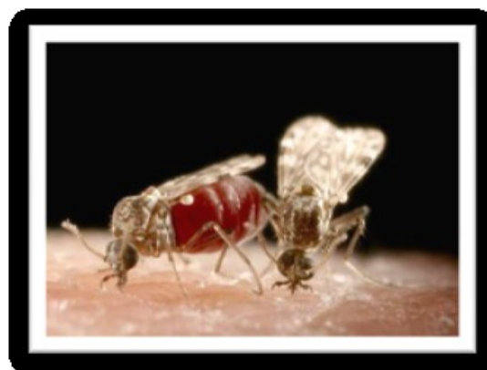
Fig.2 – Aedes aegypti (Fonte: Google, 2010) Fig. 3 – Culicoidis paraensis (Fonte: Google, 2010)