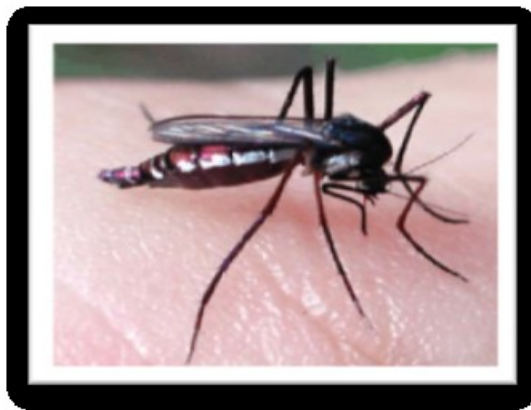
Fig. 4 – Haemagogus janthinomys