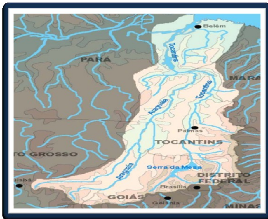
Fig. 5 – Bacia Hidrográfica do Tocantins – Araguaia