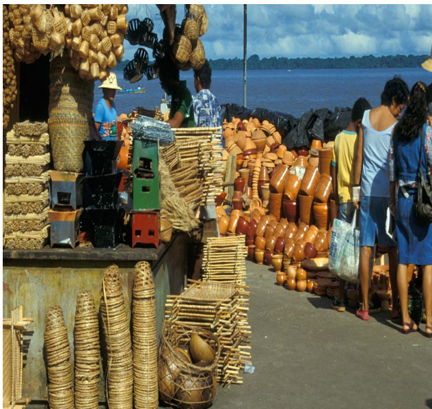
Figura 4: Ver o Peso - Belém/PA