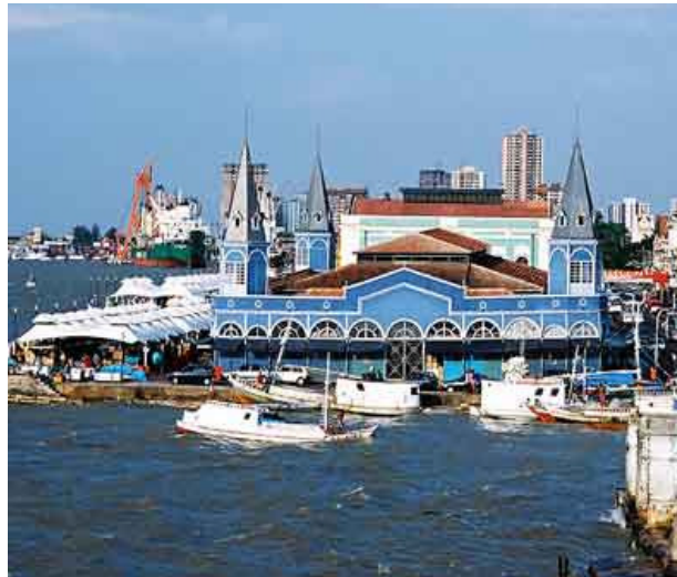
Figura 3: Mercado do peixe - Belém/PA