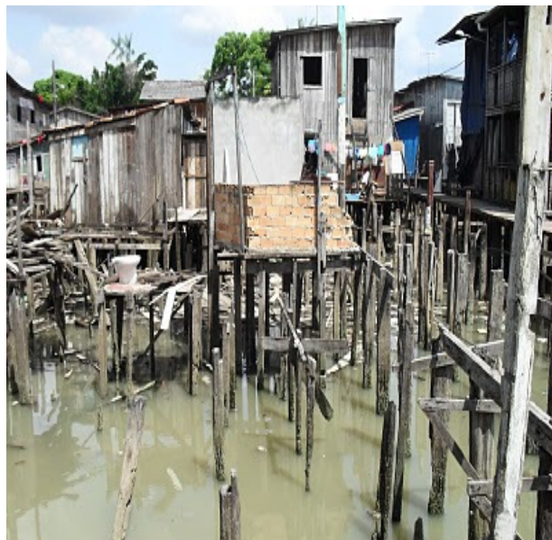
Figura 5: Vila da Barca - Belém/PA