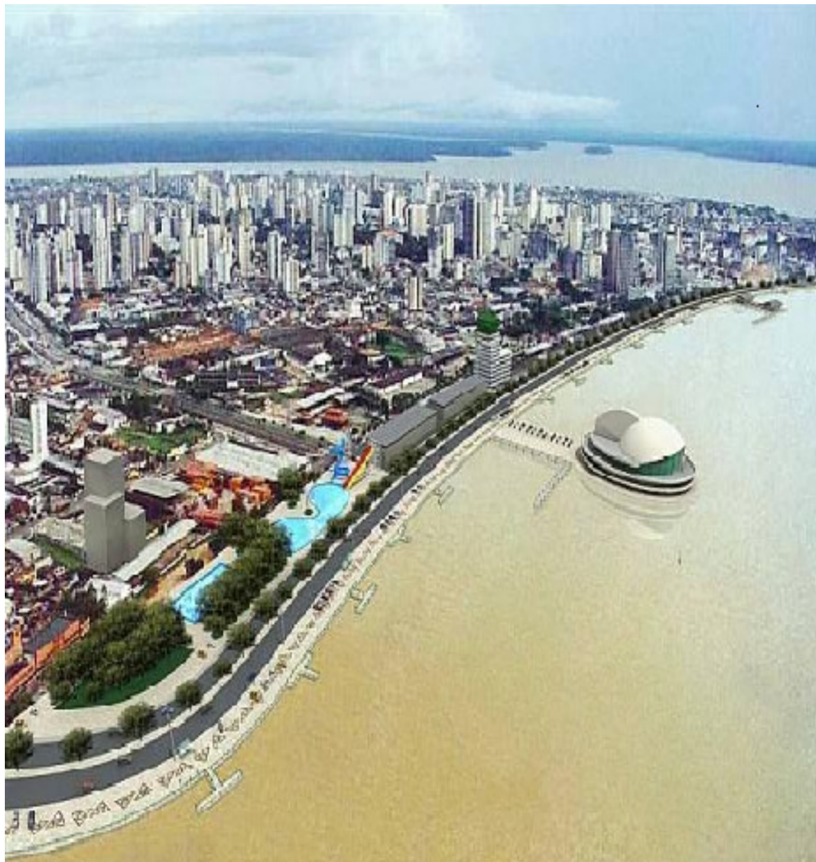
Figura 1 - Projeto Portal da Amazônia – Belém/PA