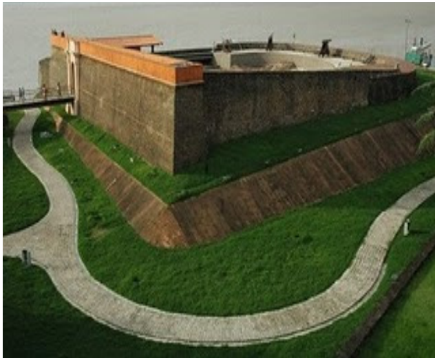
Figura 2: Forte do Presépio - Belém/PA