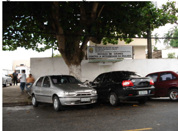
Figura 1: Fachada da Delegacia da Mulher de Belém (PA)

Foi com o intuito de participar mais de perto das articulações cotidianas em torno da “violência contra a mulher” que se deu início às visitas à Delegacia da Mulher de Belém (PA). Tal delegacia foi criada em 22 de maio de 1987. Sob a coordenação do Conselho Municipal dos Direitos da Mulher, vários movimentos autônomos de mulheres apresentaram um projeto reivindicando a criação de uma delegacia específica para os casos de violência contra a mulher à semelhança da que já existia desde 1985 em São Paulo (SANTOS, 1996). Desde sua criação, a Delegacia da Mulher já teve três endereços, estando atualmente situada na travessa Vileta, no perímetro entre duas grandes avenidas de Belém: a Almirante Barroso (único acesso para a entrada e saída da cidade) e a João Paulo II (ainda conhecida por 1º de Dezembro). A delegacia está em um bairro periférico de Belém, consoante a antiga fórmula de controle social que exige policiamento na periferia, uma vez que é onde supostamente se encontra a população problemática por suas relações familiares violentas (SOARES, 2003).