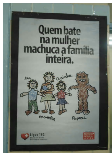
Figura 3: Cartaz da Campanha do Instituto Patrícia Galvão

Esse cenário é composto por vários cartazes, a maioria deles versando sobre a Lei Maria da Penha, nos quais há explicações sobre as principais alterações trazidas pela lei. Havia ainda um cartaz sobre a campanha 16 dias de ativismo pelo fim da violência contra a mulher e um outro dos Alcoólicos Anônimos. Além deles, um cartaz bem interessante, distribuído pelo Instituto Patrícia Galvão, no qual há o desenho de uma família, que mostra os filhos e a mulher (mãe) chorando e o homem (pai) no papel de “monstro”. É o único cartaz que faz referência ao homem na Delegacia da Mulher, descrevendo-o como um ser monstruoso, culpado pela dor, pelas lágrimas e pela tristeza da família.