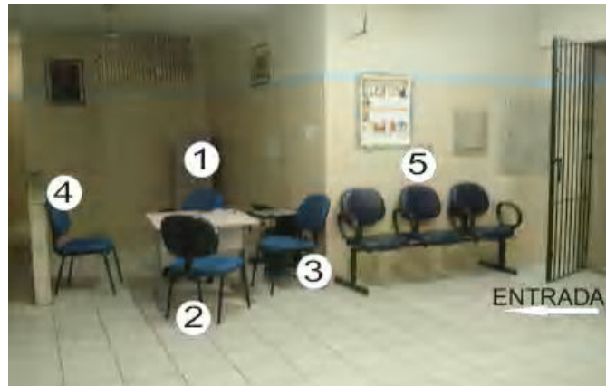
Figura 2: Salão de entrada da Delegacia da Mulher de Belém (PA)

Legenda: 1-Policial “repcionista”; 2-Mulher denunciante; 3- Eventualmente um(a) acompanhante; 4-Eventualmente outro(a) policial; 5- Pessoas aguardando.