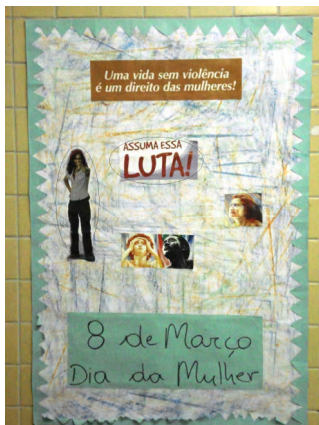
Figura 4: Cartaz-montagem presente no salão de entrada