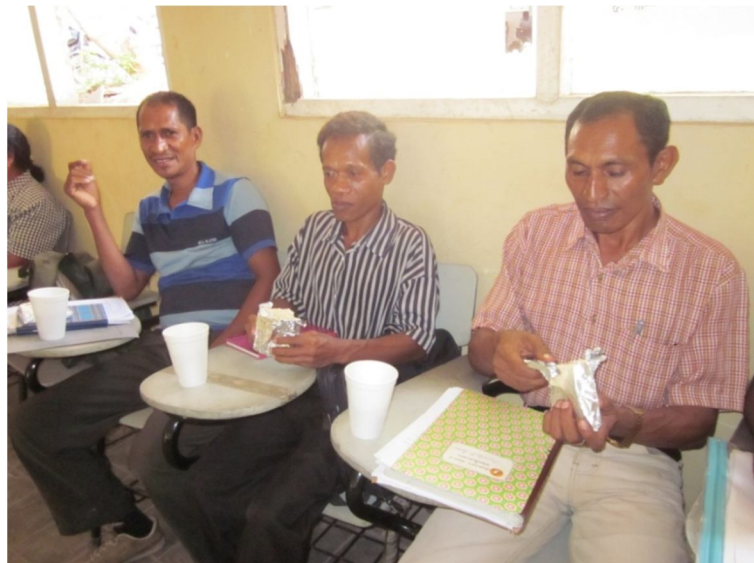
Figura 7 – Foto: Aula 1 da oficina de textos injuntivos: Receita “Sanduíche de atum”

didática da aula provocou diversas reações: primeiramente, os cursistas não se sentiram à vontade em organizar as cadeiras em forma de círculos. Ao arrumar a mesa com os sanduíches perguntaram se era alguma festa. A pergunta seria natural, mas após explicar que era uma aula, eles resistiram em comer o sanduíche e fazer o que havia sido solicitado como proposta de atividade. Alguns cursistas homens sentiram-se incomodados com a atividade de escrever uma receita, pois, segundo eles, receitas seriam “coisas de mulheres”. Depois de uma longa conversa, eles aceitaram provar o sanduíche e escrever o texto, porém, com semblantes surpresos por estarem participando de um formato de aula diferente do que eles concebem ser uma aula (fig. 7). As cursistas mulheres logo disseram que se tratava de uma receita culinária e escreveram dentro da estrutura textual do referido gênero. Outros se limitaram em narrar o fato que aconteceu na aula: “Comi um sanduíche com Coca-Cola”.