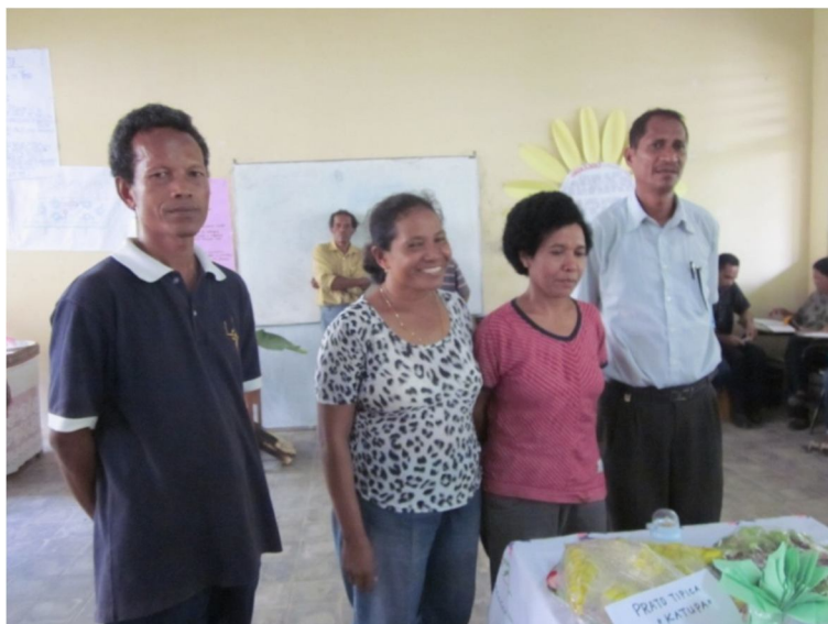
Figura 10 – Foto: Apresentação do prato típico Katupa na “Exposição receitas Culinária”