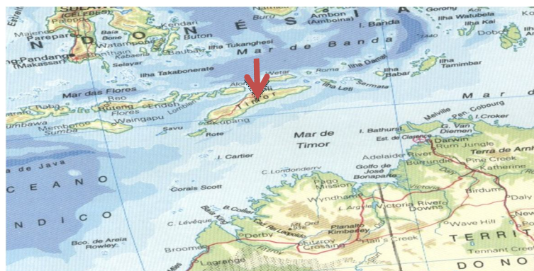
Figura 1 - Localização geográfica de Timor-Leste