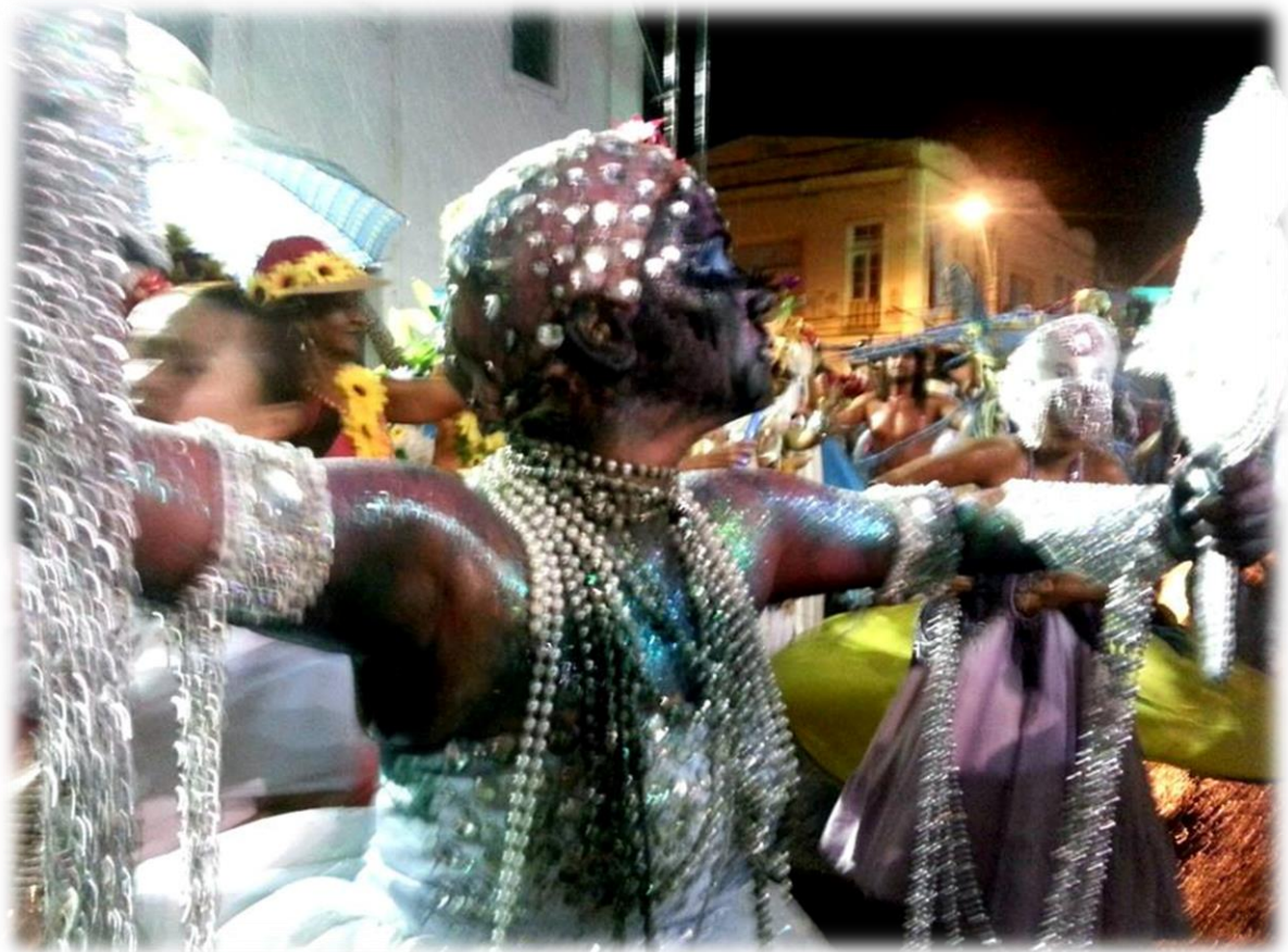
Fig. 20 - Yemanjá Ogunté sob a estética da chuva.