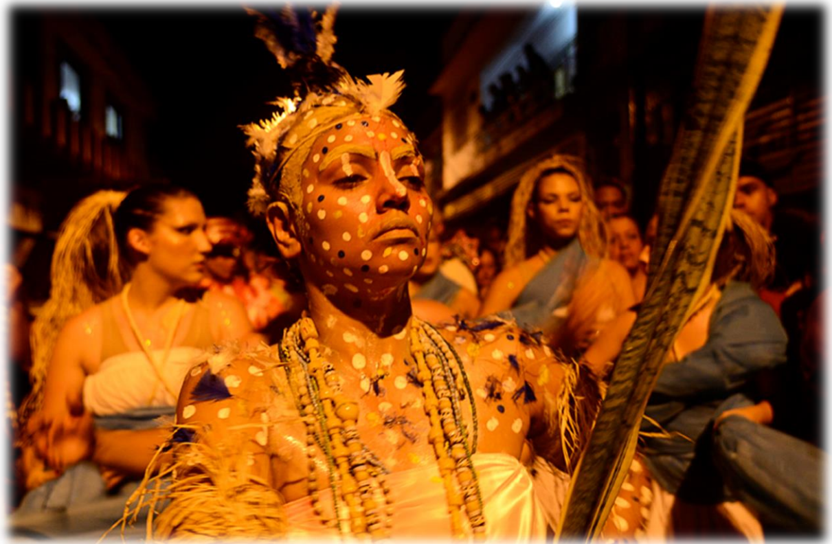
Fig. 15 - Corpo-comunidade .