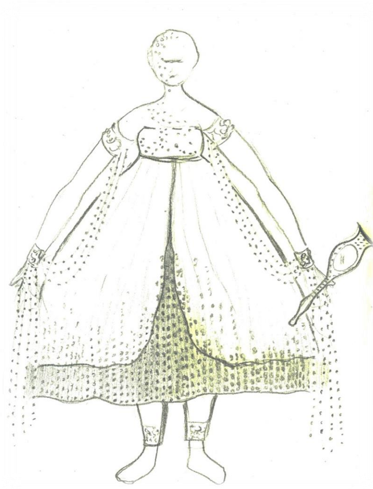
Fig. 31 - Figurino estilizado de Iyá - Rainha do Mar , de Aníbal Pacha.

Nessa produção realizada para o espetáculo O Auto do Círio, trouxe para o público um ícone da religiosidade e tradição do Candomblé, que me revelou uma emoção nunca antes vivenciada por mim: um corpo modificado pela experimentação de um símbolo sagrado que é a Yaô - começo de tudo. O corpo no Candomblé é poder que se constrói pela coletividade, na experiência vivenciada por ele para a perpetuação da memória de um povo. Sob essa perspectiva, a segunda experimentação deu continuidade ao ritual, onde a Yaô sai do Roncó com a vestimenta litúrgica como forma de comunicar sua história através do corpo do cavalo que dança. Na Iyá - Rainha do Mar utilizei figurino desenhado por Aníbal Pacha, professor e cenógrafo da Escola de Teatro e Dança da UFPA, com acentuação no simbolismo que vem das águas do mar, afirmando o reinado de Yemanjá sobre as águas: