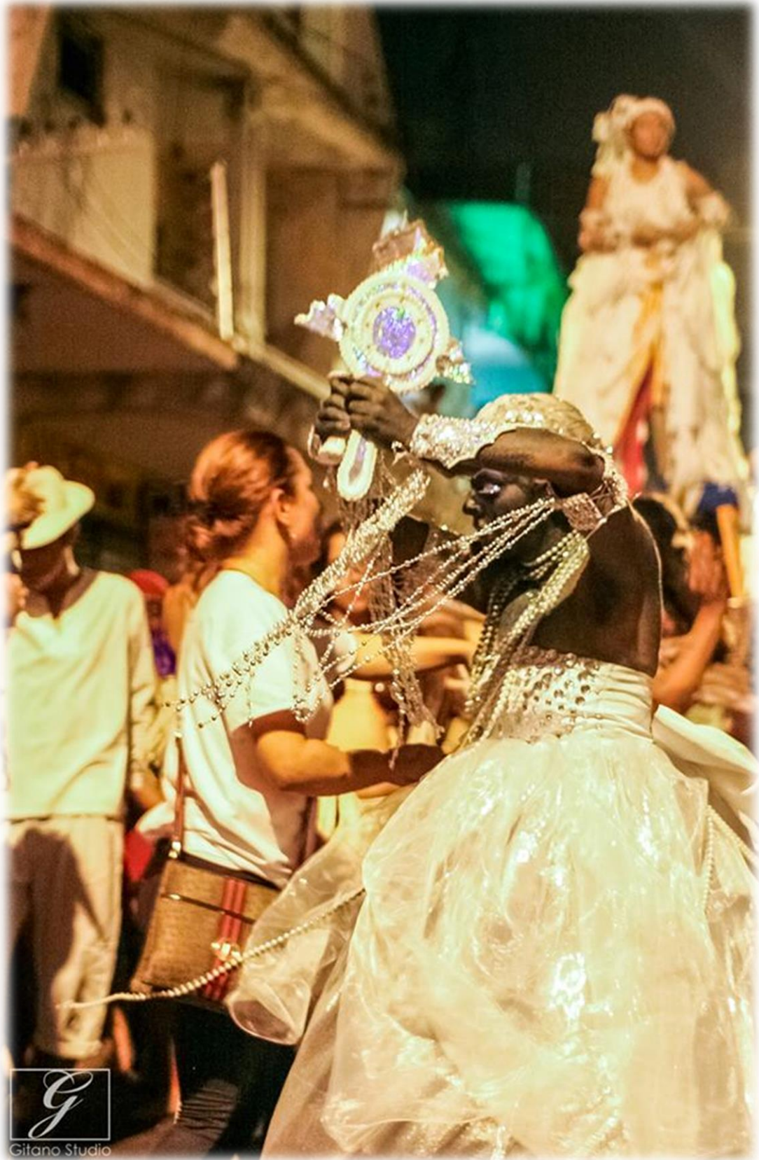
Fig. 57 - O corpo-cena da Iyá – Rainha do Mar.