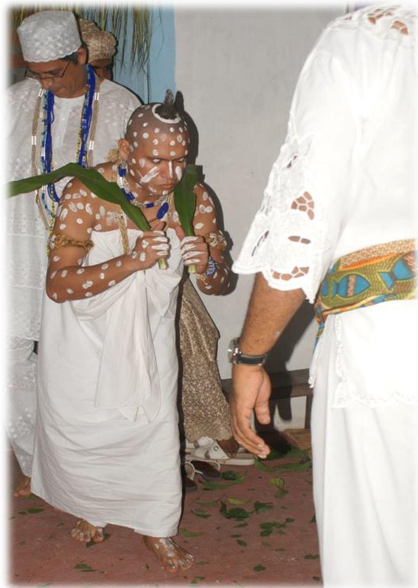
Fig. 10 - Yaô de Yemanjá Ogunté .