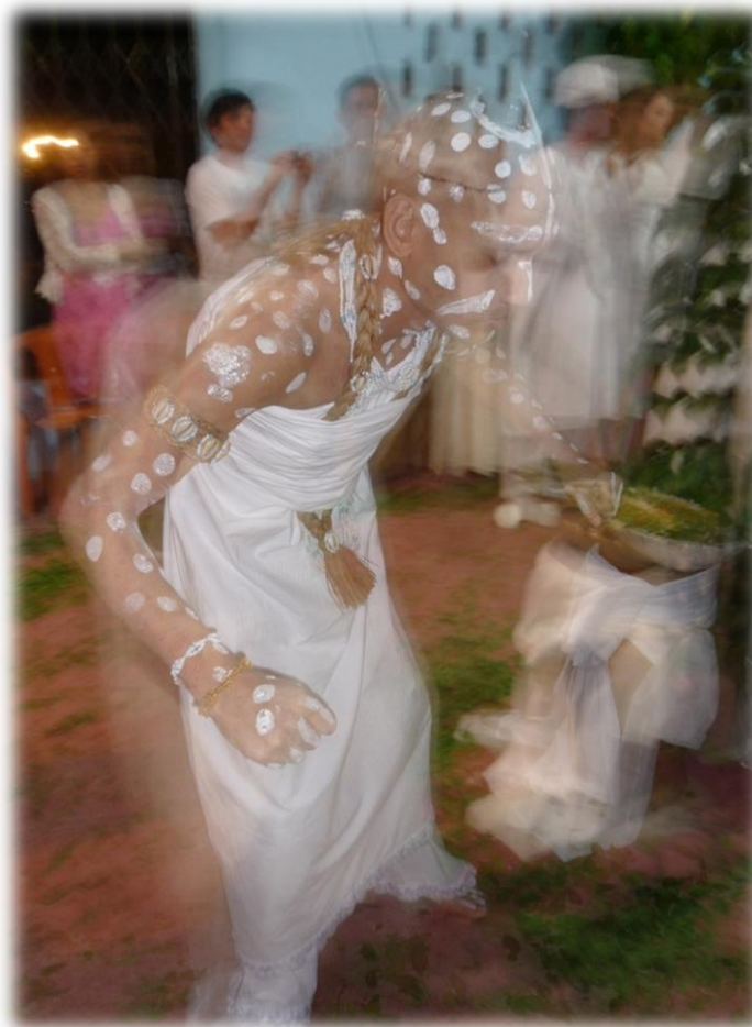
Figura 7 – A Iniciação.

A mudança de vida acontece mesmo antes do isolamento da Yaô , com as primeiras sensações corporais reconhecidas com a batida dos tambores sagrados. A partir de então, inicia-se também uma mudança não só no cotidiano da pessoa, mas também de status . A iniciação exige estrutura que vai desde estrutura emocional e psicológica à estrutura financeira, para cumprir com todas as obrigações que são necessárias. A seguir, a espetacularidade do ritual de iniciação revelada na imagem de uma Yaô , enquanto símbolo de mudança de vida: