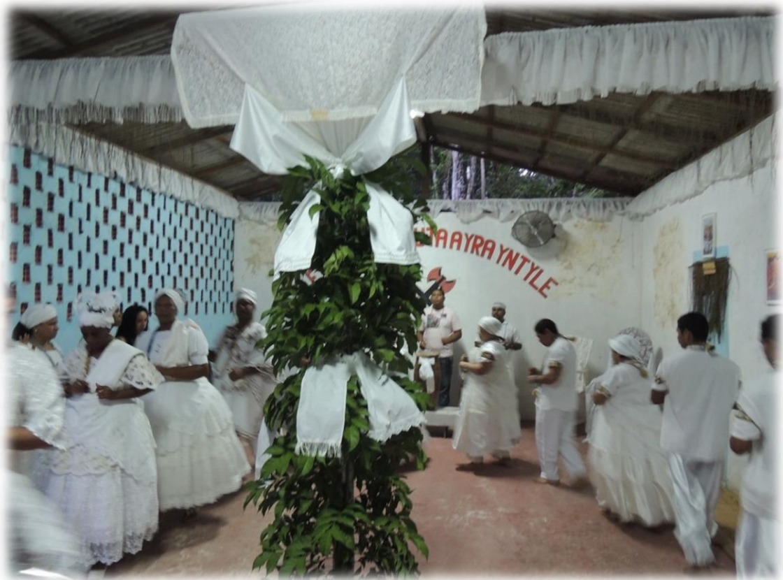
Figura 9 - A Circularidade.

produção de vários materiais para o ritual: o enxoval, os animais para os sacrifícios, o fechamento de corpo para renascer para uma nova vida. Todo o ritual é valorizado com a festa que a comunidade realiza para o nascimento do mais novo membro do Candomblé, marcando assim sua circularidade: