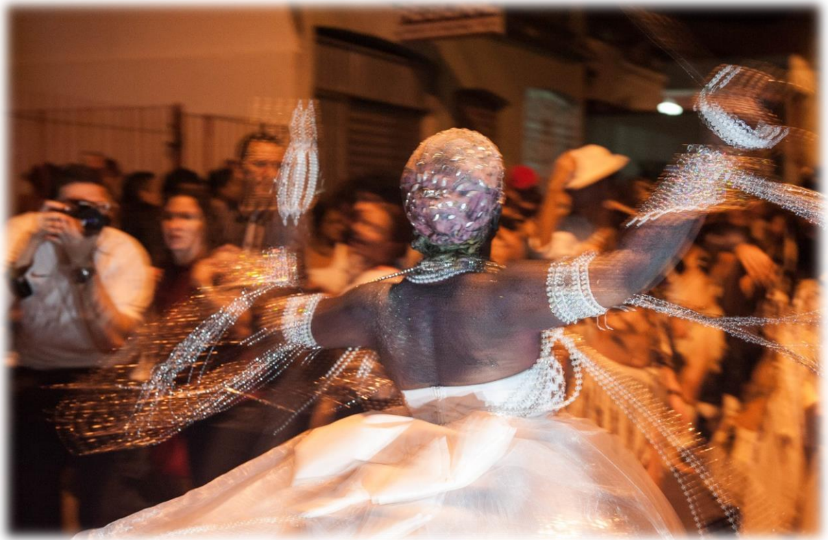
Fig. 19 - Yemanjá Ogunté gira no compartilhamento espiralar com Ogum e mostrar a força da guerreira.