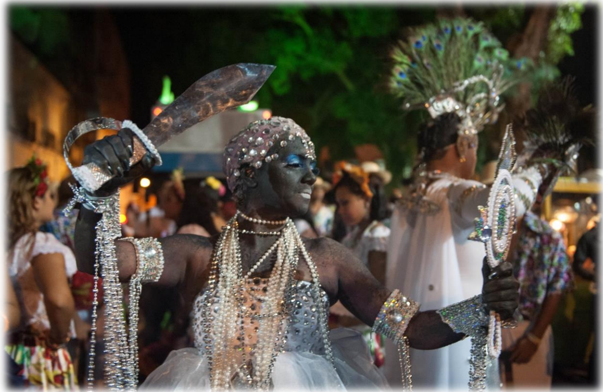
Fig. 17 - Iyá – Rainha do Mar demonstra sua vaidade no abebê .

pesquisa de campo nas festas de Candomblé. A seguir o corpo-cena da Iyá – Rainha do Mar , no cortejo do Auto do Círio: