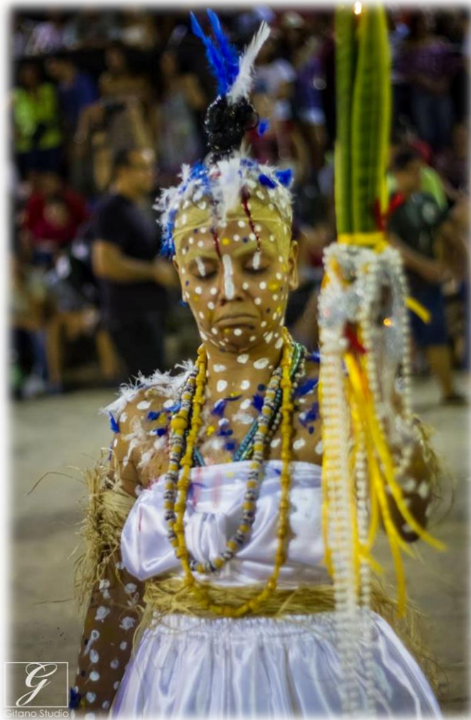
Figura 8 - A experimentação Flor de Efun, apresentada no Auto do Círio/2012.