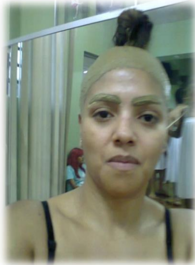
Fig. 22 – 30 - Processo criativo do corpo-cena - 2012.

penas, palhas da costa, espada de São Jorge, cordões, pérolas e sangue artificial feito com mel e anilina, como podemos observar na sequência abaixo, as imagens da composição do corpo-cena :