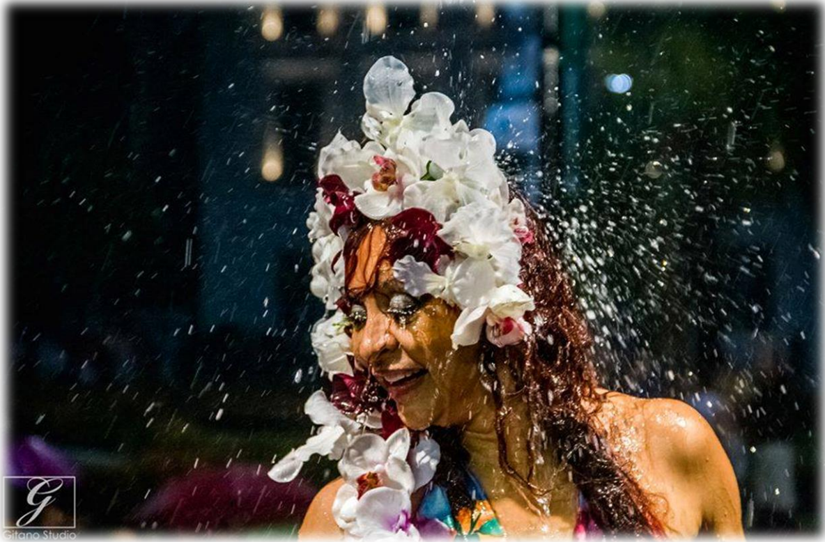
Fig. 21 - A chuva no Auto do Círio como parte do espetáculo.