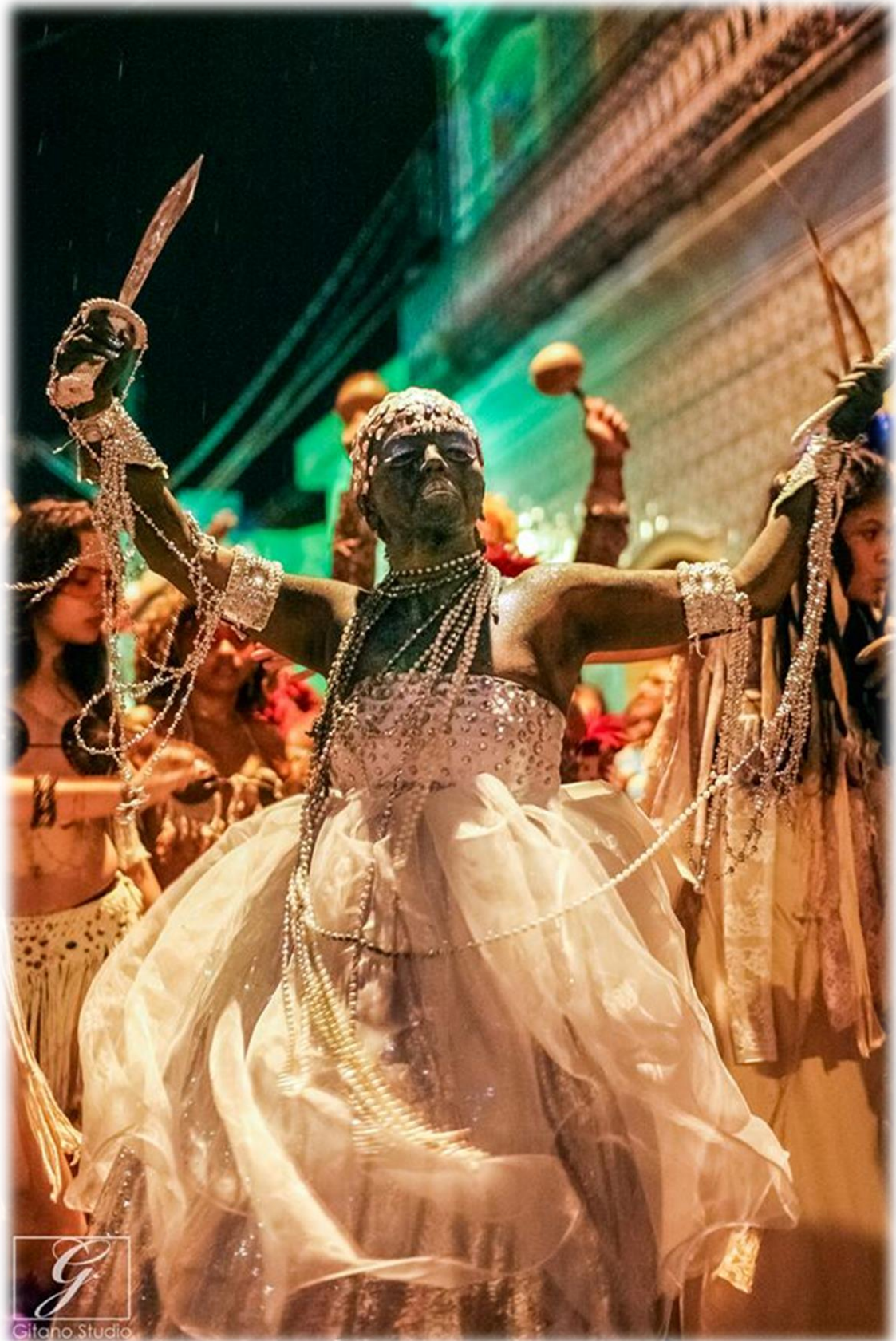
Fig. 56 - O corpo-cena da Iyá – Rainha do Mar.