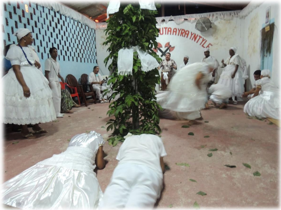
Fig. 4 - Salão das festas públicas.

sua casa acontecem, geralmente, aos sábados, com um calendário, mais ou menos, previsto. A seguir imagem de festa pública no terreiro: