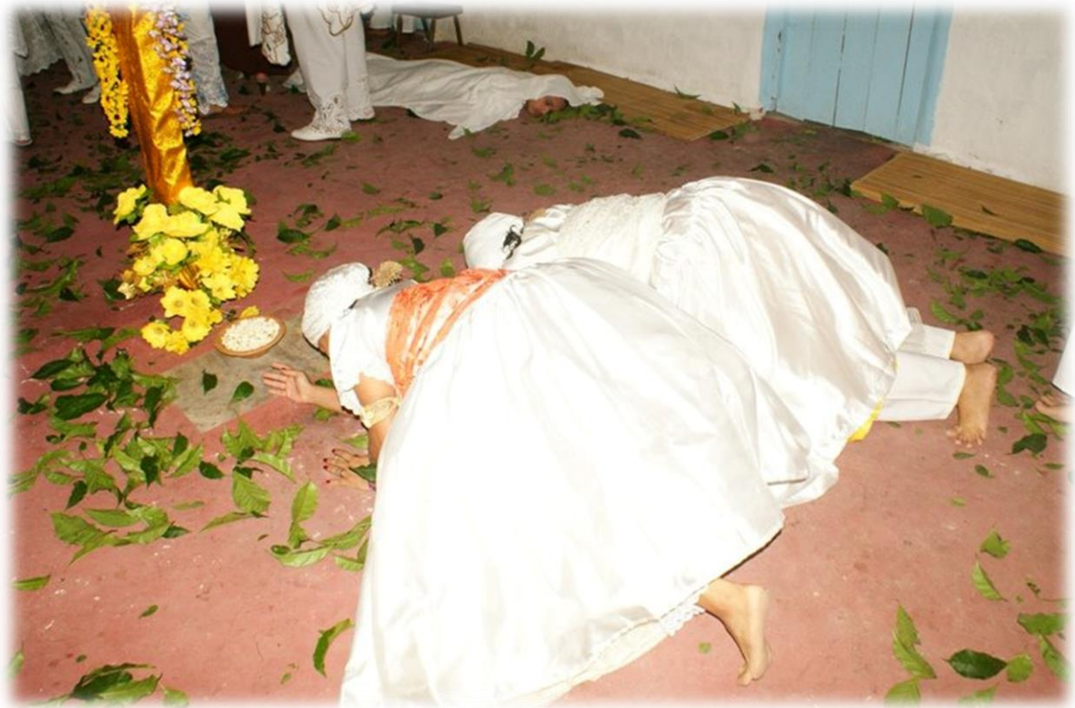
Fig. 5 - Fundamento do terreiro Yle Ase Oba Okuta Ayra Yntyle .