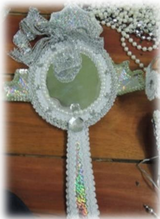
Fig. 32 a 55 - Processo criativo do corpo-cena - 2013.

Mais uma vez, Cláudio Dídima, parceiro na cena e também no Grupo de Pesquisa em Carnaval e Etnocenologia – TAMBOR colaborou na criação da pintura feita com pancake, criado por ele que apresentava a cor ameixa, mas que se transformou com a textura da minha pele deixando-a com uma tonalidade mesclada. Utilizamos também: glitter nacarado, purpurina, maquiagem, pérolas, argila e gel. A seguir, a sequência da produção da Ogunté artística: