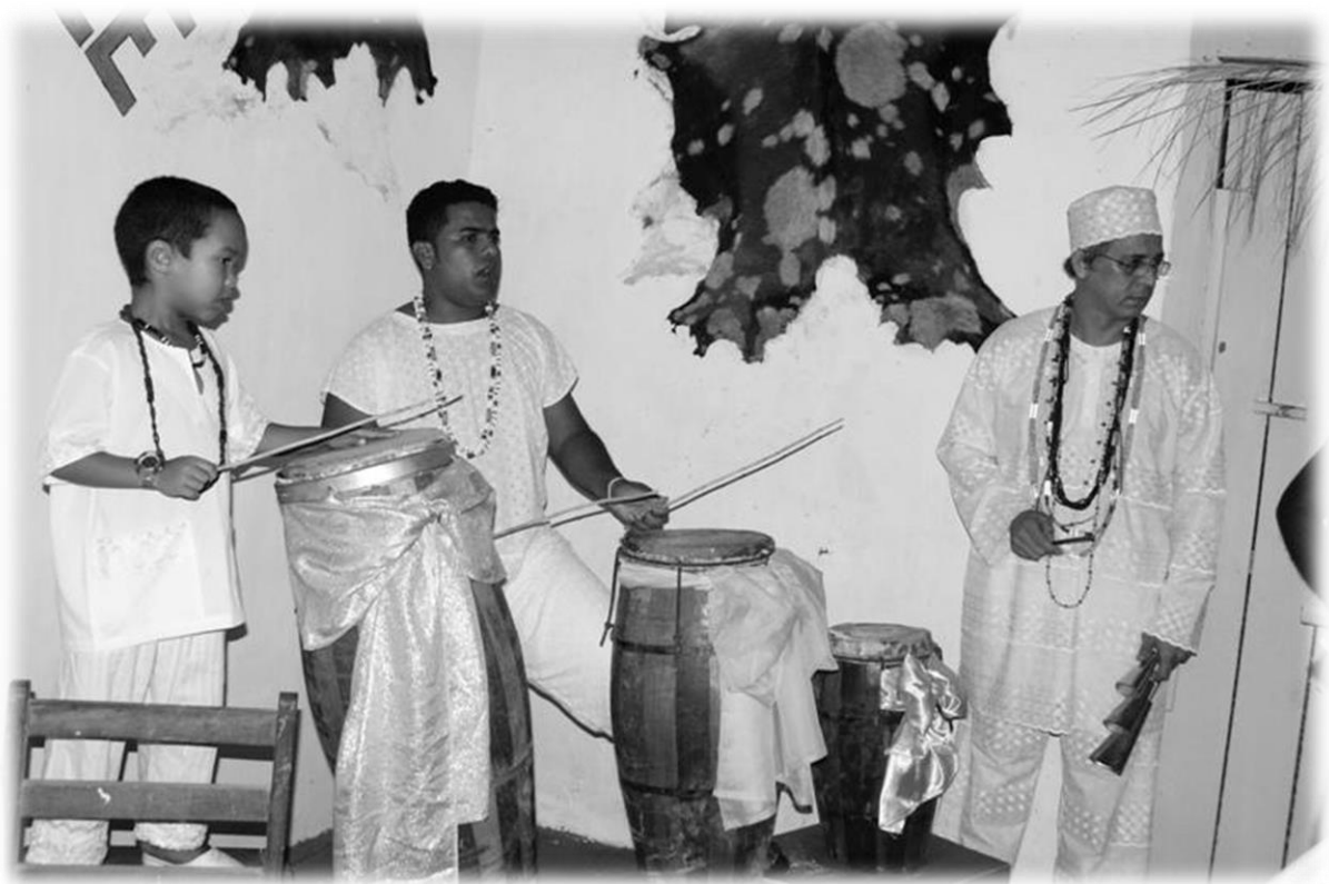
Fig. 3 - Rum , rumpi e le .

santo ou Orixá adequadamente (VERGER, 2012). São muitas as tradições na religião do Candomblé. Existem os zeladores das casas, chamadas de terreiros, além de linguagem específica, com cerimônias, cantos que são os orikis, danças e instrumentos musicais herdados da África. Entre eles estão os atabaques, que representam muito mais que simples instrumentos musicais, pois são sagrados e energizados por meio de oferendas e sacrifícios específicos para eles, e só quem pode tocá-los são os alabês , designados para exclusiva função. Os tambores são batizados, do maior para o menor, de rum , rumpi e le , deformações da palavras fon , hum e humpevi , para os dois primeiros, e da palavra nago , omele , para o terceiro (VERGER, 2012). Para os adeptos do Candomblé, os atabaques possuem personalidade. Nas cerimônias, os filhos e filhas saúdam os tambores antes mesmo de saudarem os Babalorixás e Iyalorixás , pais e mães do terreiro. A seguir imagem de atabaques sagrados: