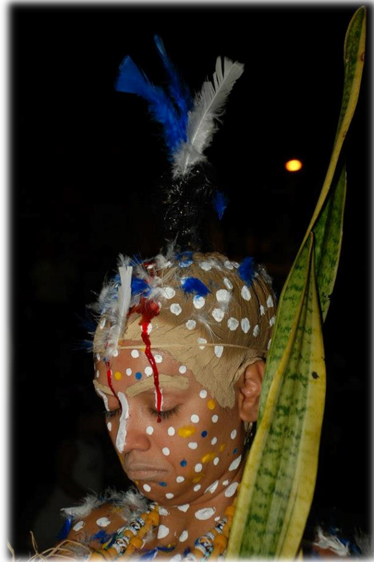
Fig. 13 - O corpo-cena - Flor de Efun.