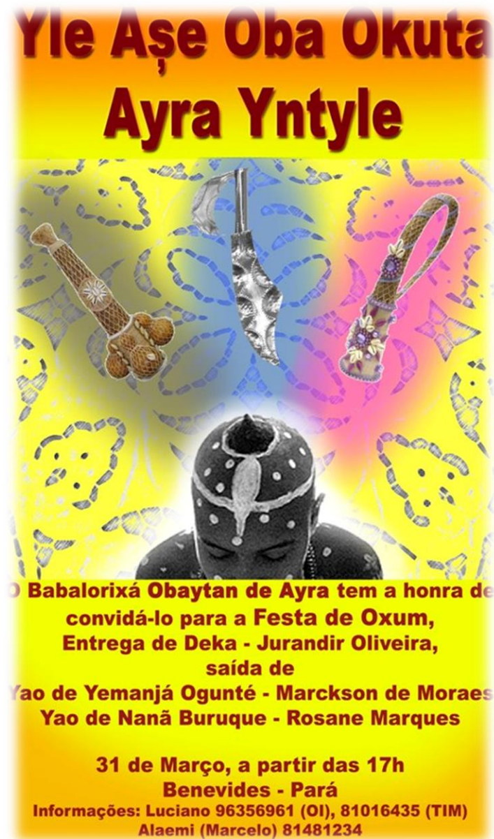
Fig. 6 - Convite do ritual de saída de santo.

Nota: Convite da saída de Orixá de Marckson de Moraes. Março de 2012.