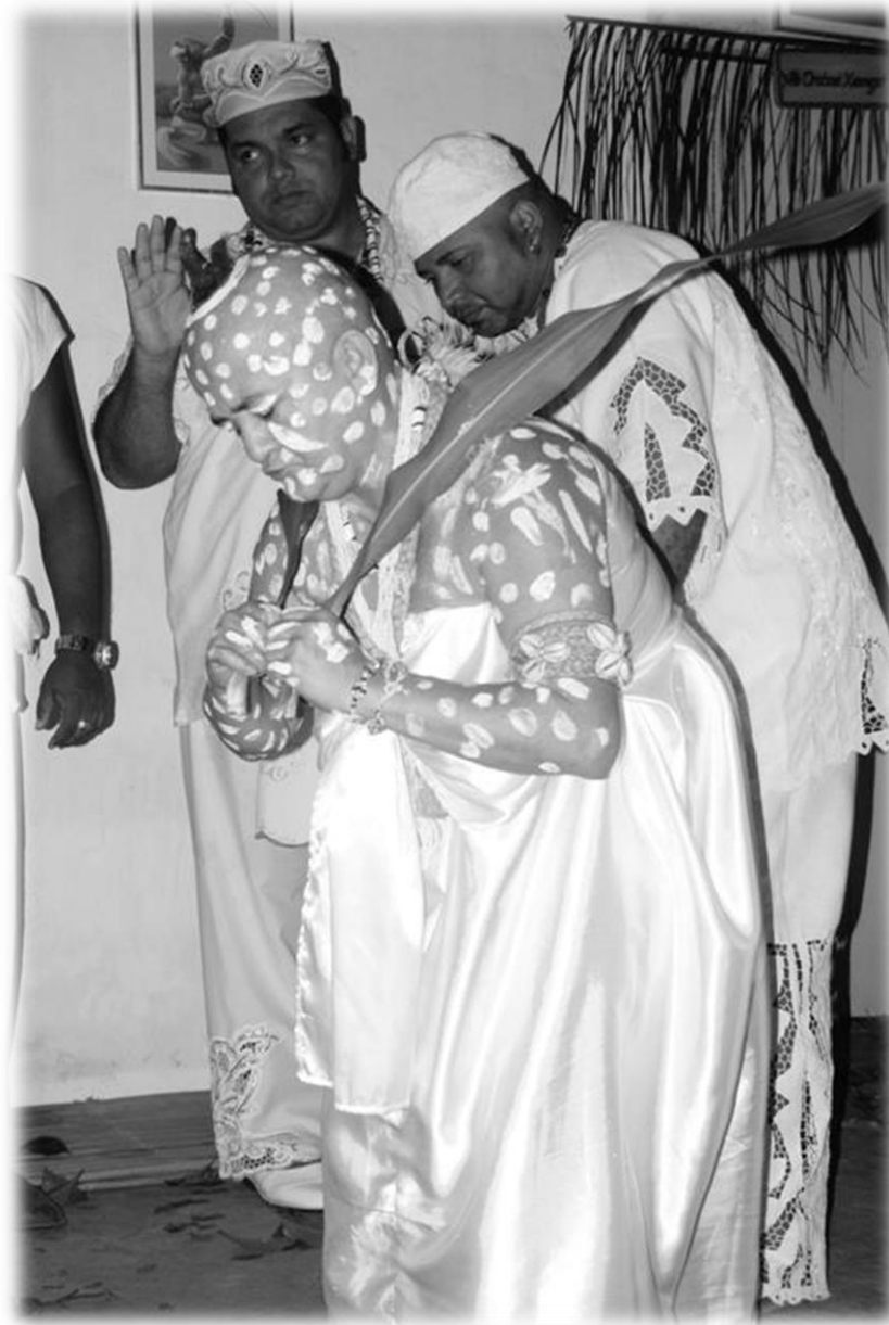
Fig. 2 - Saída de Yaô do Roncó .