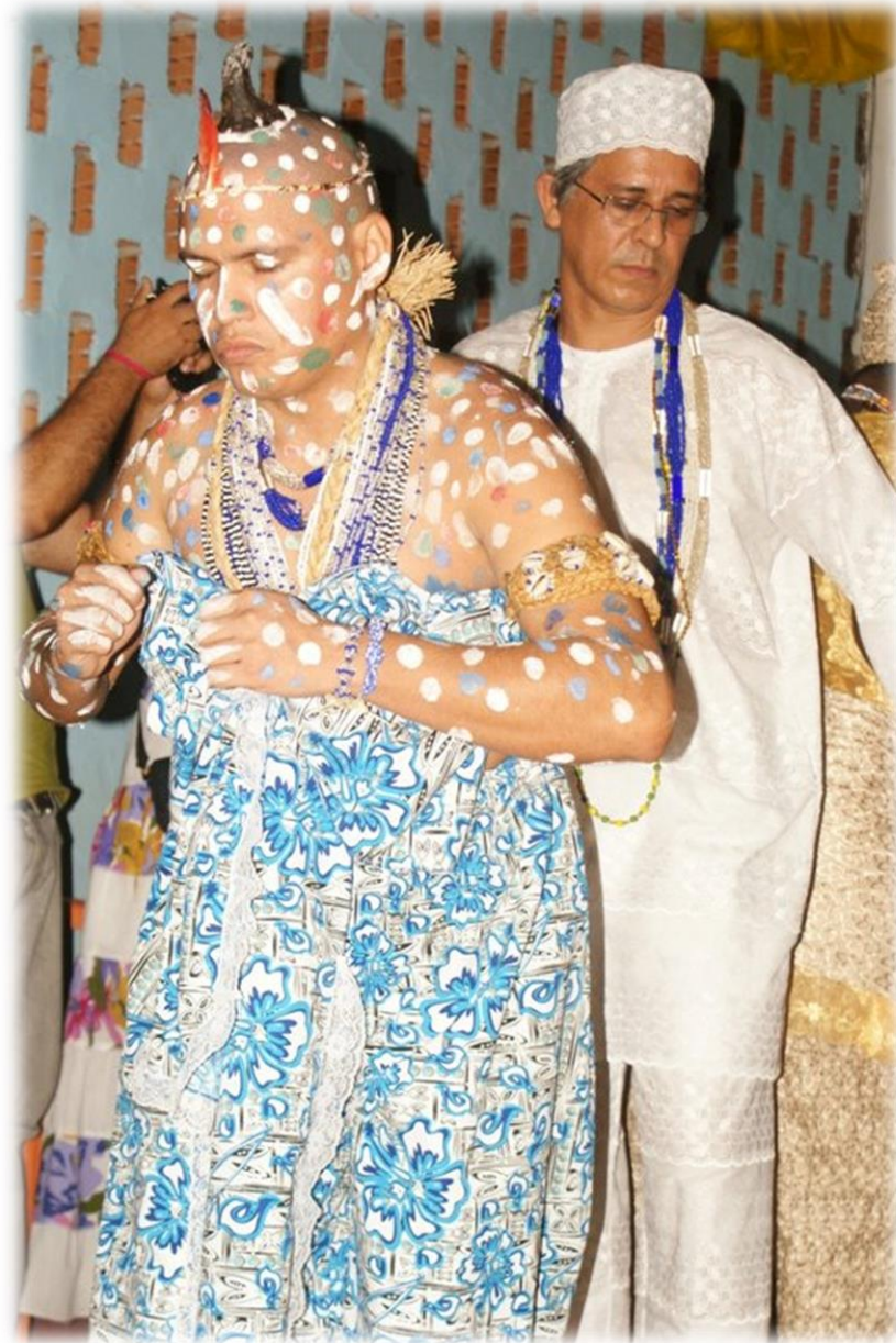
Fig. 11 - 2ª saída do Roncó .

Candomblé, entretanto procuro com essa dissertação partir dessa simbologia como matéria-prima para o meu fazer cênico. Como continuidade da investigação desse processo, segue a 2ª saída do Roncó :