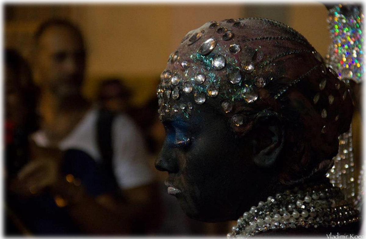
Fig. 18 - O corpo modificado de Yemanjá Ogunté .

O corpo que transcende algo inexplicável pela incorporação no xiré é a representação da maior simbologia que poderia abrigar em minhas investigações para um trabalho que desafia meu corpo enquanto atriz, para desenvolver sensações antes tão distantes da realidade vivida por mim. Para atuar representando o jiká acompanhei muitas festas públicas do Candomblé tentando compreender o poder da energia cósmica que toma conta do filho de santo, fazendo-o estremecer da cabeça aos pés. A força da energia representada por esse movimento contagia a todos os yaôs e abiãs que se preparam para a feitura. Além dos movimentos também ouvimos gritos de manifestações das entidades em seus filhos.