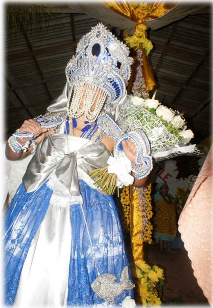
Fig. 16 - Yemanjá Ogunté.