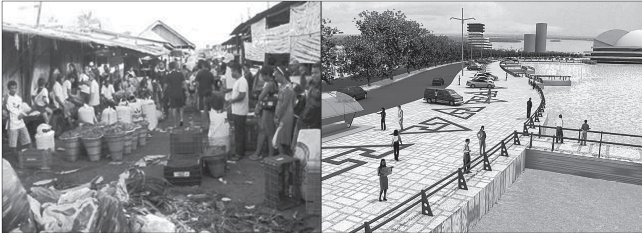
Figuras 3 e 4. Contraste entre o atual uso popular do Porto da Palha e o water front que se propõe. Desenho: Website da Prefeitura Municipal de Belém.

patrimonial que o projeto vai proporcionar àquele espaço não condiz com o atual uso popular. De fato, a requalificação alimenta o atual boom imobiliário que vai configurando o perfil da cidade com torres de alto padrão construtivo: