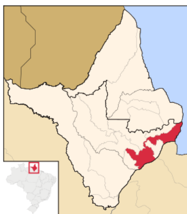
Figura 1. Localização geográfica do Município de Macapá, a Capital do Meio do Mundo.

O município de Macapá 47 é a capital do Estado do Amapá, sendo também a maior cidade, sua área é de 6.408,545 km 2 o que representa 4,4863 % do Estado, 0,1663 % da Região Norte e 0,0754 % do território brasileiro (IBGE, 2014). A sede da capital está situada na região metropolitana de Macapá, composta de um único município, Macapá. O município pertence à mesorregião do sul do Amapá e à microrregião homônima, no extremo norte do Brasil. Conforme destacamos na Figura 1.