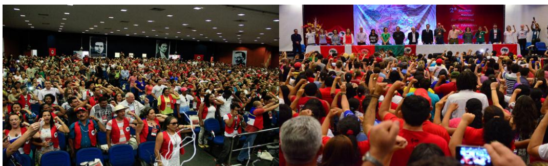
Figura 2: 2º ENERA - Solenidade com a presença de integrantes do governo federal, de Movimentos Sociais e intelectuais do Campo.