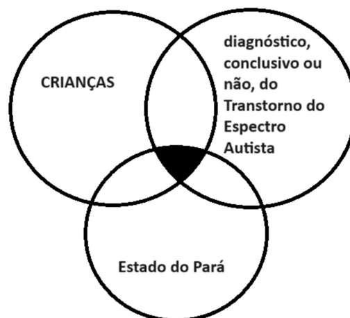
Figura 2 – interseção de marcadores de desigualdade

Elaborada pela própria autora da dissertação (2024)