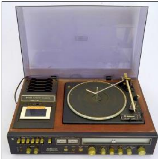
IMAGEM 1 - Aparelho de som 3x1, National SS7070

parecia estar perscrutando algo muito importante. Era assim que ele ouvia: com os olhos, com o corpo, com atenção. E foi assim, olhando pra ele, que eu comecei a aprender a ter um olhar atento para aqueles sons, para aquela música.