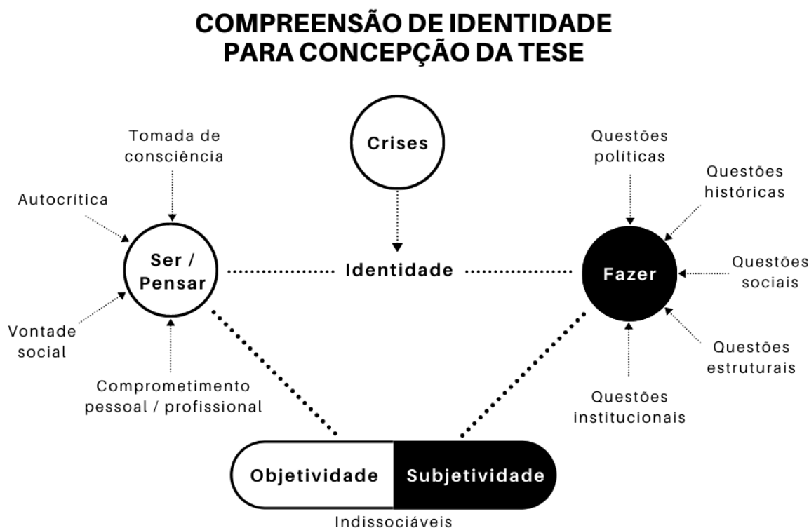
Figura 3: Compreensão de identidade para concepção da tese

partes de uma existência só, complexa e dinâmica, dos sujeitos. O esquema a seguir propõe uma sintetização das ideias construídas acerca dessa concepção (Figura 3).