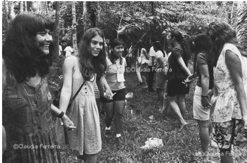
Figura 8 – I Encontro Internacional de Mulheres da Floresta Amazônica