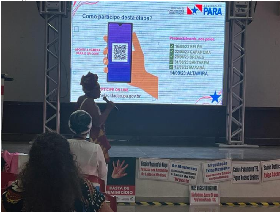
Figura 10 – Escutas sociais de mulheres /moradora do RUC Laranjeiras