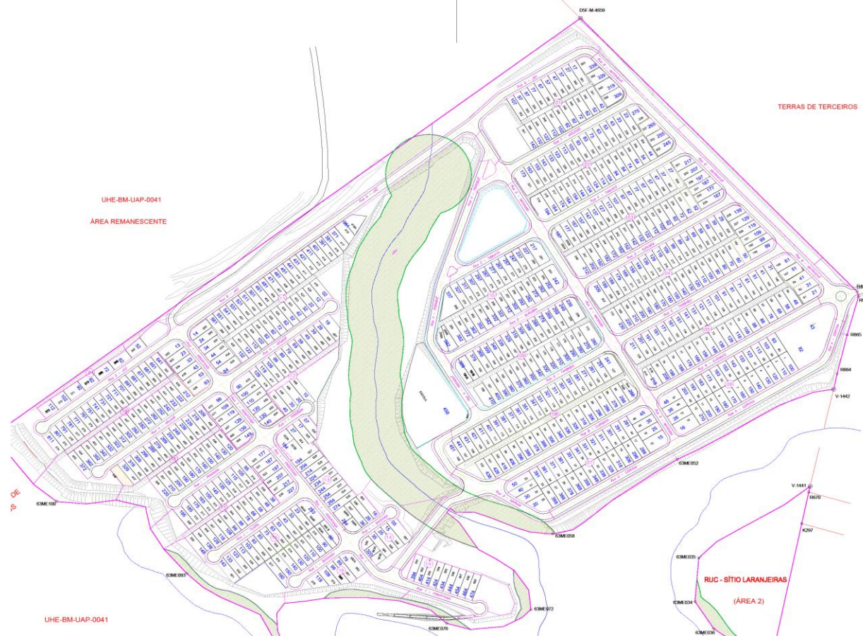
Figura 4 – Planta do RUC Laranjeiras