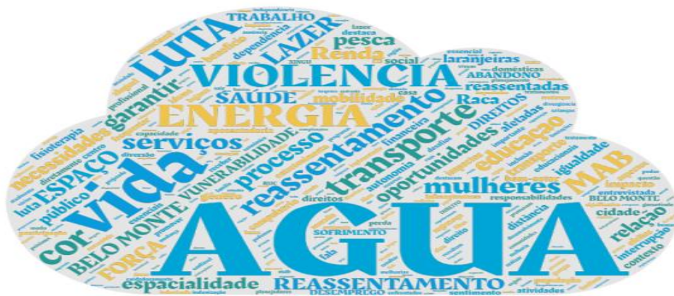
Figura 20 – Palavras Geradoras criadas pelas Mulheres