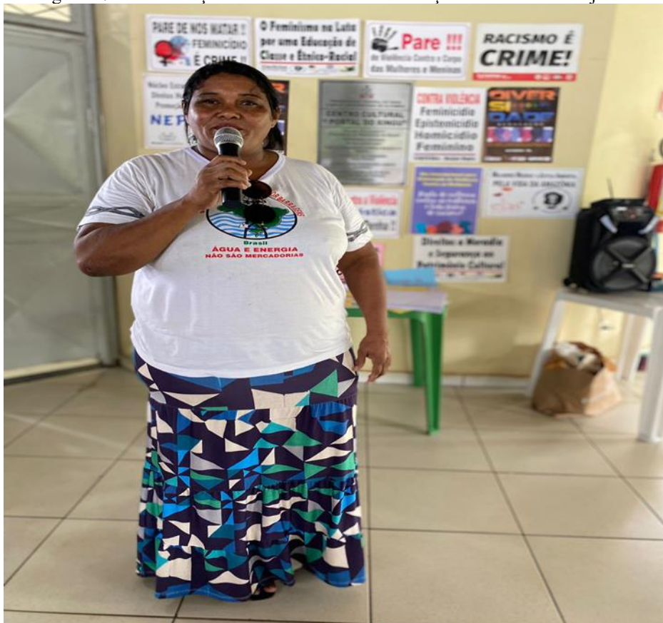
Figura 7 – Liderança das mulheres da Associação do RUC Laranjeiras

Nesse contexto, as relações de poder, que normalmente são sobrepostas e justapostas umas sobre as outras, acabam por ofuscar as relações orgânicas e/ou sociais que caracterizam a democracia e a cidadania tal como estão inscritas na constituição brasileira. Olhe a liderança a figura 07.