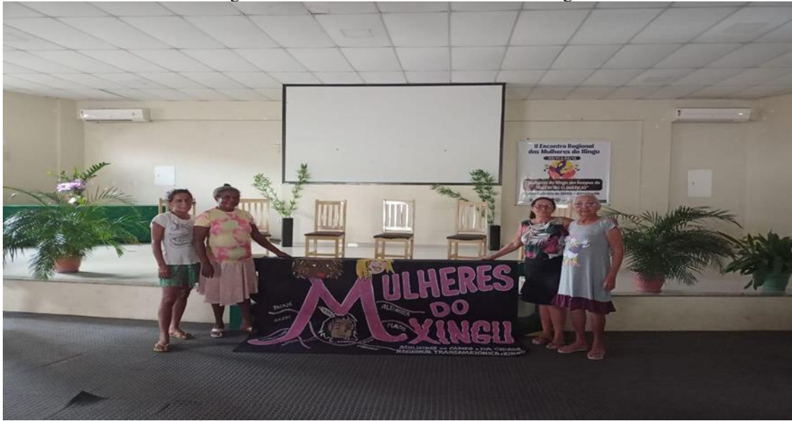
Figura 22 – Encontro de mulheres do Xingu