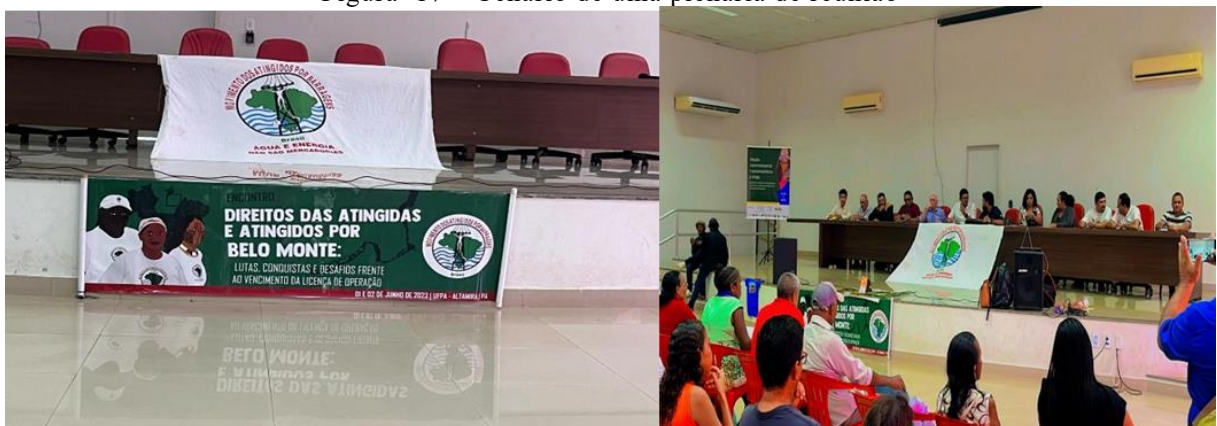
Figura 17 – Cenário de uma plenária de reunião

Atualmente a luta persistente por todas a comunidades atingidas tem sido evidenciada pelo Movimento atingido por Barragem MAB na figura 17. Não se pode negar que se fazem presente e todos os espaços, seja na luta por moradia, pelo reconhecimento das mulheres pescadoras da associação de pilotos do rio Xingu.