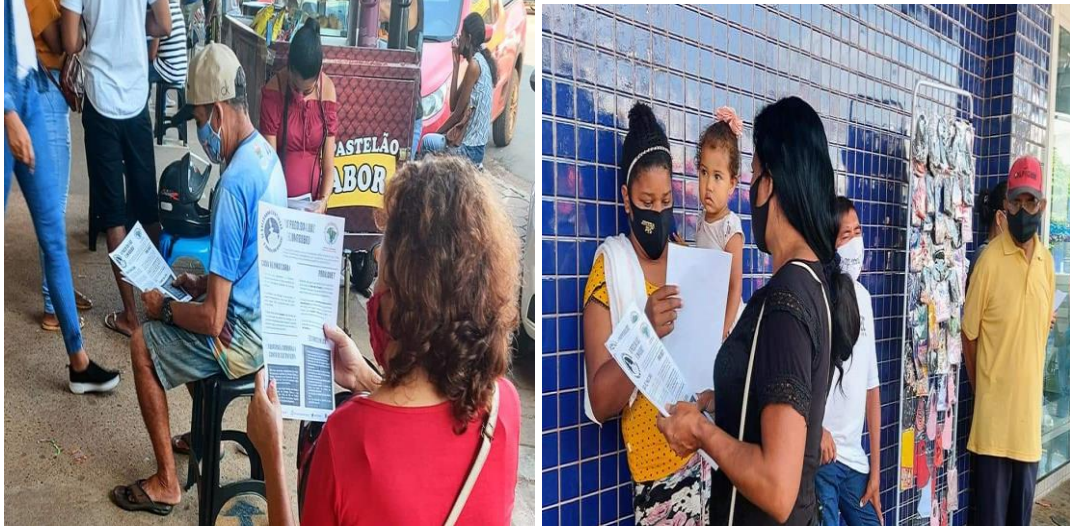
Figura 21 – Distribuição de Jornais com noticiários sobre altas taxas de energias cobradas