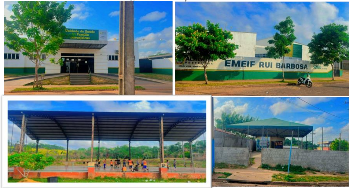
Figura 6 – Serviços básicos