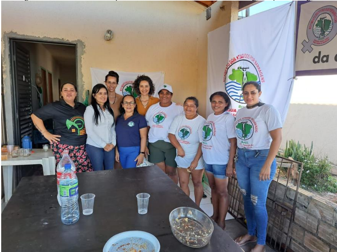
Figura 11 – Oficina com representantes Movimento mulheres atingidas por Barragem