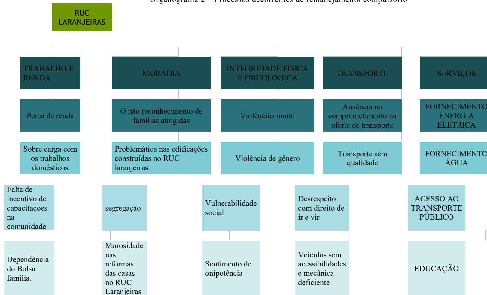
Organograma 2 – Processos decorrentes de remanejamento compulsório