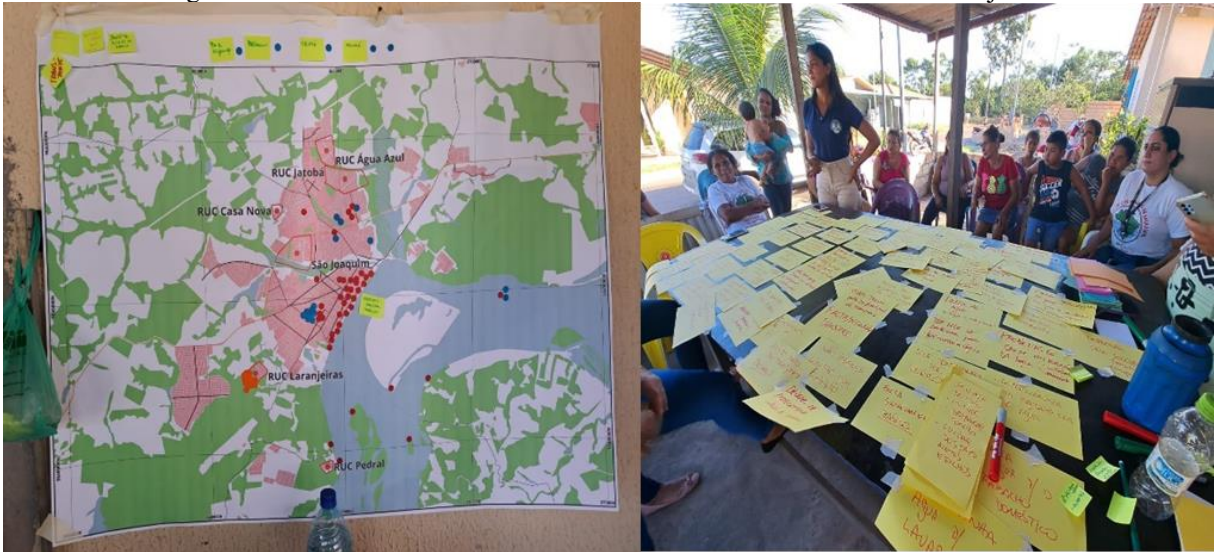
Figura 3 – Oficina realizada com as mulheres moradoras RUC Laranjeiras