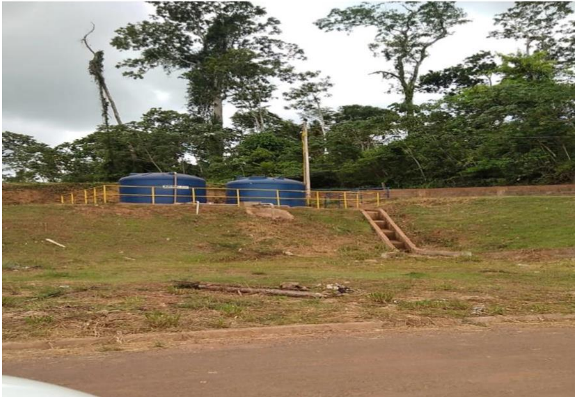
Figura 19 – Reservatório RUC Laranjeiras