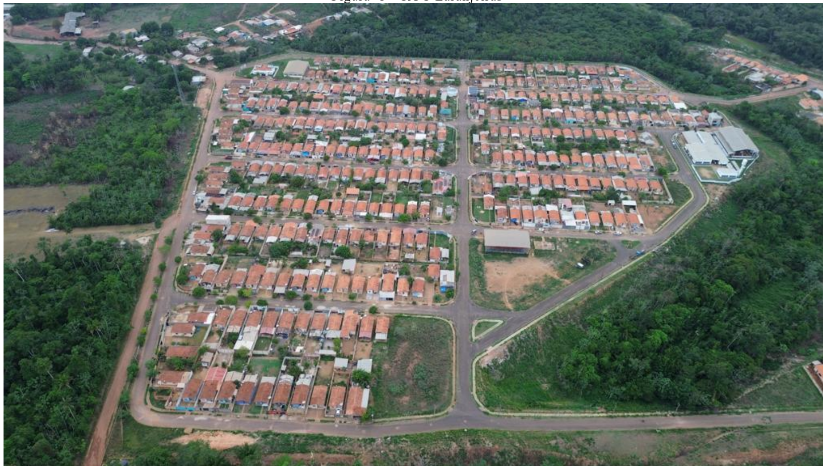
Figura 1 – RUC Laranjeiras