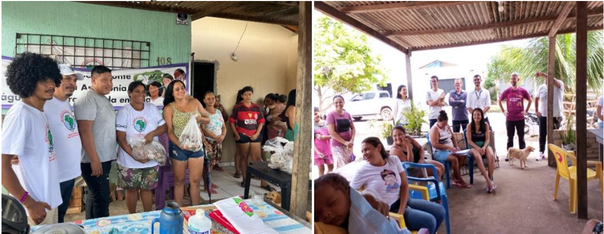
Figura 2 – Reuniões na Residência de Moradores RUC