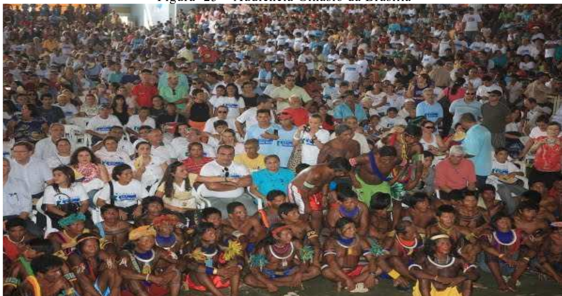
Figura 23 – Audiência Ginásio da Brasília