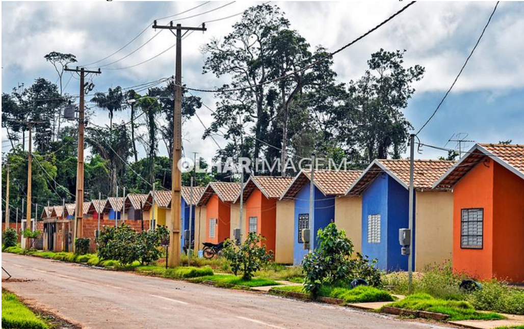
Figura 5 – Reassentamento urbano coletivo Laranjeiras