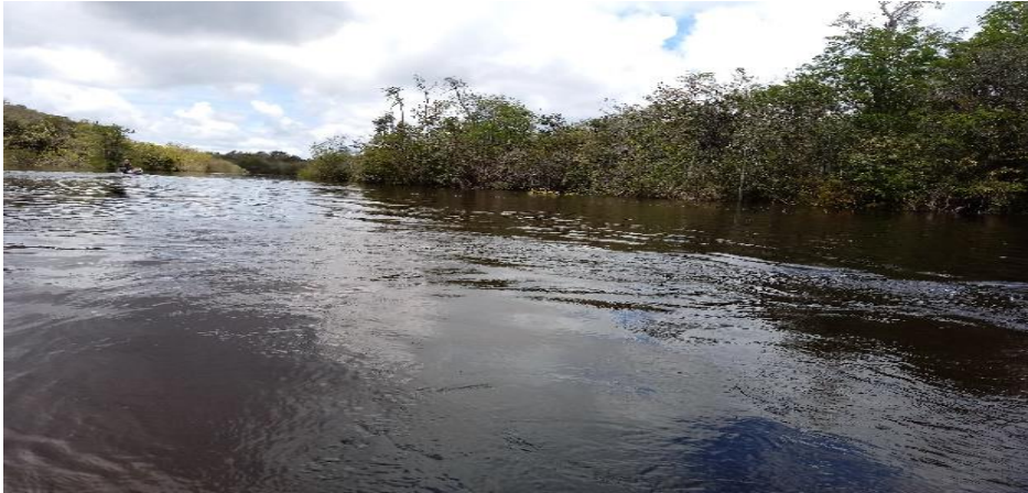
Rio Cairari, às proximidades da Aldeia Anambé

Acerca das vias de acesso à Comunidade Indígena dos Anambé é válido, ainda, ressaltar que não há transporte coletivo no trecho Vila Elim - Aldeia Anambé. O mesmo é percorrido de modo particular, fato que dificulta ainda mais a chegada de visitantes à Comunidade. Por esse motivo, predomina a utilização da via terrestre mediante o pagamento de uma ‘corrida’ a algum proprietário de motocicleta 35 . A utilização da via fluvial é limitada ao transporte de mercadorias para subsistência das famílias da Aldeia quando estas vão à cidade receber o pagamento de algum benefício social ou vender sua produção de farinha. Nestas ocasiões costumam comprar uma maior quantidade de gêneros alimentícios (cestas básicas) para “passar o mês”. Nestes casos, familiares dos indígenas que foram para a cidade vêm aos seus encontros em embarcações suficientes para o transporte da mercadoria adquirida, juntamente com seus familiares.