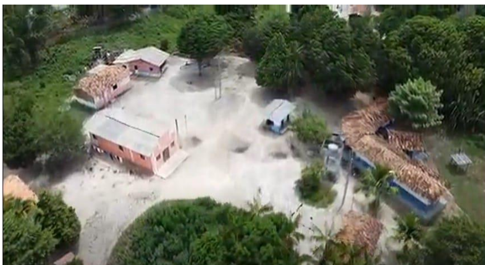
Figura 05: Comunidade Mapurupy-Anambé (núcleo da Igreja)

Imagem aérea do núcleo dos Mapurupy-Anambé onde se localiza a Igreja Protestante (ao centro), a casa do pastor (ao fundo) e o posto de Saúde Indígena (à direita)