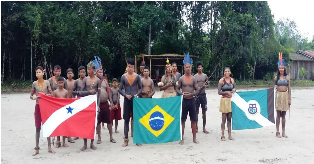
Momento do Hino Nacional Brasileiro. Fonte: Acervo pessoal (19 abr. 2023)

Conforme podemos verificar, mesmo tratando-se de um evento de caráter cultural, a Celebração do Dia dos Povos Indígenas reproduz o costume presente nas solenidades civis que prescrevem a entoação dos hinos nacional e municipal, nos inícios das programações. A observação dos Anambé enfileirados para cumprir seu “dever cívico” destaca-se, ainda, pela presença de não indígenas, totalmente caracterizados como os demais, participando deste e de outros momentos durante a programação.