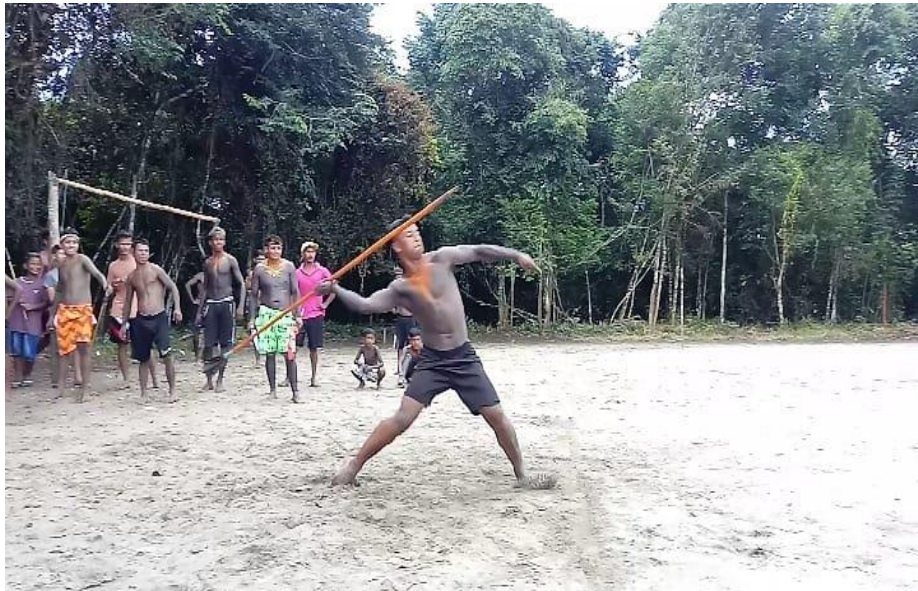
Prova do arremesso de lança masculina adulta.