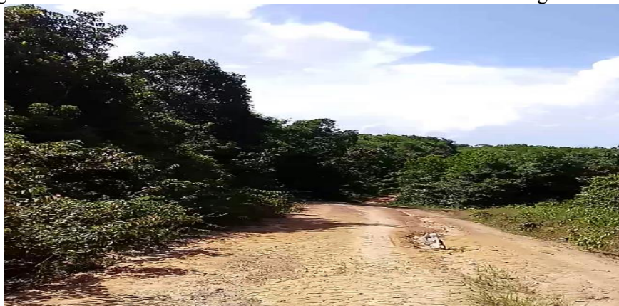
Trecho da estrada entre a Aldeia Anambé e a Vila Elim. Fonte: Acervo pessoal – registro em 27 nov. 2023