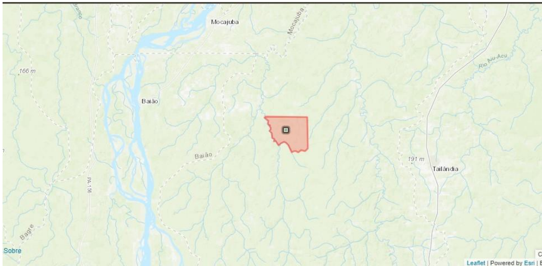
Figura 03: Localização da TI Anambé

Região do grande lago – Rio Cairari, onde localiza-se a Comunidade Indígena dos Anambé, circundada pelos Municípios paraenses de Mocajuba, Baião e Tailândia