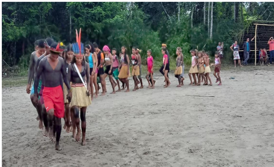
Figura 16 - Apresentação cultural feita pelas novas gerações dos Anambé

Anambé dançando e cantando a exaltação à natureza.