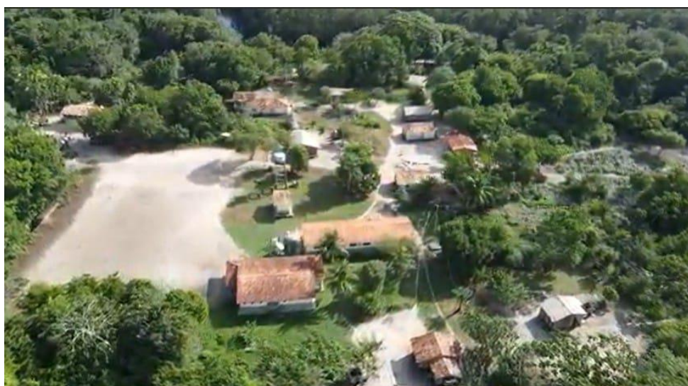
Figura 04 – Comunidade Mapurupy – Anambé (núcleo da Escola)

Imagem aérea da Comunidade Indígena Mapurupy-Anambé, destacando a arena (campo) à esquerda e a Escola Aipã Anambé, no centro abaixo.