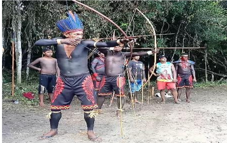
Figura 19 - Prova do arco e flecha

Guerreiros Anambé disputando a tradicional prova do “Arco e flecha”.