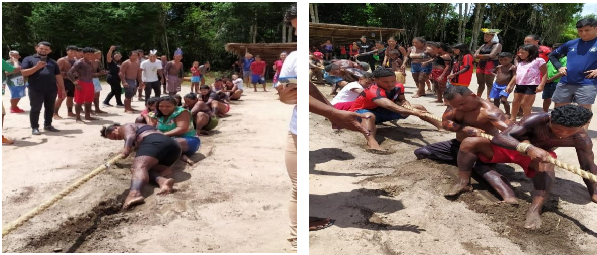
Não indígenas participando das modalidades esportivas na Celebração do Dia dos Povos Indígenas Fonte: Acervo pessoal (19 abr. 2024)

As entrevistas aqui relatadas revelam que os não indígenas que moram na TI Anambé possuem ‘livre arbítrio’, para decidirem sobre seu envolvimento com as questões identitárias e culturais da Comunidade. Em sua maioria não participam, devido à falta de envolvimento de suas/seus companheiras/os.