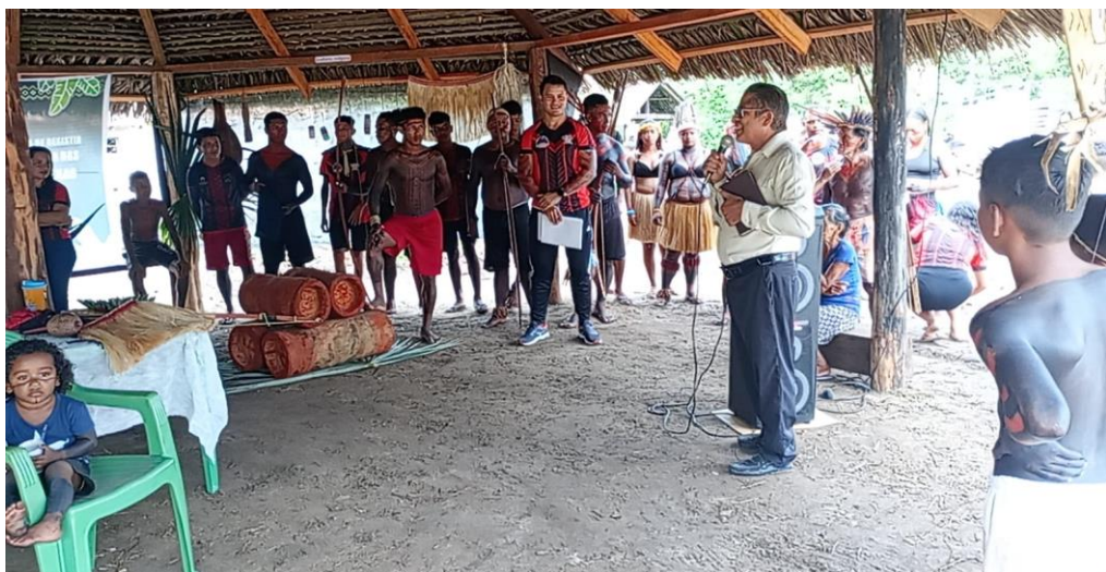
Pastor da Assembleia de Deus conduzindo a oração no início da Celebração do Dia dos Povos Indígenas.

O evento, organizado principalmente pelo corpo docente e discente da Escola da Comunidade com a contribuição das lideranças indígenas, embora disponha da ilustre presença do pastor, convidado para conduzir um momento de oração aos moldes Evangélicos, se notabiliza pela ausência da Comunidade Indígena Yetehu, antes um núcleo dos Anambé, hoje uma aldeia independente, constituída basicamente pelas famílias “crentes”, o que nos dizeres de Araújo e Cruz (2023) denuncia