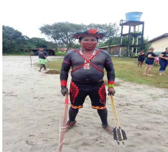
Figura 02 - Pintura corporal masculina

Fonte: acervo particular Registro em 19/04/2023