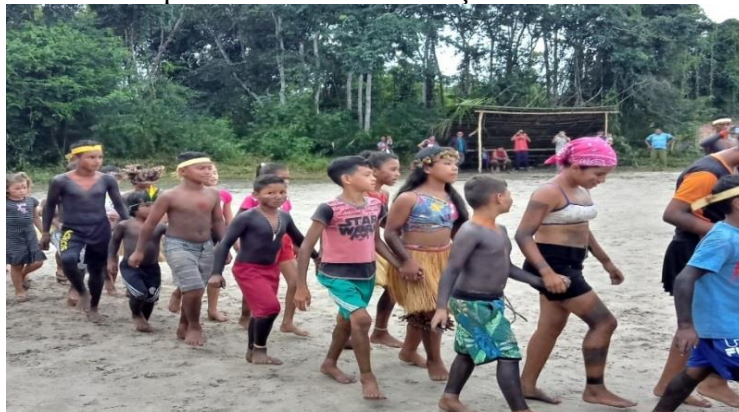
Figura 12 - Os neopentecostais na celebração do Dia dos Povos Indígenas

Apresentação cultural das crianças Anambé na Celebração do Dia dos Povos Indígenas