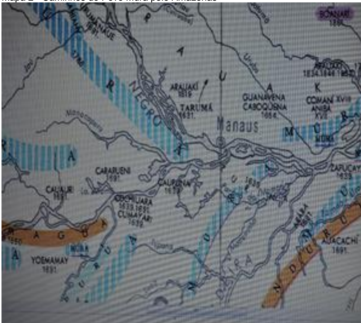
Mapa 2 - Caminhos do Povo Mura pelo Amazonas