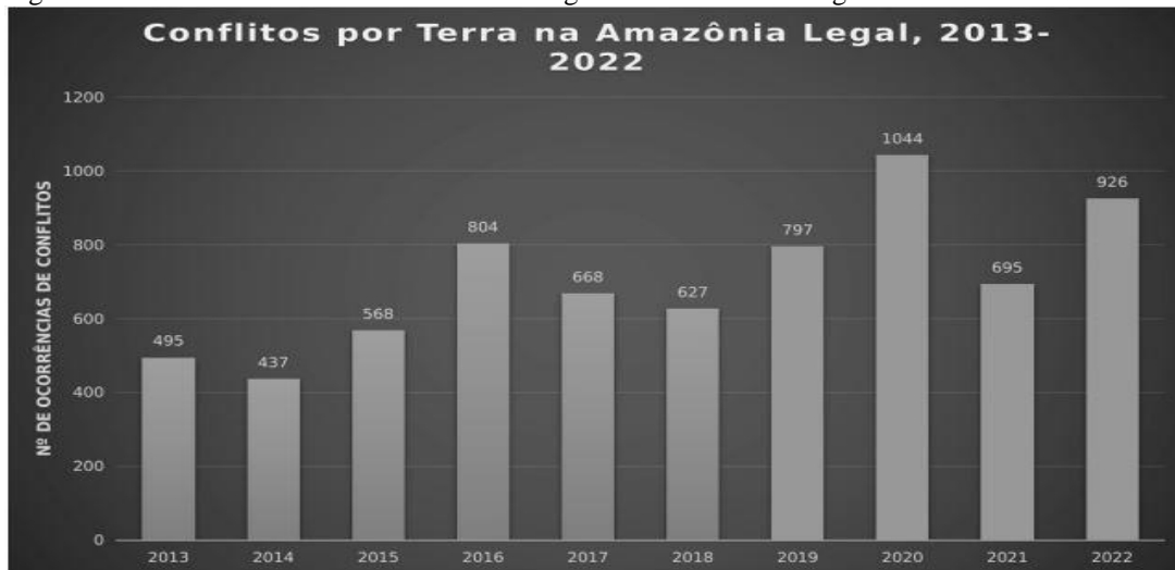
Figura 1 - Gráfico de Ocorrências de Conflito Agrário na Amazonia Legal