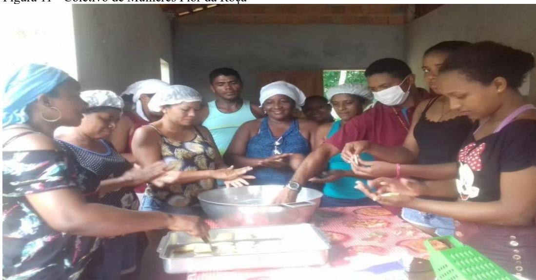
Foto: Segunda fase do Prêmio Consulado da Mulher – 6ª Parada: Pará - Consulado da Mulher

Na imagem acima, o Coletivo de Mulheres utiliza conjuntamente o que no território chamamos de tacho, as mulheres preparam a massa, para a fabricação do delicioso biscoito de Castanha-do-Pará. O Coletivo de Mulheres do Quilombo, tem como objetivo principal o