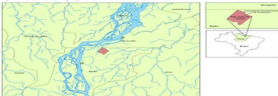
Figura 3 - Localização geográfica do Quilombo São José de Icatu – Baião/PA