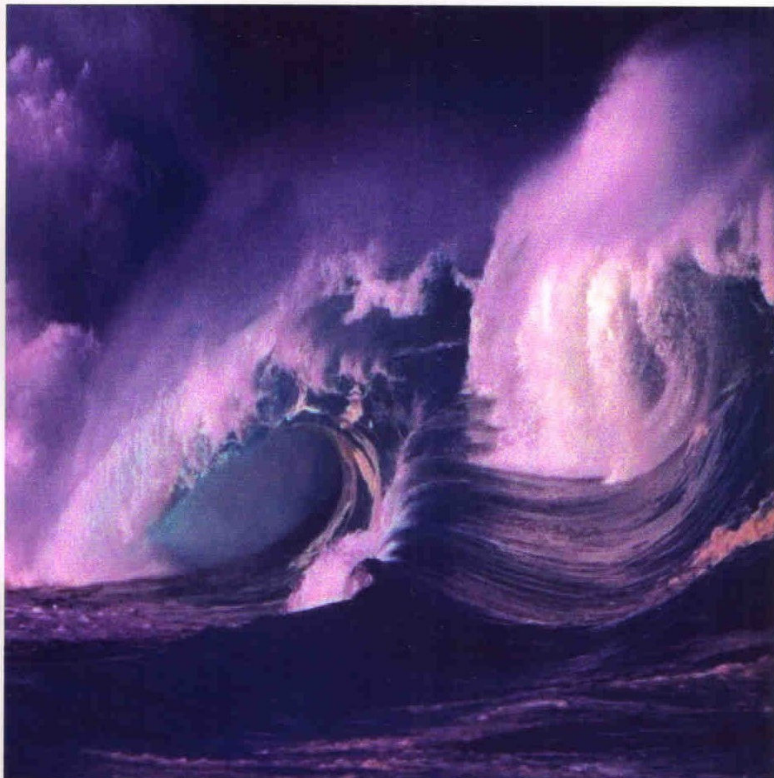
Arte: Luís Duverg

Quando você foi embora Fez-se noite em meu viver Forte eu sou, mas não tem jeito, Hoje eu tenho que chorar (...)