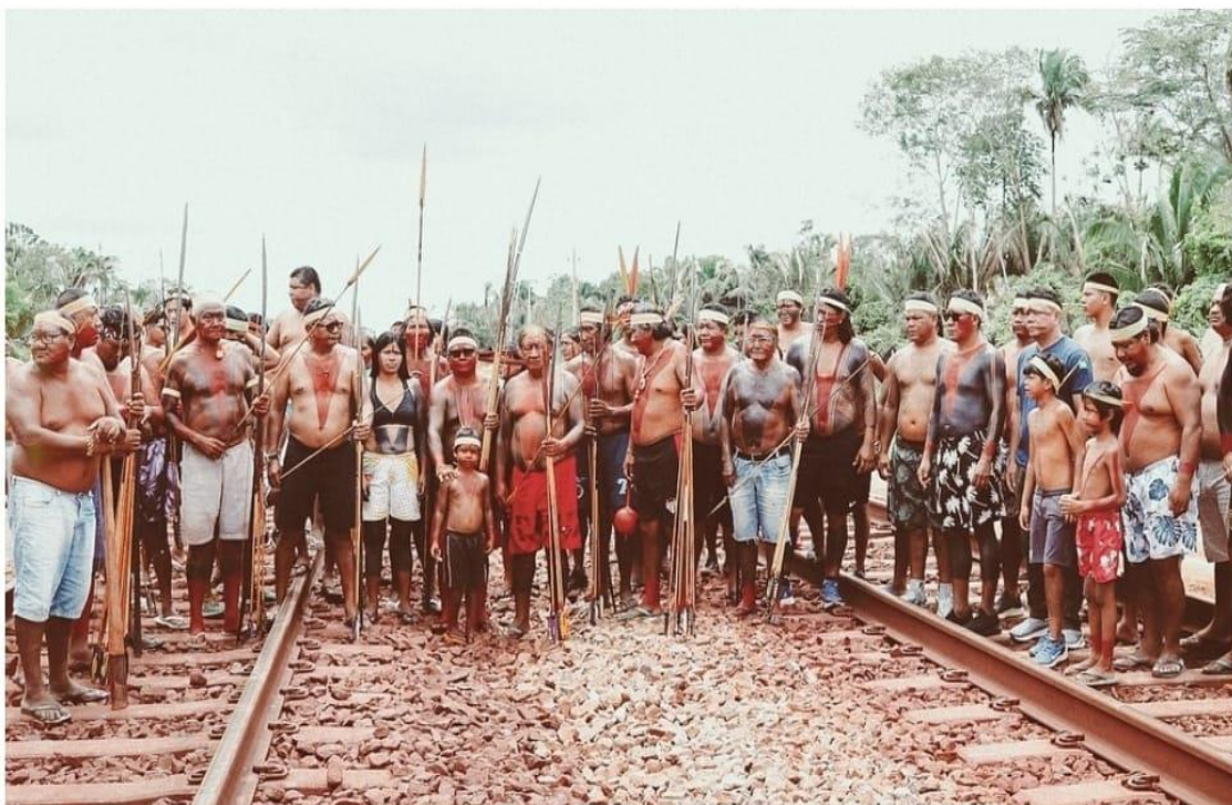
Figura 3: Lideranças da RIMM ocupam o trilho da Estrada de Ferro Carajás em protesto contra a Vale