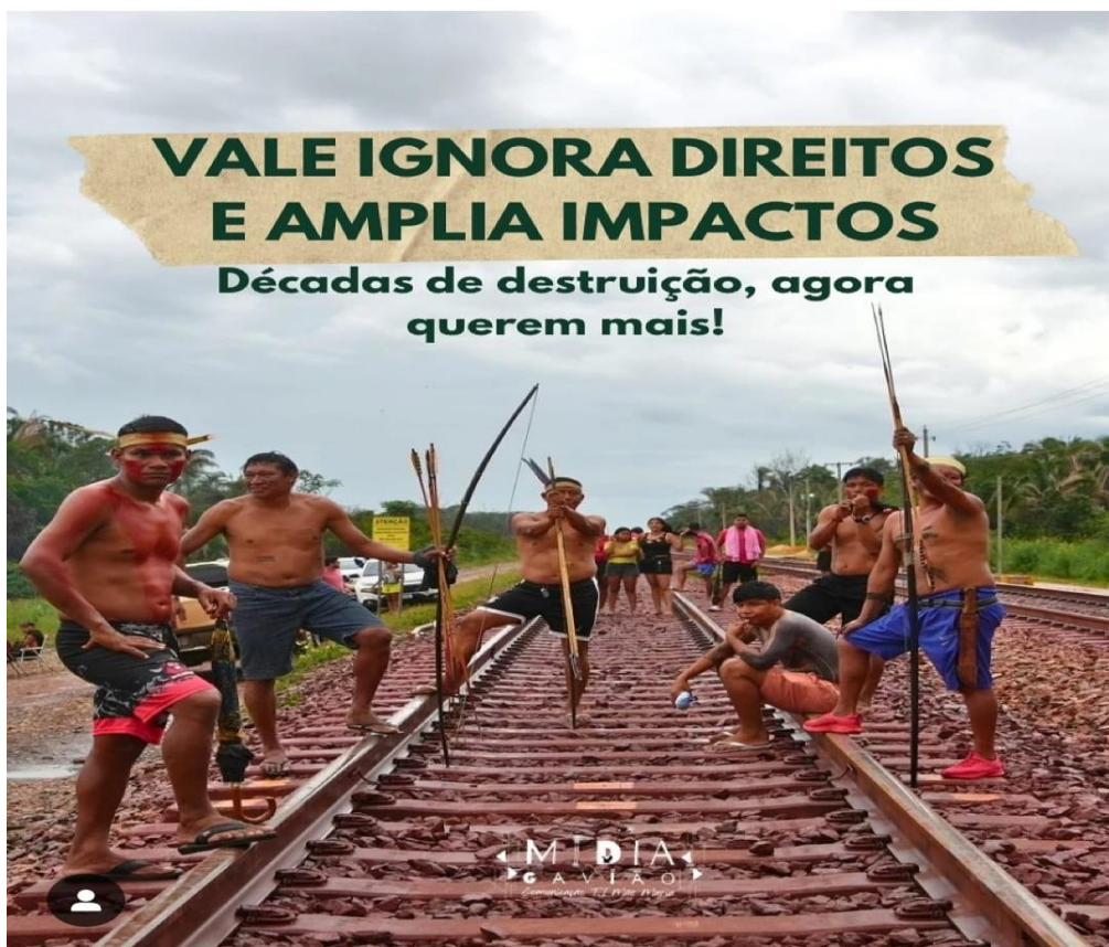
Figura 4: Destaque nas redes sociais da ocupação do trilho da Estrada de Ferro Carajás em protesto contra a Vale