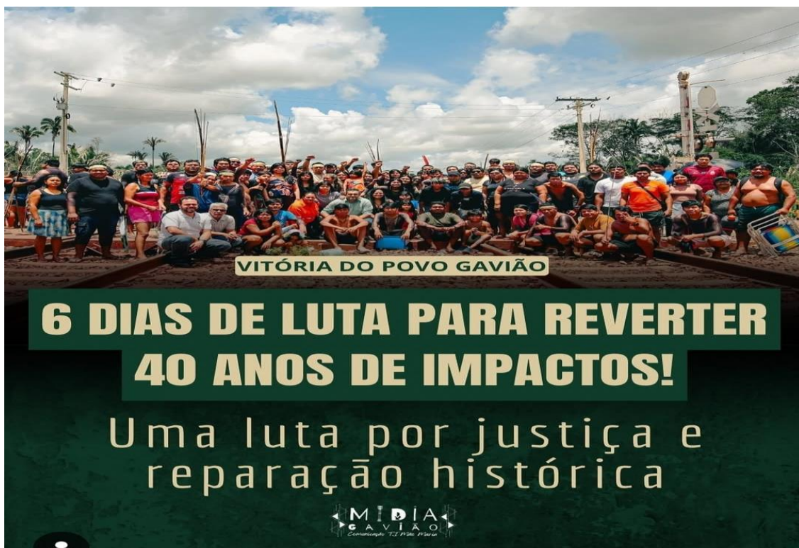
Figura 2 – Mobilização dos povos da RIMM na Estrada de Ferro Carajás