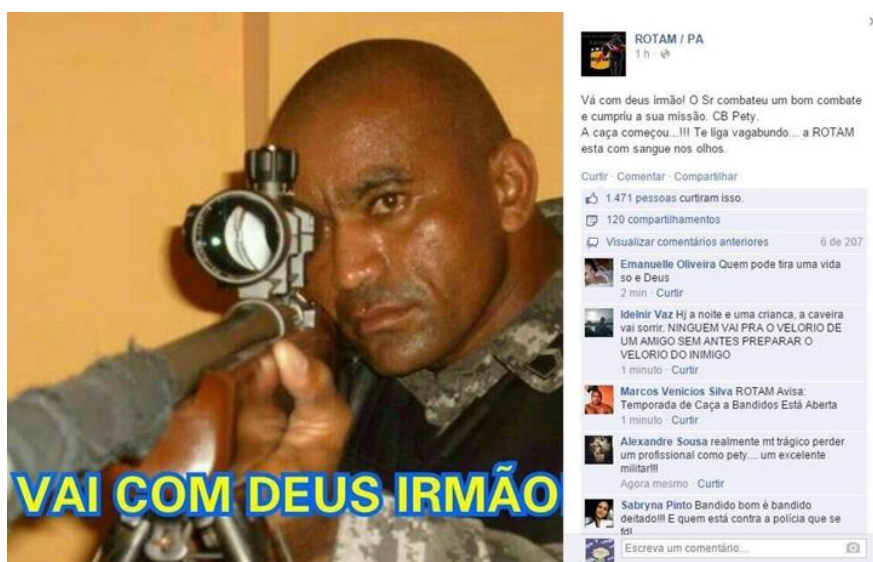
Imagem 2 – Publicação da Rotam-Pa