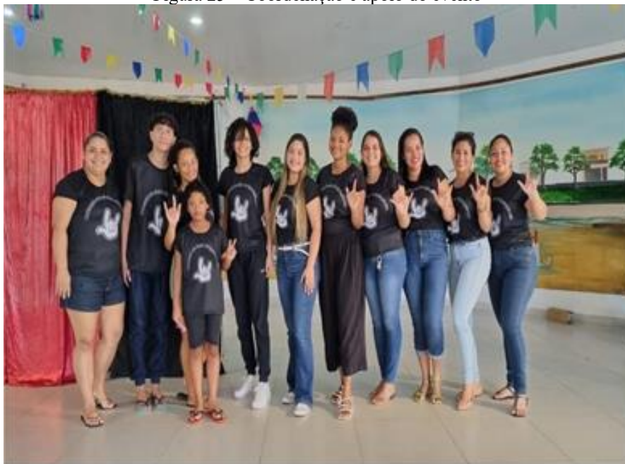
Figura 25 – Coordenação e apoio do evento

A Figura 24 mostra a plateia atenta às apresentações enquanto interage com os artistas surdos. É importante ressaltar que o evento proporcionou momentos de interação para todo o público, surdo e ouvinte, graças à atuação das intérpretes de Libras, que garantiram a mediação e promoveram a inclusão entre surdos e ouvintes.