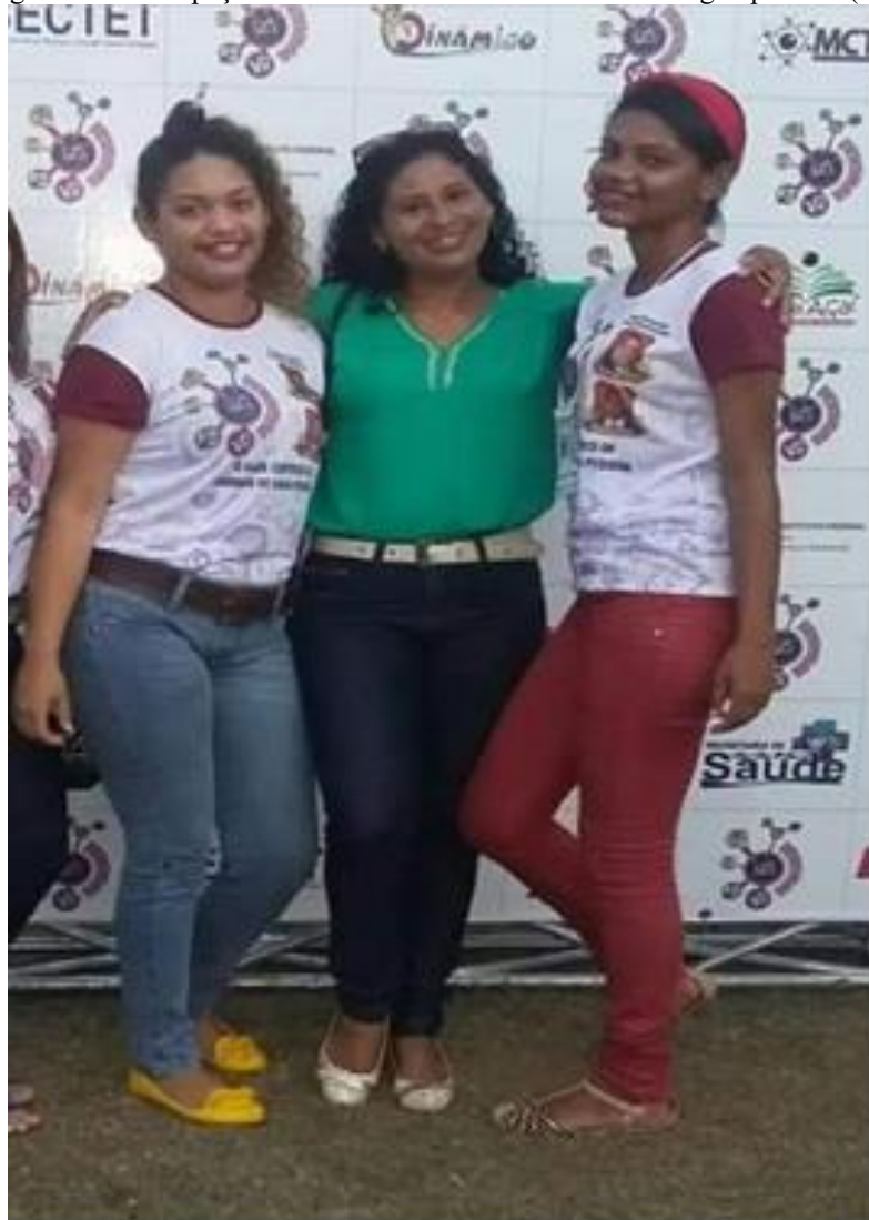
Figura 7 – Participação das surdas na Feira de Ciências em Igarapé-Miri (PA)