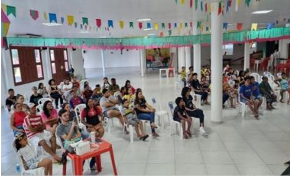
Figura 24 – Plateia atenta a encenação teatral