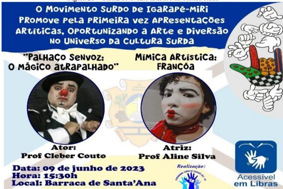
Figura 21 – Cartaz do evento artístico da cultura surda