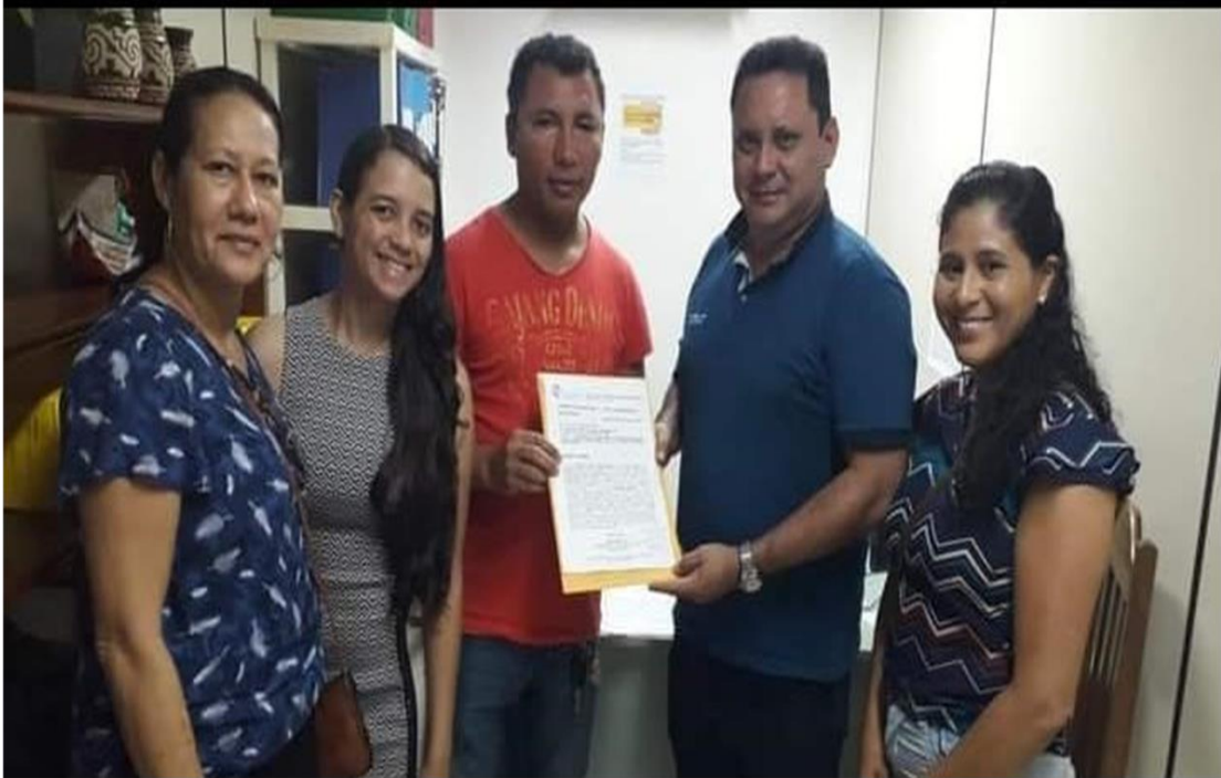
Figura 14 – Entrega de documentos na Prefeitura para a criação de cargos para acessibilidade em Igarapé-Miri