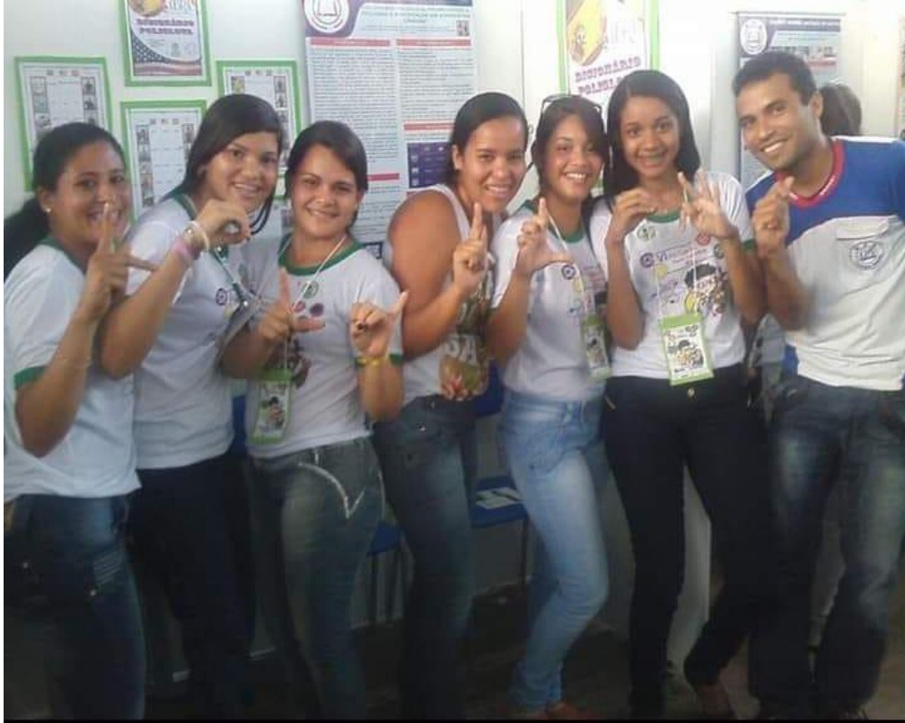
Figura 16 – Participação no projeto dicionário poliglota (inglês, português, espanhol e Libras) na FEICIMAC