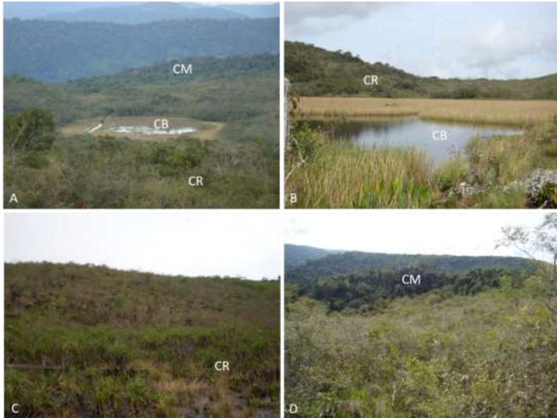
Fig. 2 a) Mosaico das fitofisionomias que compõem as áreas de savana: Capão de mata (CM), Campo rupestre (CR) e Campo brejoso (CB). b) Campo brejoso com vegetação de gramíneas circundado por campo rupestre. c) Campo rupestre com vegetação herbáceo-arbustiva e predomínio de Vellozia sp.. d) Capão de mata (ilha de vegetação arbórea), circundado por campo rupestre