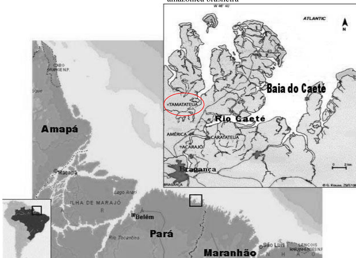
Figura 1: Mapa de localização da comunidade de Tamatateua, Município de Bragança, costa amazônica brasileira